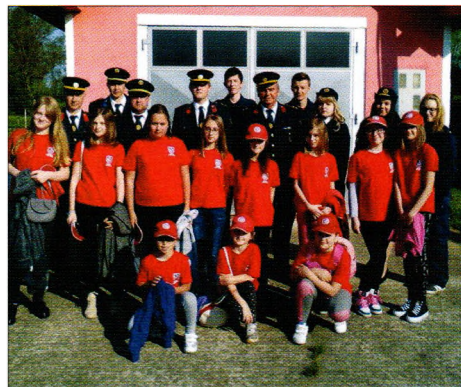
DVD Komarnica Ludbreška pred odlazak na obilježavanje Florijanova

O novim donacijama određene sitnije vatrogasne opreme možete pročitati više u nastavku, s obzirom na nastavak uspješne suradnje sa stranim organizacijama.