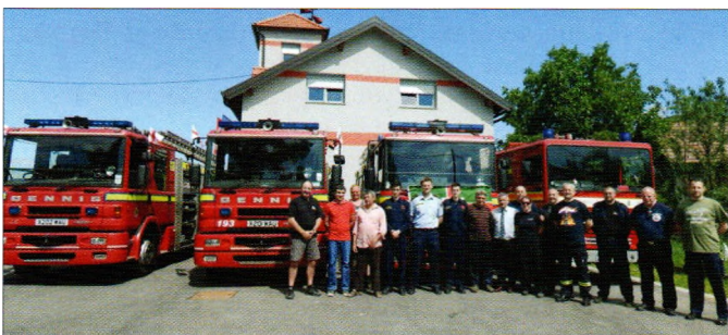
Nova donacija prijatelja iz Velike Britanije - ovog puta Martijanecu i Malom Bukovcu

Predstavnici Hrvatske iskoristili su ovaj posjet i za nastup na svjetskoj smotri snage i spretnosti u vatrogastvu, odnosno prestižnom natjecanju pod nazivom British Firefighter Challenge.