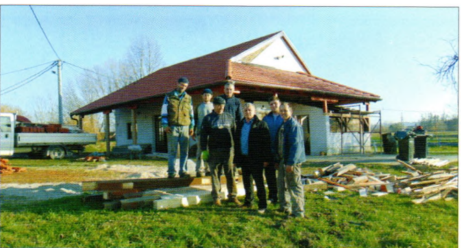
Radovi na krovštu društvenog doma u Obrankovcu