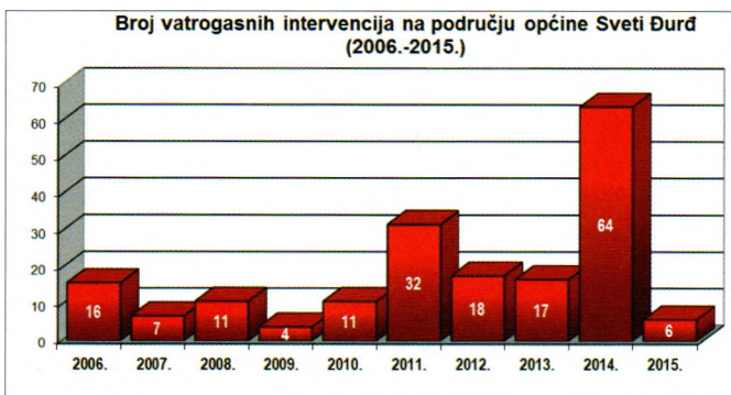
Statistika intervencija tijekom 10-godišnjeg razdoblja

Nakon rekordnog broja izlazaka na intervenciju u 2014. godini, već je prošla 2015. godina ukazala kako se majka priroda malo „smirila“, ali i da su određene aktivnosti na uređenju korita rijeka i potoka pokrenute od strane Općine Sveti Đurđ urodile plodom. Tako su i ove godine postrojbe svih 6 DVD-ova s područja općine do početka mjeseca prosinca ove godine imale samo 5 intervencija, što je daleko ispod višegodišnjeg prosjeka koji iznosi 16 intervencija godišnje. Među intervencijama je bilo i nekoliko