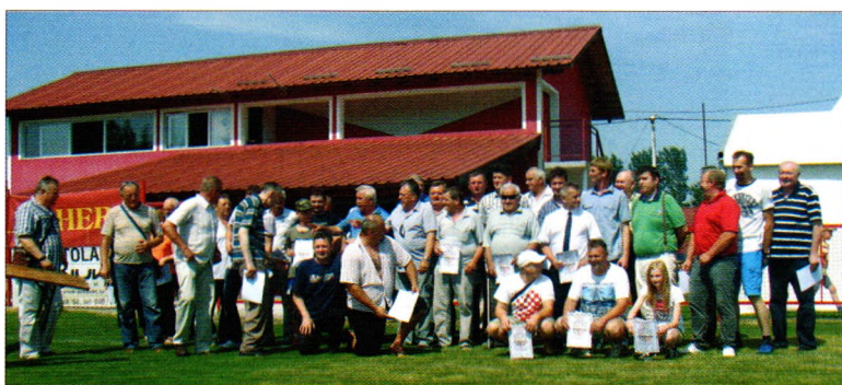
Zajednička fotografija generacija NK Radničkog

Nakon ručka za sve goste, odigrane su i dvije prijateljske nogometne utakmice u kojima su u seniorskoj konkurenciji igrali vodeća ekipa MŽNL KC-BJ-VT Tehničar 194 iz Cvetkovca protiv selekcije općine Sveti Đurđ, a u veteranskoj konkurenciji Slaven-Belupo iz Koprivnice protiv selekcije Ludbreške regije.