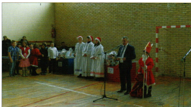
Dan Sv. Nikole