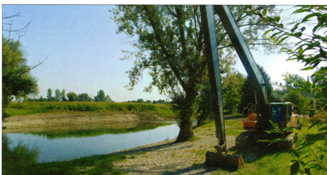
Izmuljivanje rijeke Plitvice