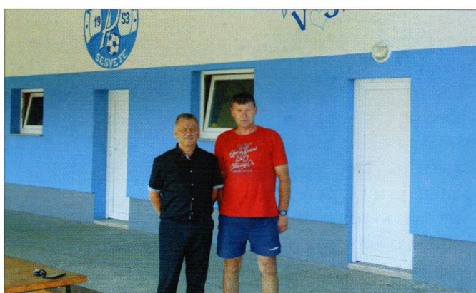
Nova termo fasada NK Podravac