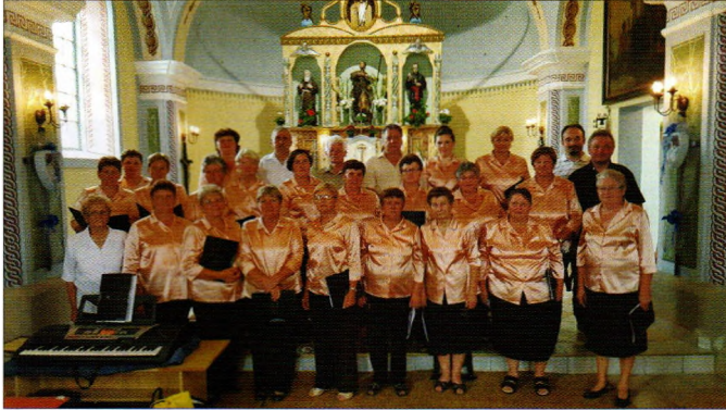
Crkveni zbor župe Sveti Đurđ Sveti Juraj

Crkveni zbor župe Sveti Đurđ "Sveti Juraj" osnovan je prije 12 godina. Rado dolazimo na probe pjevanja i pjesmom pratimo sva crkvena događanja a ima ih mnogo. Svako selo ima svog jednog ili više zaštitnika pa su česta