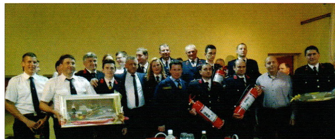
Detalj s bratimljenja DVD-a Sveti Đurđ i PGD-a Smednik

Zbog objektivnih poteškoća glede raspoloživosti vozača za navalna vozila DVD-a Sveti Đurđ, inicijativom Zajednice i DVD-a