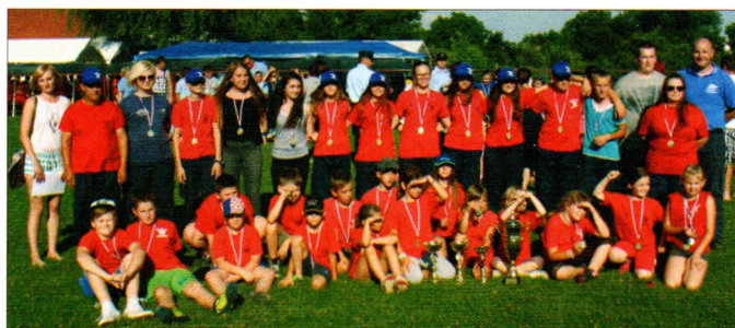
Regionalni prvaci - mladež DVD-a Hrženica

Valja se podsjetiti i kako je dvogodišnja suradnja DVD-a Sveti Đurd i PGD-a Smlednik ove godine na Dan Općine Sveti Đurd