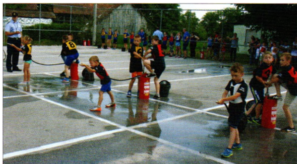
Regionalno natjecanje u Malom Bukovcu - podmladak DVD-a Sveti Đurđ

snage značajno je nadomjestila ogromna razina entuzijazma i borbenosti kod mališana koji najčešće sanjaju bogatu karijeru u vatrogastvu.