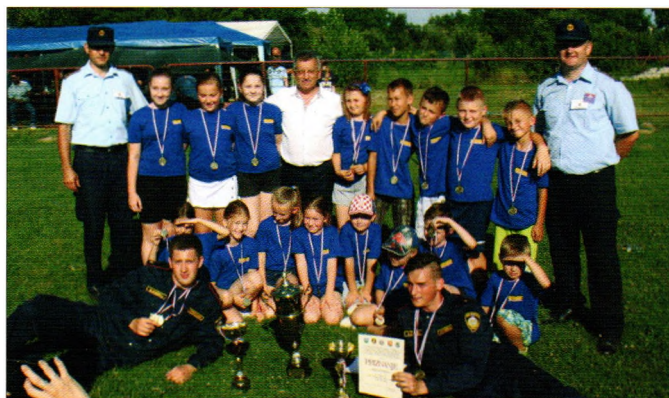
Podmladak DVD-a Struga - prvaci ludbreške regije

Kad se spominju vjerske manifestacije recimo kako su članovi naših DVD-ova sudjelovali u Tijelovu, zatim u hodočašću vatrogasaca ludbreške regije u Svetište Predragocjene Krvi Kristove u Ludbreg (DVD Struga, DVD Sveti Đurd i DVD Hrženica), a tradicionalno su držali stražu kod Božjeg groba na Veliku subotu u župnoj crkvi u Svetom Đurdu.