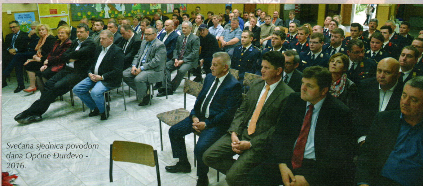
Svečana sjednica povodom dana Općine Đurđevo - 2016.