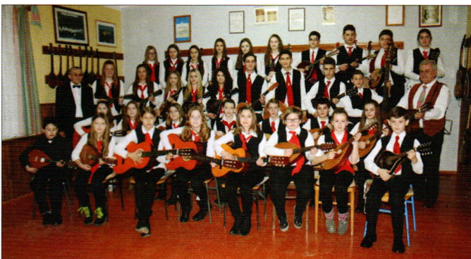
KUD Juraj Lončarić

Godinu smo započeli nastupom u Ludbregu, kao gosti KUD – a „Anka Ošpuh“ , gdje smo u suradnji sa zborom „Pajdašice i Pajdaši“ završavali na memorijalu „Tete Mire“. Sudjelovali smo na Županijskoj smotri glazbenog stvaralaštva djece i mladih te na smotri KUD – ova tamburaških orkestrara. U suradnji sa varaždinskim zborom „Kapela Paulina Warasdin“ nastupali smo na Danima Banfice. Redovni smo sudionici u programu Dana Općine Sveti Đurđ, a i ove