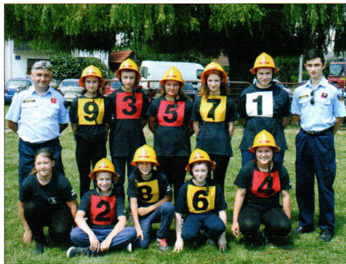
Muška mladež DVD-a Sveti Đurđ pred nastup na regionalnom natjecanju