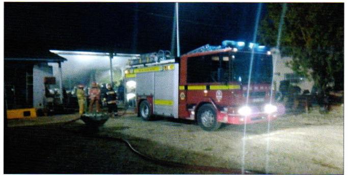
Požar na Florijanovo u Karlovcu

U svim su intervencijama iskazani maksimalni napor da se smanji nastala materijalna šteta, no ista je na žalost nekad neizbježna, što dodatno naglašava potrebu promicanja protupožarne preventive.