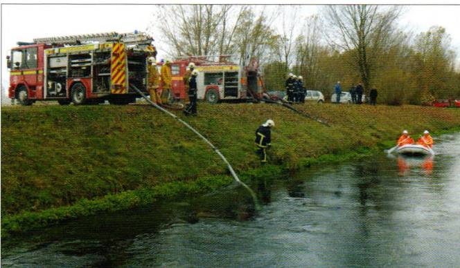
Provjera vatrogasne tehnike u Strugi