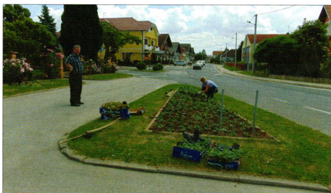
Sadnja cvijeća ispred crkve u Svetom Đurđu