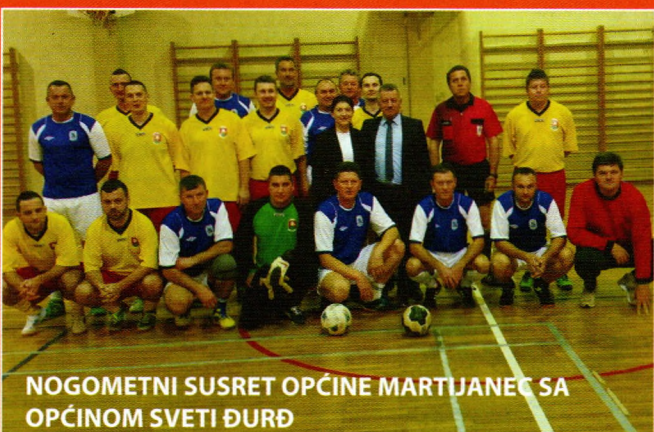
NOGOMETNI SUSRET OPĆINE MARTIJANEC SA OPĆINOM SVETI ĐURĐ