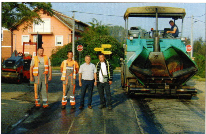
Fini sloj asfalta u Karlovcu Ludbreškom