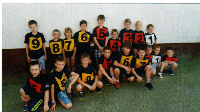
Podmladak DVD-a Sveti Đurđ na natjecanju u Rasinji

Članovi DVD-a Hrženica osvojili su prvo mjesto u kategoriji muške mladeži od 12 do 16 godina ispred DVD-a Karlovec Ludbreški i DVD-a Sveti Đurđ, pri čemu treba reći kako su ovo bili