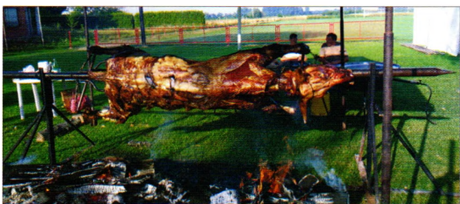
Vol i nova ograda