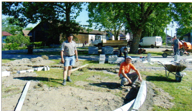
Uređenje prostora ispred društvenog doma u Strugi