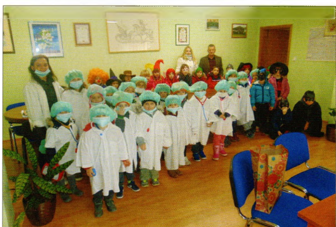
Dječji vrtić Lavić