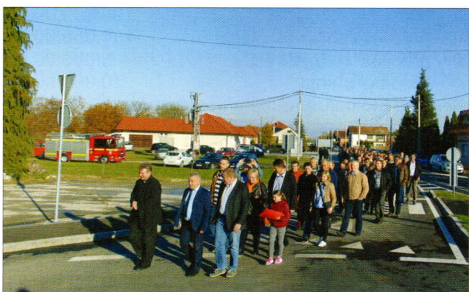
Na otvorenju kružnog toka u Luki Ludbreškoj