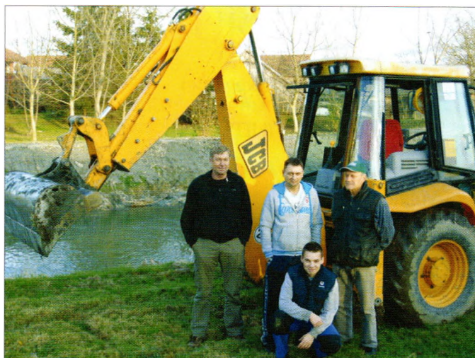
Radovi na uređenju rijeke Plitvice