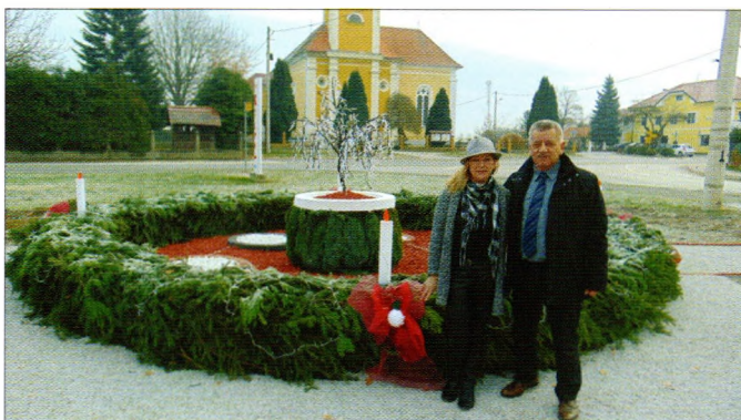
Adventski vijenac u Svetom Đurđu