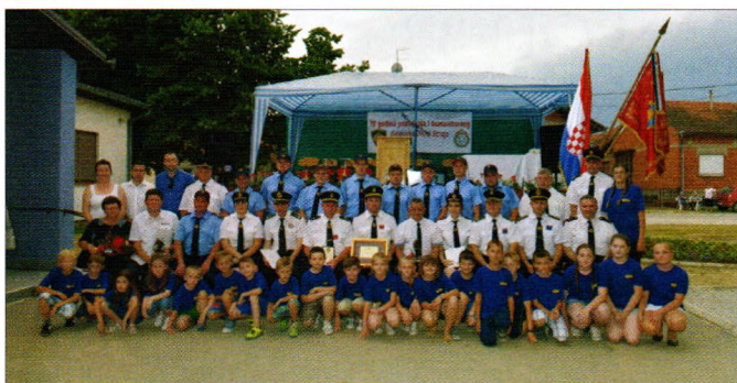
Svečano obilježeno 70 godina DVD-a Struga