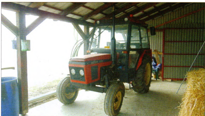
Novi traktor Općine