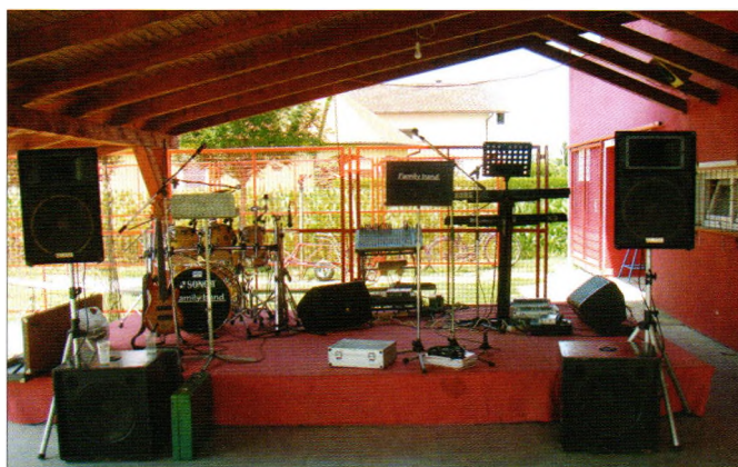
Bina za muziku

Evo i jednog citata iz referata koji je prezentiran na samoj svečanoj sjednici: „.....Naš klub, naš ponos, naš Hrzenički Radnički danas slavi 65. rođendan. Još tamo davne 1951. godine, u prošlom 20. stoljeću, osnovali su ga radnici tadašnje Zadruge, pletači košara