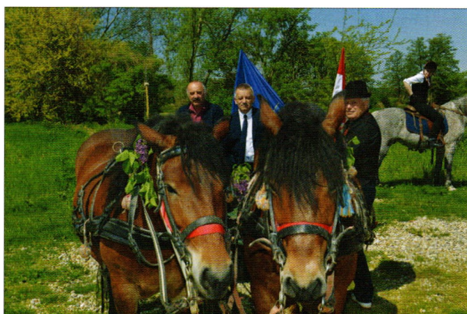
Vožnja kočijom na likovnoj koloniji