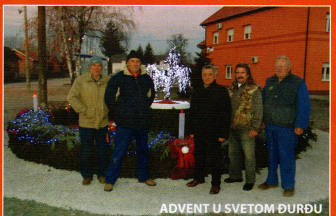
ADVENT U SVETOM ĐURĐU