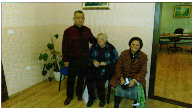
Dodjela poklon bonova umirovljenicima