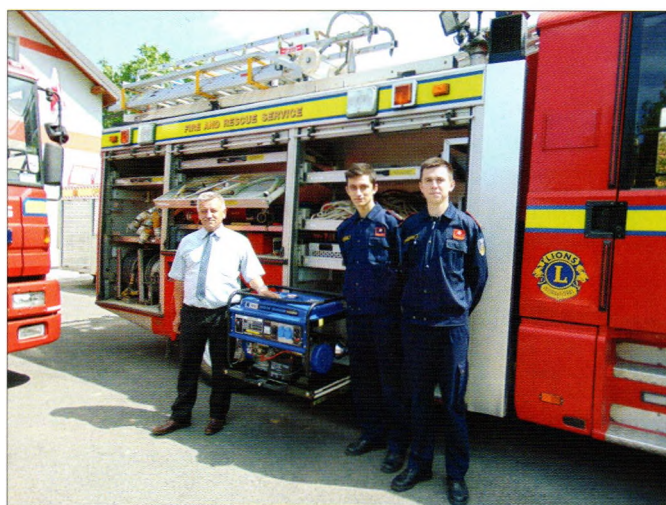
Novi agregat DVD-a Sveti Đurđ