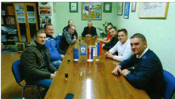
Posjet DVD-a Trbovlje