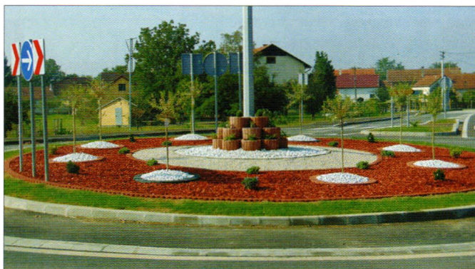
Kružni tok u Svetom Đurđu