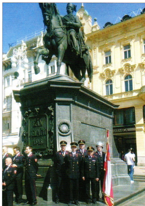
Proslava 140 godina HVZ u Zagrebu

Odjeljenje muške mladeži DVD-a Hrženica po prvi je puta nastupilo na svim natjecanjima Kupa Hrvatske vatrogasne zajednice za mladež, predstavljajući VZO odnosno Općinu Sveti Đurđ na razini Republike Hrvatske. Odjeljenje DVD-a Novi Marof i DVD-a Hrženica bila su jedina odjeljenja iz Varaždinske županije koja su ušla u konačni poredak (ukupno je sudjelovalo 50-tak odjeljenja na svim natjecanjima, dok ih je samo 12 ostvarilo uvjete za ulazak u ukupni poredak).