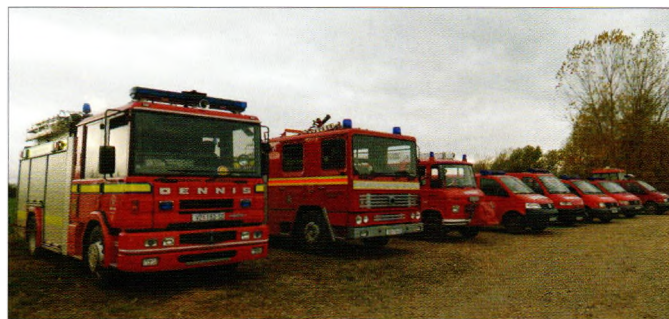
Vozni park DVD-ova u Općini Sveti Đurđ

Predsjedništvo i Zapovjedništvo VZO Sveti Đurđ