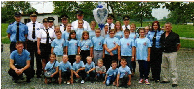
Rokovo u Karlovcu Ludbreškom

Recimo i kako su natjecateljska odjeljenja DVD-a Hrženica, DVD-a Sveti Đurđ, DVD-a Karlovec Ludbreški, DVD-a Komarnica Ludbreška i DVD-a Struga nastupila na ukupno 20-tak natjecanja u sjeverozapadnoj Hrvatskoj, osvojivši pritom brojne zaslužene pehare i medalje.