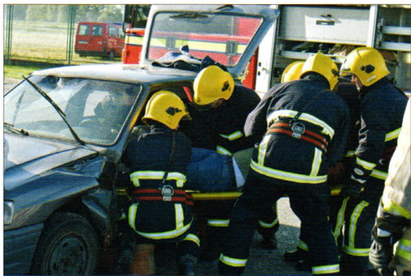
Spašavanje unesrećenog u automobilu - DVD Sveti Đurd