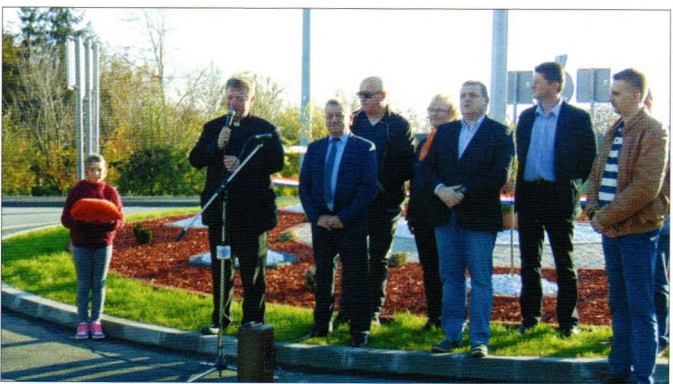
Otvorenje kružnog toka u Luki Ludbreškoj