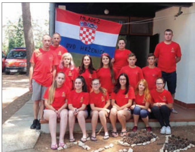
Vatrogasna mladež DVD-a Hrženica 2017. po drugi je puta boravila u Kampu Hrvatske vatrogasne zajednice u Fažani