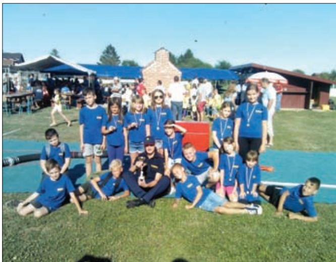
Podmladak DVD-a Struga

proračuna, s obzirom da se ne radi samo o objektu koji je nužan za objektivnu mogućnost provedbe svih zadaća koje se postavljaju pred središnje vatrogasne postrojbe u Republici Hrvatskoj, već je okosnica i cjelokupnog sustava civilne zaštite u općini. Aktivnosti samih članova na daljnjem uređenju unutrašnjosti doma intenzivirane su na samom početku godine, odnosno uoči proslave 120 godina Društva, kao i posljednjih nekoliko tjedana, posebice u smislu uređenja potkrovlja objekta.