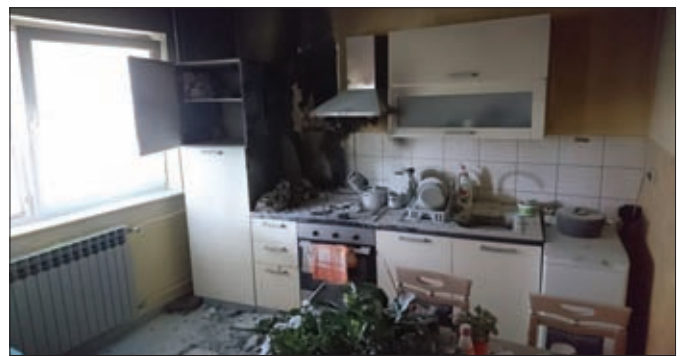
Požari stambenih i gospodarskih objekata su rijetki, no ponekad se događaju čak i eksplozije (Hrženica, 2017.)