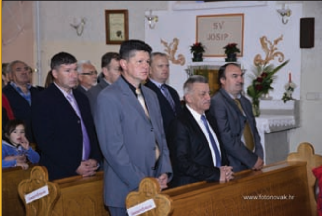
Sveta misa, Đurđevo 2017.