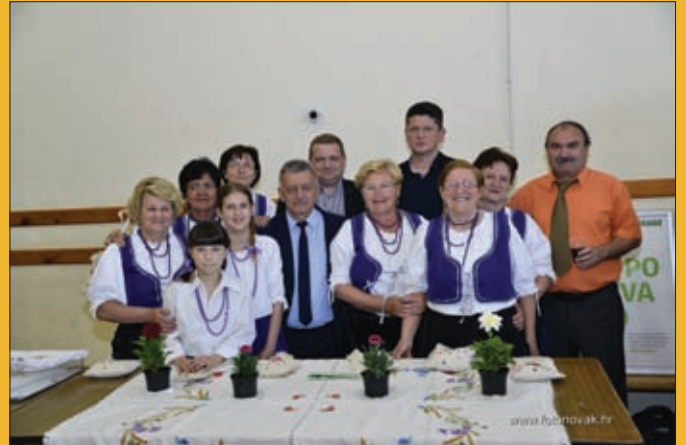
Udruga žena Đurđek