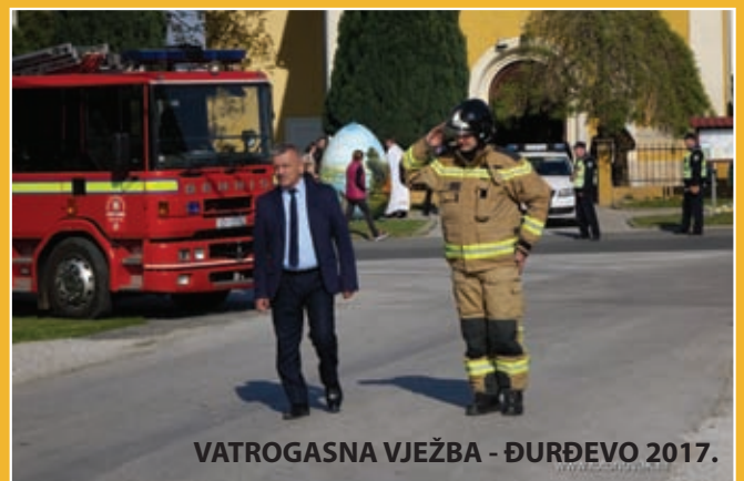
VATROGASNA VJEŽBA - ĐURĐEVO 2017.