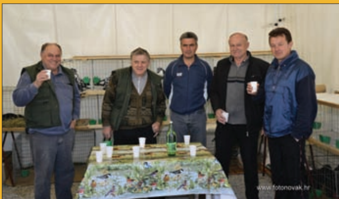
Udruga ljubitelja životinja