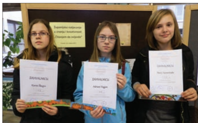
Županijsko natjecanje-Čitanje do zvijezda, veljača

• Praćenje i čitanje knjižnične građe (stručnih knjiga, pedagoško- psihološke literature, beletristike i časopisa, te iz područja knjižničarstva).