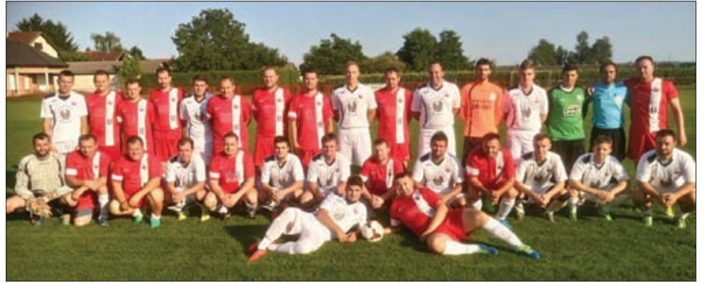
Veterani i seniorsi

Seniorsi su se čitavu jesen borili za sam vrh Lige NS Ludbreg te su na kraju osvojili 2. mjesto sa 10 pobjeda,