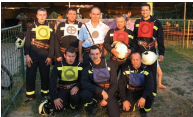
Seniori DVD-a Sesvete Ludbreške na natjecanju u Svetom Đurđu

Tijekom dvodnevnog posjeta domaćini su svojim gostima pokazali vrh Kum (1220 m) do kojeg jedina planinska cesta vodi kroz sam Dobovec. Na vrhu su gosti iz Hrvatske mogli vidjeti planinarski dom, radijski odašiljač te tamošnju crkvu svete Neže. Organiziran je potom obilazak Gasilskom zavodu Trbovlju odnosno njihovoj profesionalnoj vatrogasnoj postrojbi. Najzanimljiviji dio opreme bila je svakako 32-metarska autoljestva nabavljena prije svega nekoliko mjeseci, u kojoj su se na kraju posjeta gosti iz Hrvatske i njihovi domaćini imali prilike „provozati“ te upoznati Trbovlje i okolni kraj s 30-tak metara visine.