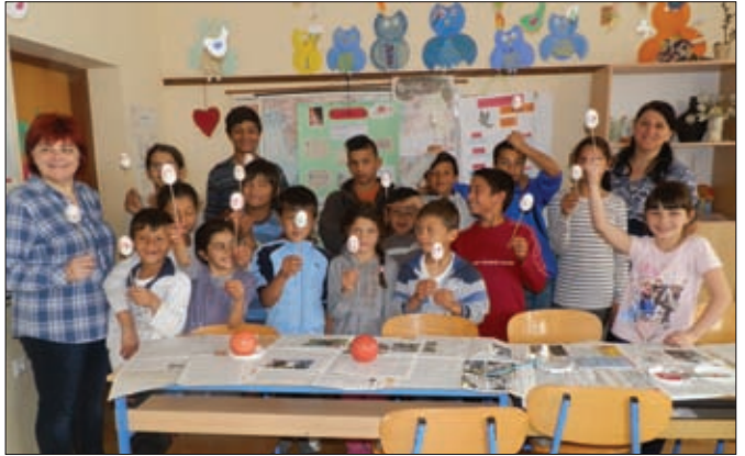
Obilježavanje Svjetskog dana Roma