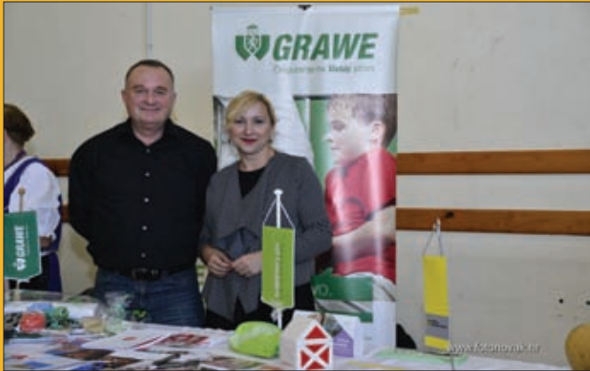
Grawe osiguranje, Kulturno-gospodarski sajam, Đurđevo 2017.