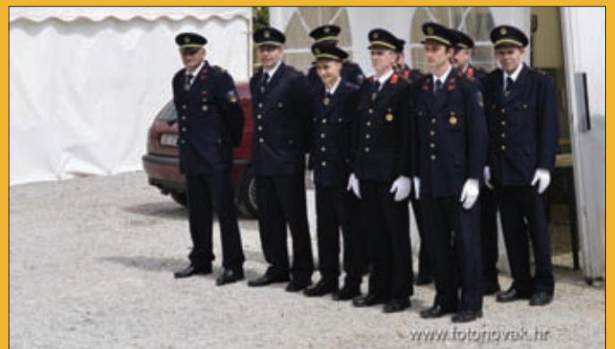
Vatrogasci Općine Sveti Đurđ, Đurđevo 2017.