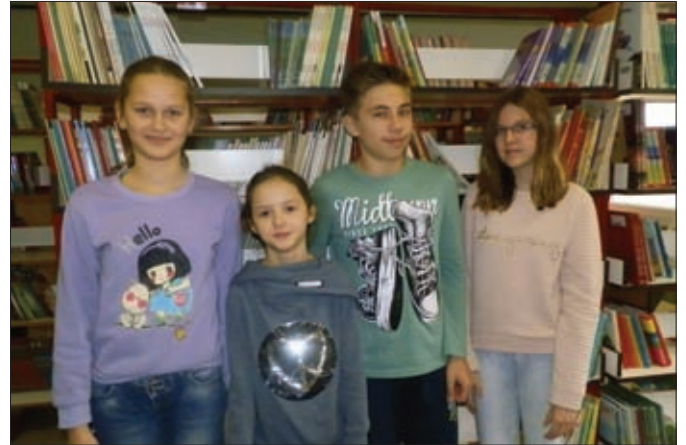
Školsko natjecanje, Čitanjem do zvijezda