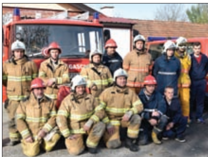
DVD Hrženica pobjednik je Prvog vatrogasnog kupa Općine Sveti Đurđ 2017. godine