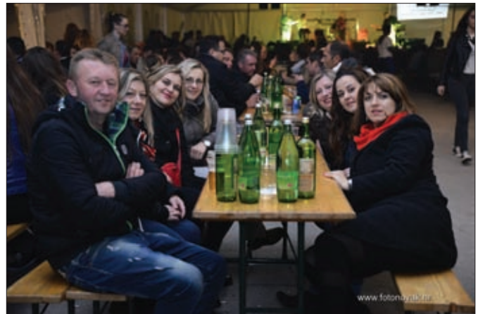
Djelatnice ljekarne u Svetom Đurđu