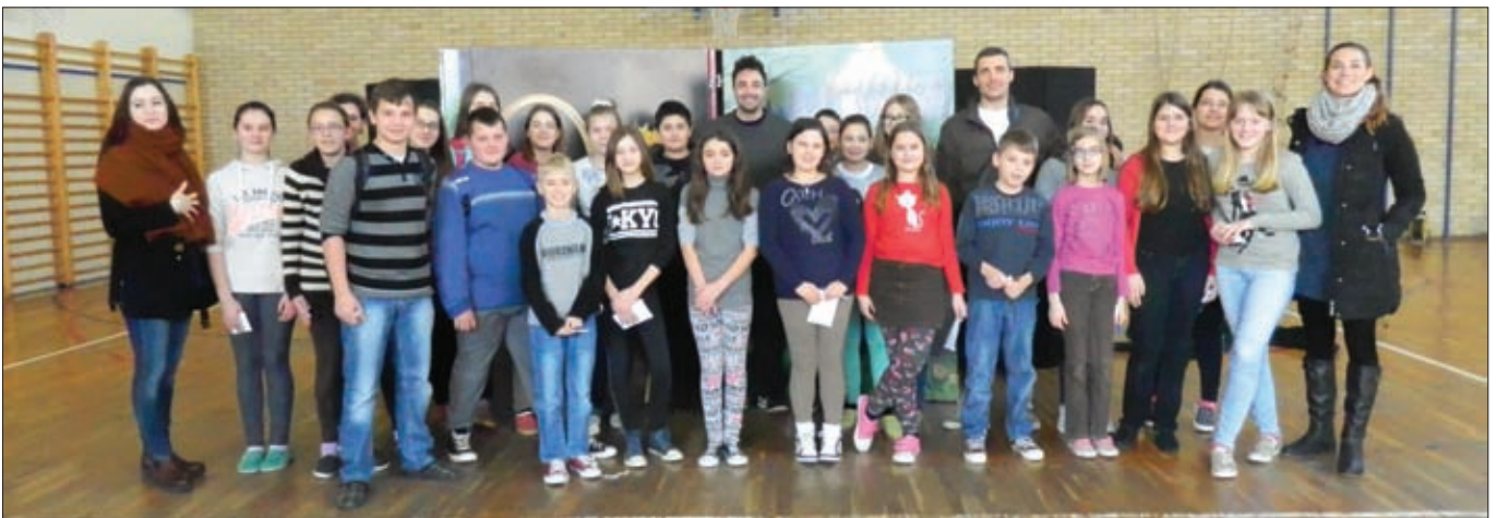
Grimmix Teatra Kerekesh