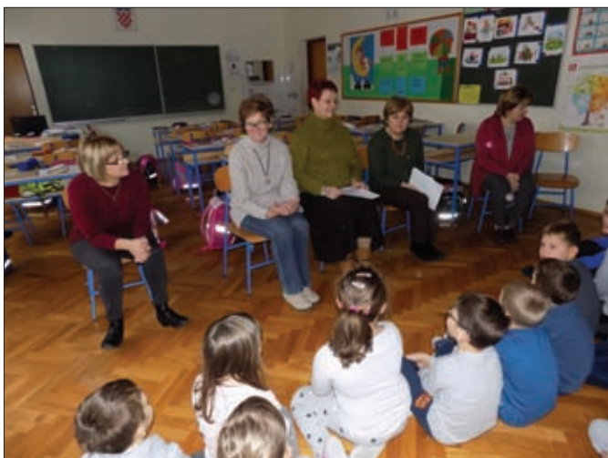
Podjela besplatnih članskih iskaznica prvačicama (dar ludbreške Gradske knjižnice)