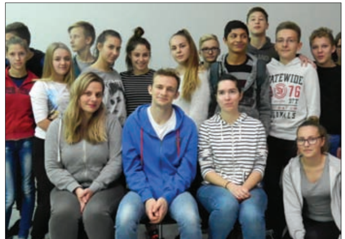
Predstava Teatra Tirene, Bijeg nije rješenje (problem ovisnosti o drogi)