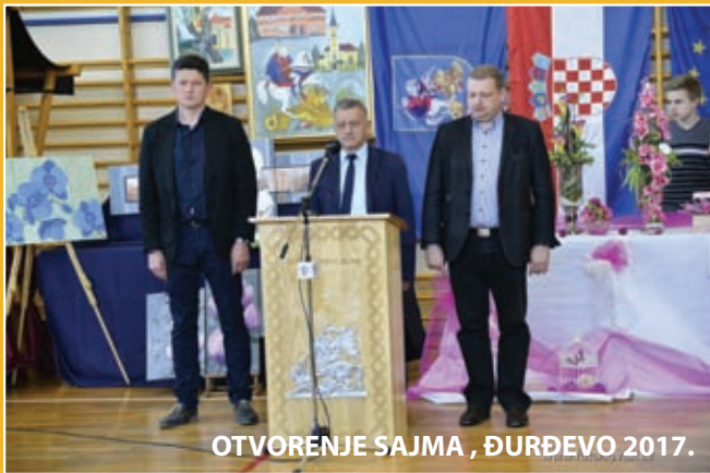
OTVORENJE SAJMA , ĐURĐEVO 2017.