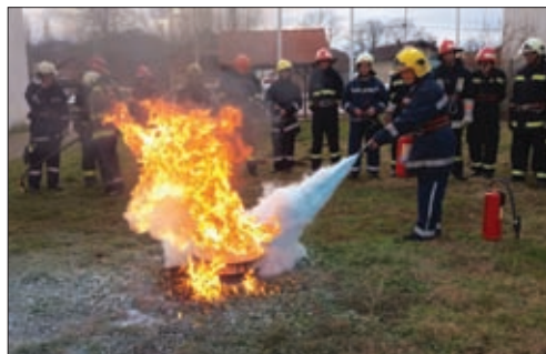
Novi vatrogasci osposobljeni su u Ludbregu