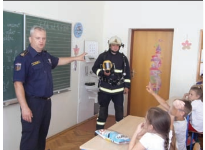
Posjet učenicima OŠ Sveti Đurđ i dječjeg vrtića svake je godine prilika za edukaciju mladih i promociju dobrovoljnog vatrogastva

Prošle je godine VZO Sveti Đurđ zajedno sa susjednim vatrogasnim zajednicama iz ludbreške regije suorganizirala