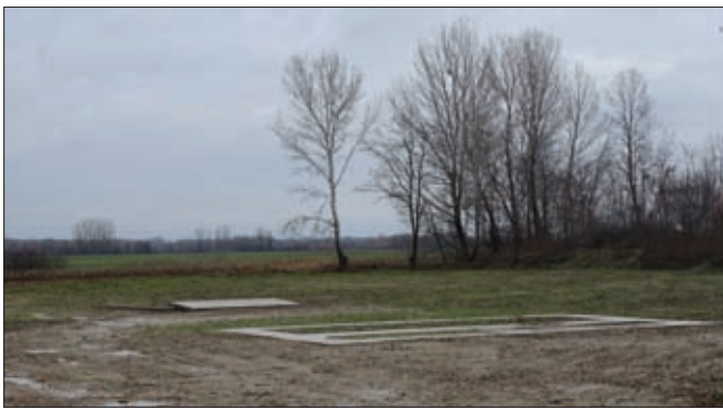
Nova izgrađena streljana

ureda Ludbreg i Varaždinske županije sudjelovalo u organizaciji proslave dana Svetog Huberta 04.11.2017. godine u Ludbregu na kojem se okupilo više od 1300 lovaca iz cijele Hrvatske.