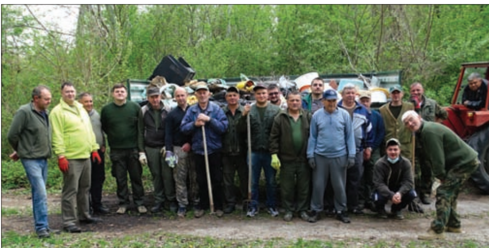
Čišćenje lovišta 2017.

Općine Sveti Đurđ kojom prilikom je prikupljena i na zakonit način zbrinuta znatna količina otpada. Organizirane su radne akcije skupljanja, spremanja hrane za divljač te hranjenja divljači u lovištu, popravka postojećih lovno – gospodarskih i lovno – tehničkih objekata i izrade novih.