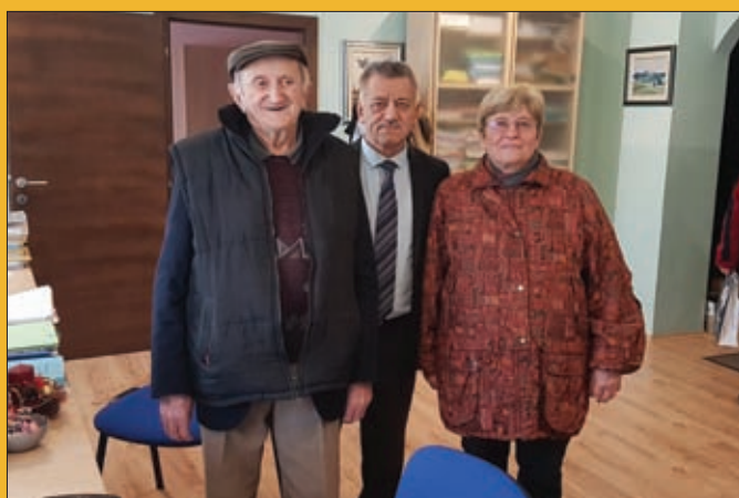
Dodjela poklon bonova umirovljenicima