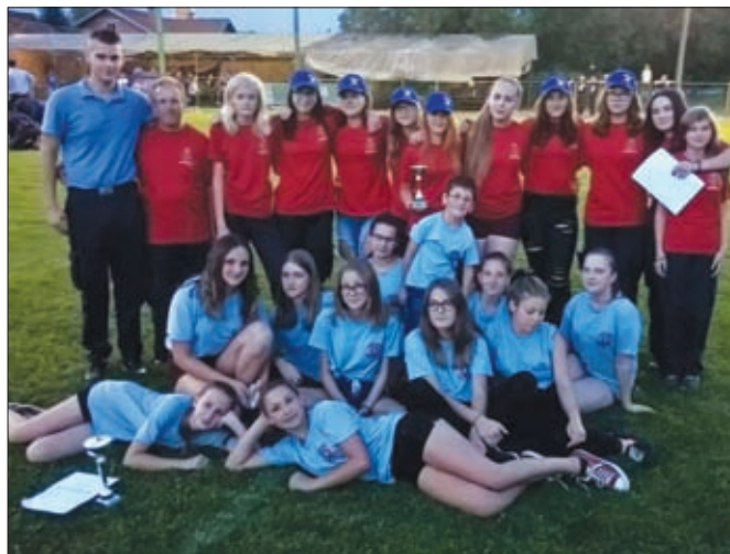
Mladež DVD-a Hrženica i DVD-a Karlovec Ludbreški nakon nastupa na Dravskom kupu u Svetom Đurđu