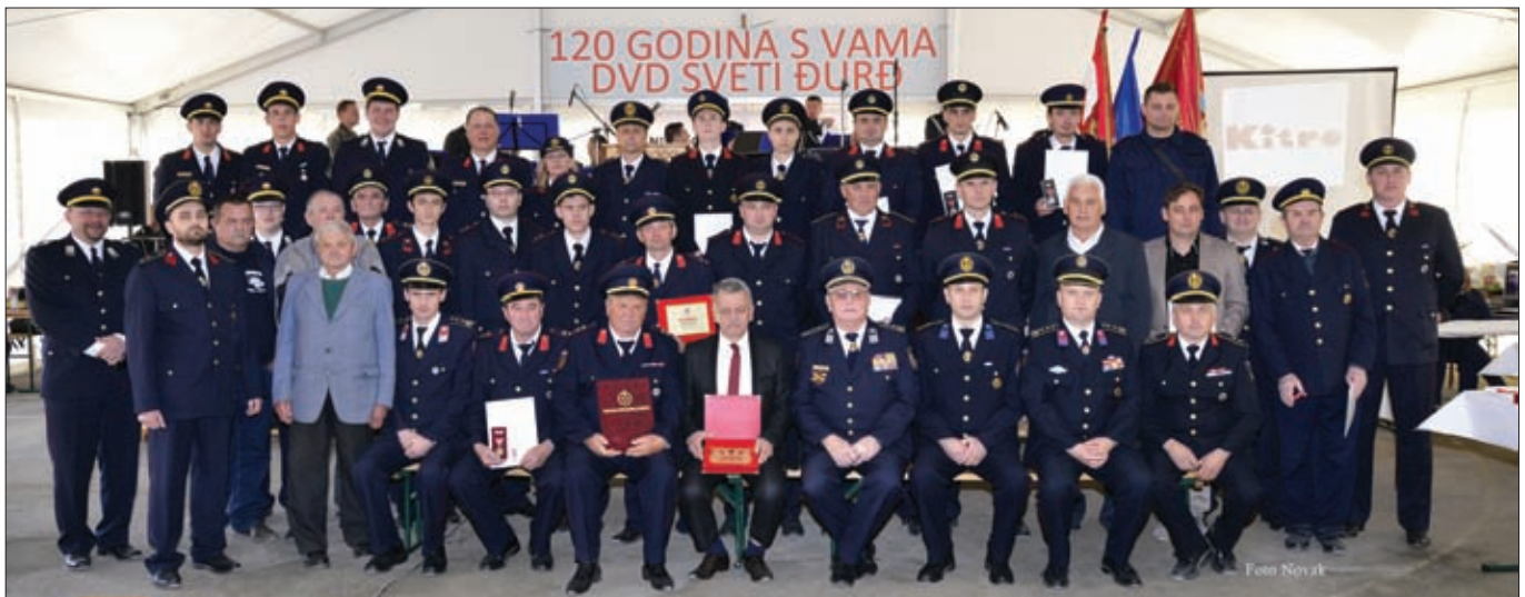
Dio članstva i gostiju DVD-a Sveti Đurđ na proslavi 120. rođendana Društva

Na području Općine Sveti Đurđ ove su godine održana već dobro poznata tradicionalna vatrogasna natjecanja u Svetom Đurđu, Hrženici i Komarnici Ludbreškoj, no valja pohvaliti i DVD Struga za organizirano natjecanje nakon 15-tak godina stanke u