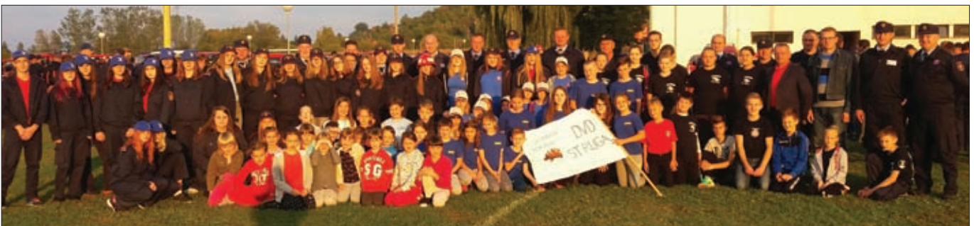
Mladež je snaga i ponos - reprezentacija Općine Sveti Đurđ na županijskom natjecanju u Lepoglavi

Tijekom godine nastavljene su aktivnosti na uređenju novog vatrogasnog doma središnjeg općinskog DVD-a Sveti Đurđ. U ovaj objekt uloženo je dosad oko milijun kuna, uglavnom iz općinskog