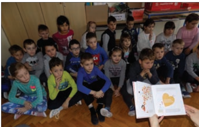
Podjela besplatnih članskih iskaznica prvačićima (dar ladbreške Gradske knjižnice)