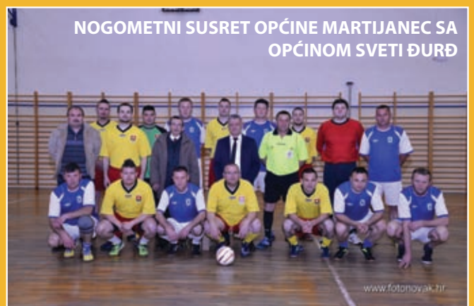
NOGOMETNI SUSRET OPĆINE MARTIJANEC SA OPĆINOM SVETI ĐURĐ