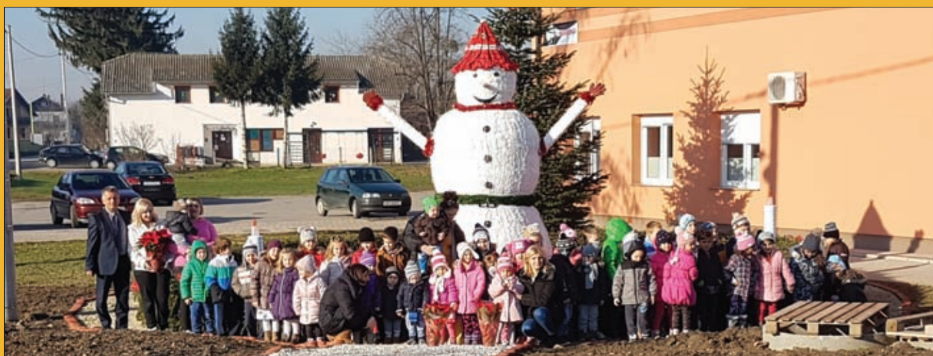
Dječji vrtić Lavić, zajednička slika sa načelnikom