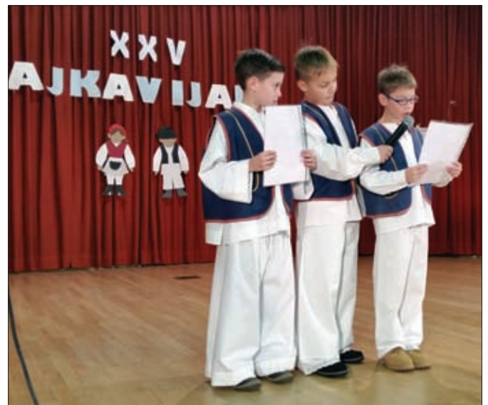
Kajkavijada u V. Toplicama

Autor: Filip Krušelj, 4.b Osnovna škola Sveti Đurđ Mentor: Dražen Vađunec