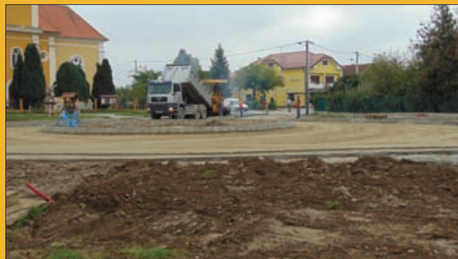
Izgradnja kružnog toka u središtu Sv. Đurđa