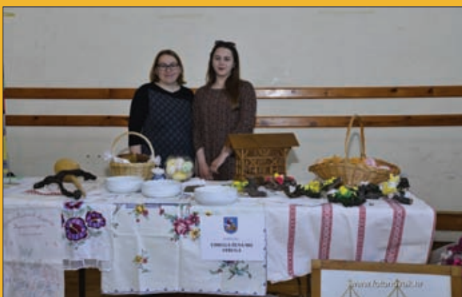
Udruga žena MO Struga