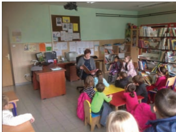
Lavići u knjižnici

• Obilježava važnije datume: Mjesec hrvatske knjige, Međunarodni dan nepismenosti, Dan školskih knjižnica, Međunarodni dan materinskog jezika, Međunarodni dan dječje knjige, Svjetski dan smijeha, Dan planeta Zemlje, Dan hrvatske knjige, Svjetski dan pisanja pisma, Mjesec borbe protiv ovisnosti, Međunarodni dan tolerancije, Svjetski dan sporta, Svjetski dan Roma, Međunarodni dan obitelji.