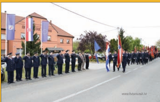
Susret vatrogasaca, Đurđevo 2017.