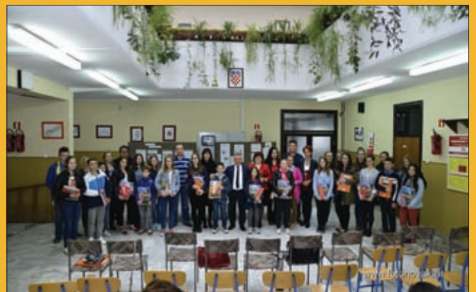
Nagrađeni učenici i mentori