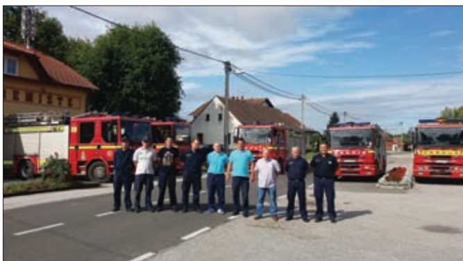
Susret vlasnika doniranih navalnih vozila iz ludbreške regije s britanskim prijateljima (Mali Bukovec)

šest lokacija u općini Sveti Đurđ. Najuspješnija je bila 2. ekipa DVD-a Hrženica, ispred DVD-a Karlovec Ludbreški i 1. ekipe DVD-a Hrženica. Iza njih plasirali su se DVD Sveti Đurđ, DVD Struga, DVD Sesvete Ludbreške i DVD Komarnica Ludbreška.