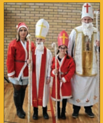
Nikolinje, Osnovna škola Sveti Đurđ