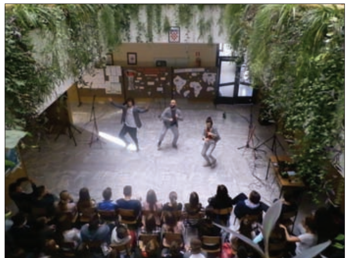
D(n)o dna u izvedbi Teatra Tirene (ovisnost o alkoholu)