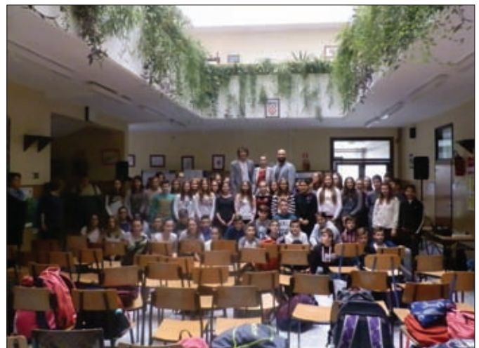
D(on)o dna u izvedbi teatra Tirene (ovisnost o alkoholu)

• Knjižničarka škole organizira i vodi rad u knjižnici, priprema i planira odgojno-obrazovni rad; radi godišnji plan knjižnice i plan kulturnih aktivnosti knjižnice; surađuje s aktivima razredne i predmetne nastave.