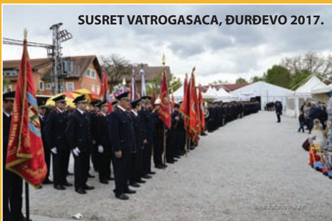
SUSRET VATROGASACA, ĐURĐEVO 2017.