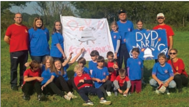
Brončana ekipa ženskog podmlatka DVD-a Komarnica Ludbreška na županijskom natjecanju u Lepoglavi

Ovaj novi oblik uvježbavanja oduševio je sve sudionike, zbog čega je odmah najavljeno pretvaranje ovog natjecanja u međunarodnu manifestaciju otvorenog karaktera već sljedeće godine. DVD Hrženica ovim je događanjem ujedno obilježio 145. obljetnica rada ovog najstarijeg seoskog DVD-a u jugoistočnoj Europi.