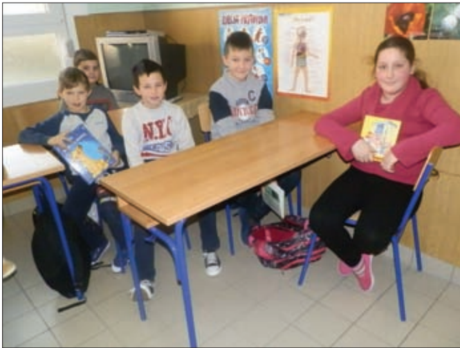
Natjecanje u čitanju naglas

Deda se žuri, po štengama leti. Čim nahroni krave na traktor si sedne i po silažu otide. Dok se s polja vrne niti jesti prav ne dospe. Malo si na brzinu špeka z nožem odreže ili mošču na kruh namože. „Još moram