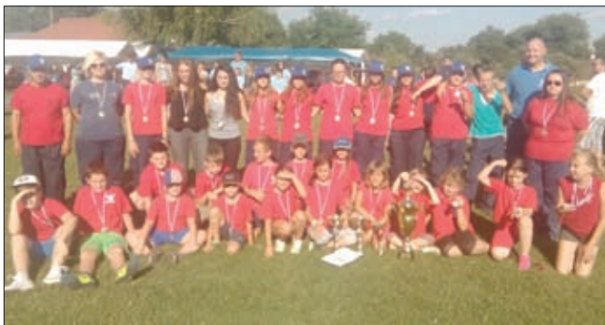
Mladež i podmladak DVD-a Hrženica

Početkom mjeseca rujna naše su vatrogasce ponovno posjetili prijatelji iz Velike Britanije, prilikom čega je održano okupljanje