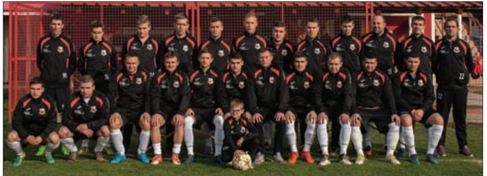
Seniorsi u novoj opremi

2 remija i 2 poraza iz 14 utakmica odnosno tri boda manje od vodeće Mladosti iz Sigeca i po bodom viška ispred Bukovčana iz Velikog Bukovca odnosno Razvitka iz Čičkovine.