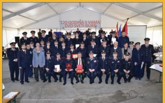
Zajednička sa vatrogascima