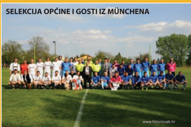
SELEKCIJA OPĆINE I GOSTI IZ MÜNCHENA