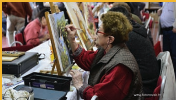
Likovna kolonija, Đurđevo 2017.