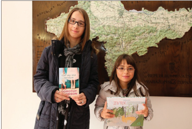
Najčitači u 2017.