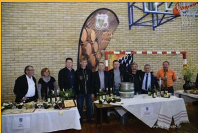
Udruga vinara i vinogrdara Trsek i Grozdek