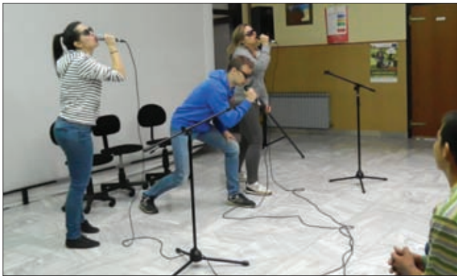
Predstava Teatra Tirene, Bijeg nije rješenje (problem ovisnosti o drogi)