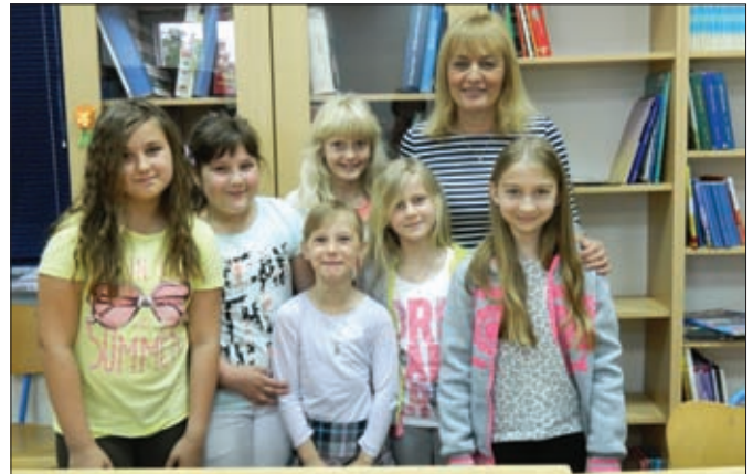
Međuškolski susret u čitanju priča OŠ Veliki Bukovec - učenice sa književnicom Sanjom Pilić

(8. razredi), uz stvaranje navike i potrebe korištenja istih.