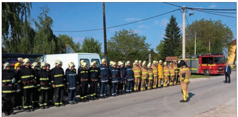
Pokazna vježba Đurđevo 2017