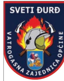
Amblem VZO Sveti Đurđ

Broj provedenih intervencija, kao osnovnog oblika djelatnosti vatrogastva, u odnosu na prethodnu 2016. godinu (zabilježeno samo 5 intervencija), ove je godine gotovo udvostručen, no ipak je svih 6 DVD-ova s područja općine do početka mjeseca prosinca imalo znatno manje od višegodišnjeg prosjeka, a koji iznosi 14 intervencija godišnje. Među intervencijama je bilo i nekoliko složenih događaja, no nabrojimo sve intervencije redom kako su se događale: