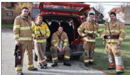
Operativci DVD-a Struga najuspješnije su izveli poseban zadatak iznenađenja na prvom operativnom natjecanju VZO Sveti Đurđ.