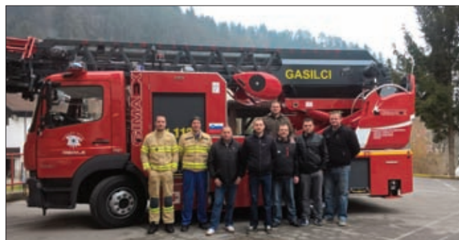
DVD Karlovec Ludbreški gaji uspješnu suradnju s domaćim i stranim vatrogasnim društvima - posjet PGD-u Dobovec u GZ Trbovlje