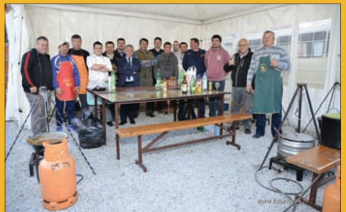
Natjecanje u kotlićima