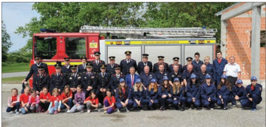
Dio članstva DVD-a Hrženica s gostima na Florijanovo 2018

Na području sjeverozapadne Hrvatske jedno od glavnih događanja vezanih uz obilježavanje Međunarodnog dana vatrogasstva odnosno blagdana svetog Florijana, zaštitnika vatrogasaca, bio je dolazak dva navalna vatrogasna vozila, po jedno za DVD Hrženicu i DVD Legrad, ali i velike količine različite