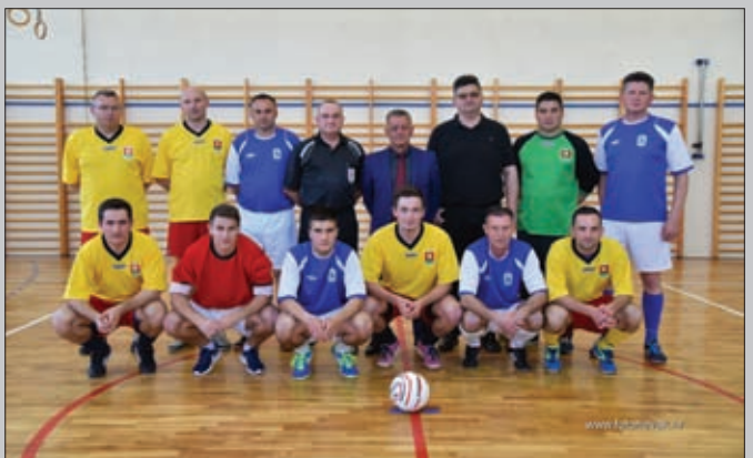
Nogometni susret Općine Martijanec sa Općinom Sveti Đurđ