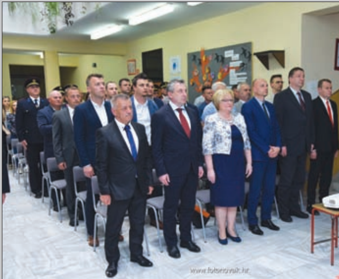
Svečana sjednica - Đurđevo 2018