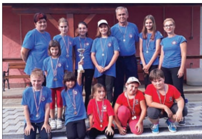
Ženski podmladak DVD-a Komarnica Ludbreški već je dulje vrijeme nepobjediv na području ludbreške regije