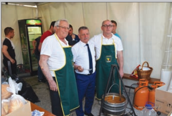
Đurđevo - kuhanje gulaša