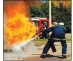
Gašenje požara pjenom i prahom prikazano je u okviru obilježavanja „Đurđeva“