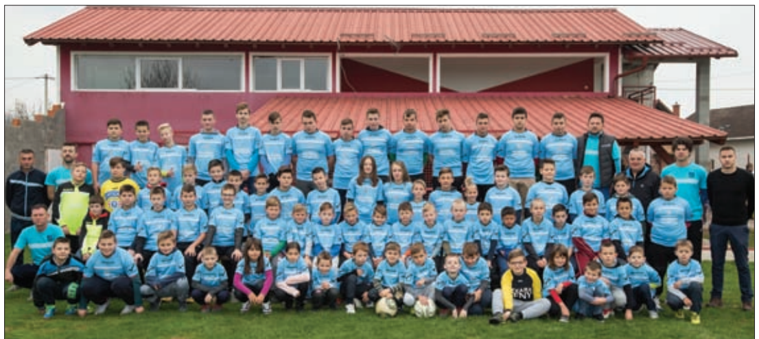
Nogometni centar Općine Sveti Đurđ