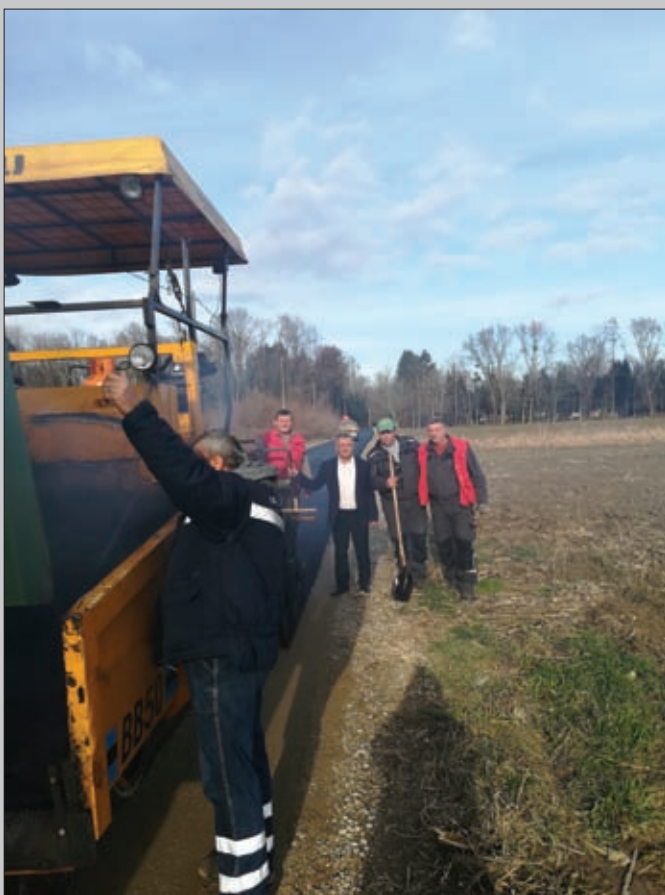
Asfaltiranje ceste Hrženica - Drava