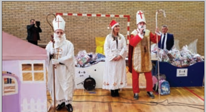
Nikolinje, Osnovna škola Sveti Đurđ