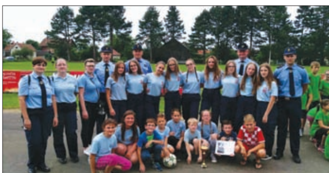
Ženska mladež i muški podmladak DVD-a Karlovec Ludbreški