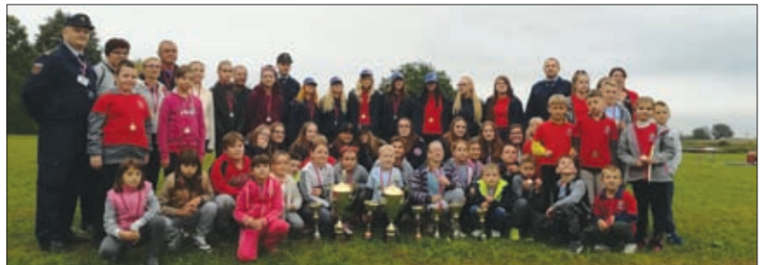
Dio najmlađih predstavnika Općine Sveti Đurđ na regionalnom natjecanju u Ludbregu

U ženskoj seniorskoj "A" kategoriji prvo su mjesto osvojile članice DVD-a Ludbreg. U najjačoj muškoj seniorskoj "A" kategoriji prvo je mjesto osvojilo odjeljenje DVD-a Ludbreg, ispred DVD-a Hrženica i DVD-a Selnik, a odmah do njih plasirali su se DVD Struga i DVD Karlovec Ludbreški. U muškoj seniorskoj "B" kategoriji regionalni su prvaci članovi DVD-a Hrženica.