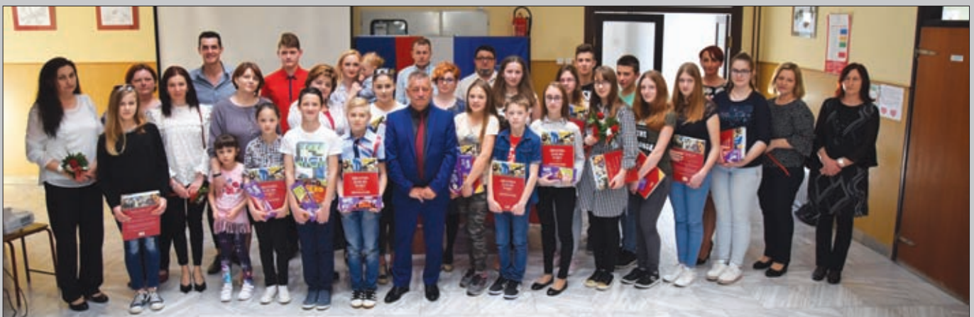
Nagrađeni učenici i mentori