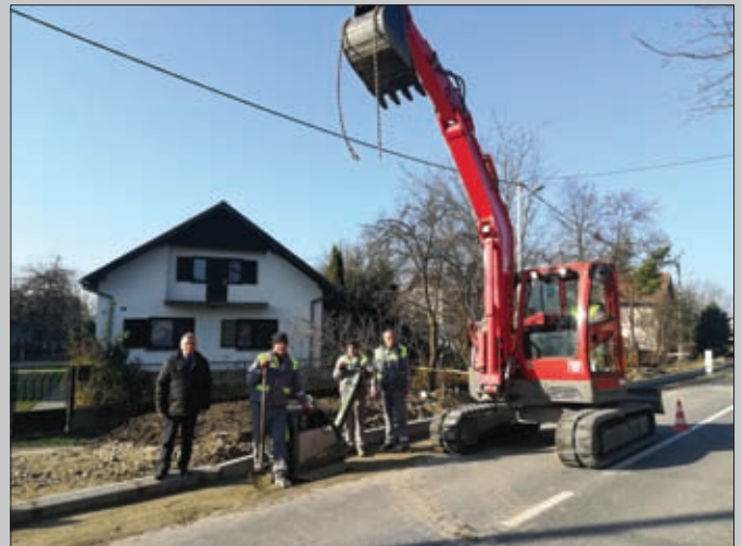
Gradnja pješačke staze - Sveti Đurđ