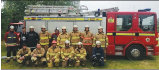
DVD Hrženica najaktivniji je u području interne obuke operativaca