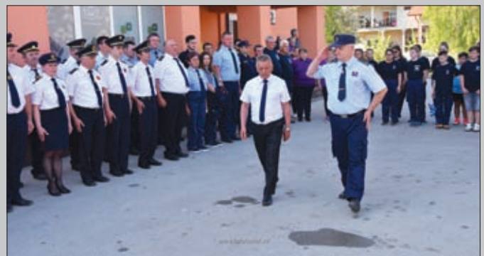
Vatrogasna vježba – Đurđevo 2018.