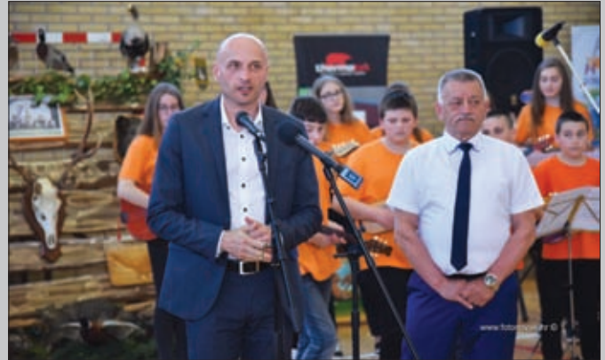
Otvorenje sajma, Đurđevo 2018.