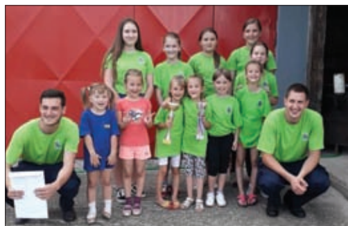
Mališani DVD-a Struga

Na području Općine Sveti Đurđ ove su godine održana već poznata tradicionalna vatrogasna natjecanja u Svetom Đurđu, Hrženici, Komarnici Ludbreškoj i Strugi,