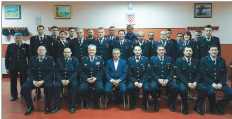
Članovi Skupštine VZO Sveti Đurđ 2018. godine

Svaka 6-člana ekipa izvela je 7 taktičkih zadataka, odnosno po 1 zadatak na 7 lokacija u različitim mjestima na području općine Sveti Đurđ, uz pozorno bilježenje ocjene zadaća od