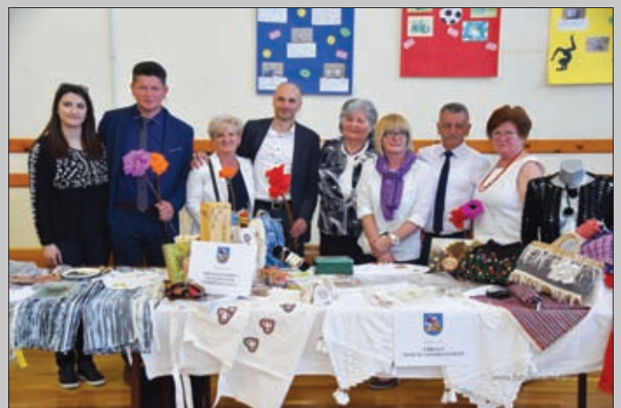
Udruga žene iz centra svijeta