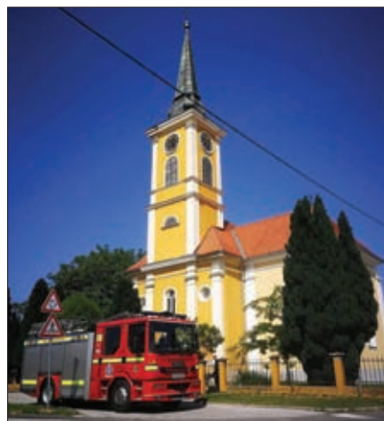
Vatrogastvo je prvi stup obrane Općine Sveti Đurđ kod svih oblika prirodnih i tehnoloških nesreća

Predsjedništvo i Zapovjedništvo VZO Sveti Đurđ