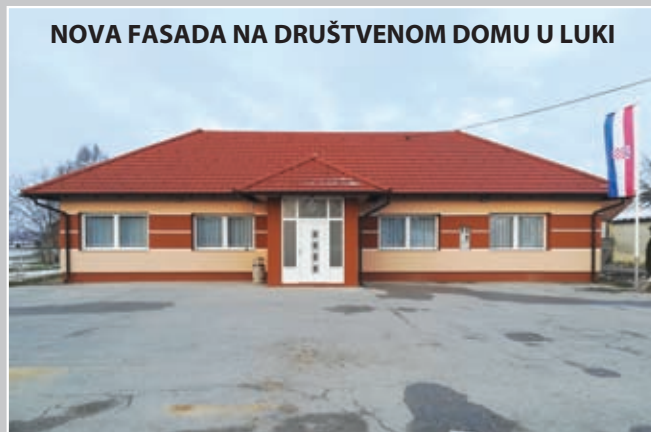
NOVA FASADA NA DRUŠTVENOM DOMU U LUKI