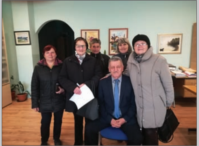
Dodjela poklon bonova umirovljenicima