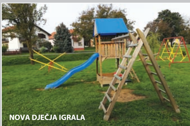
NOVA DJEČJA IGRALA