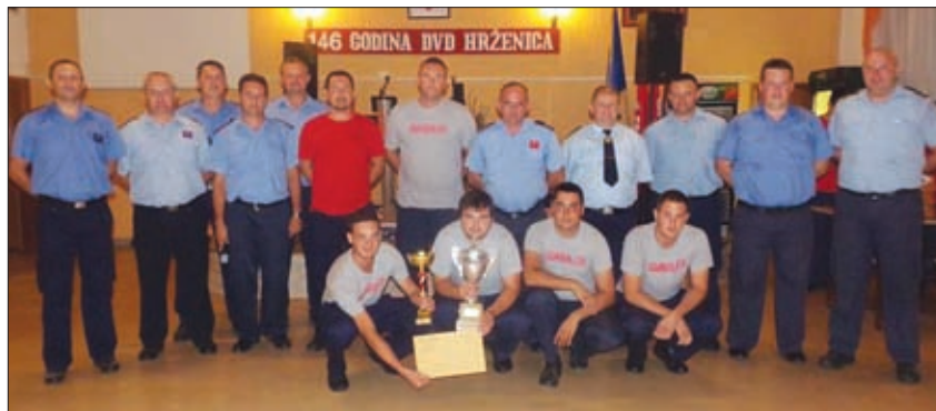
Zasluženi pehar za DVD Struga