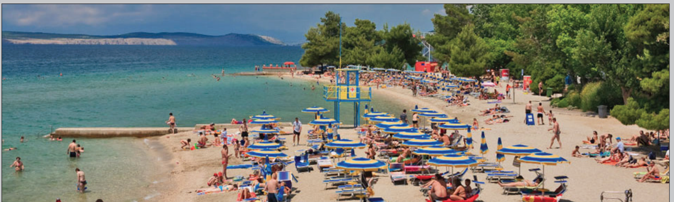
Ivo Express ovog je ljeta mještane Općine Sveti Đurđ vozio na jednodnevno kupanje na Jadransko more