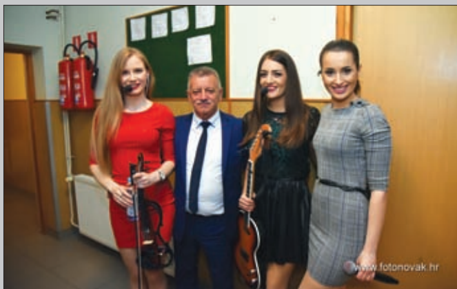
Đurđevo - Učiteljice