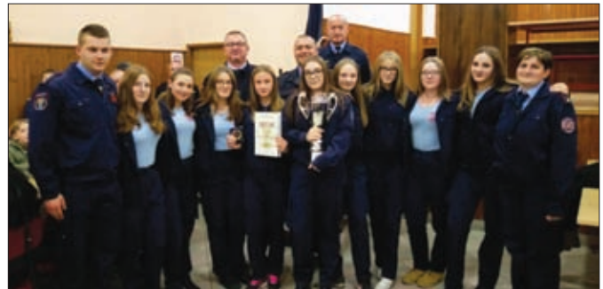
Pobednice prvog županijskog kupa - mladež ženska DVD-a Karlovec Ludbreški

Odjeljenje ženske mladeži DVD-a Karlovec Ludbreški pobijedilo je u premijernom izdanju Kupa Vatrogasne zajednice Varaždinske županije za mladež, potvrdivši svoju premoć u ovoj kategoriji koja je bila jasna kroz cijelu sezonu. U tom je natjecanju nastupilo i odjeljenje muške mladeži DVD-a Hrženica, osvojivši odlično četvrto mjesto.