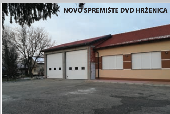
NOVO SPREMIŠTE DVD HRŽENICA