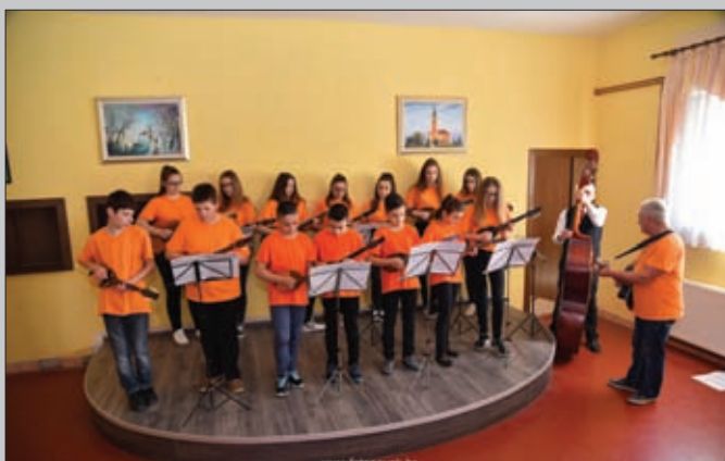
KUD Juraj Lončarić