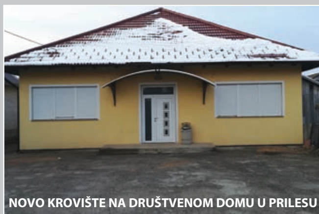
NOVO KROVIŠTE NA DRUŠTVENOM DOMU U PRILESU