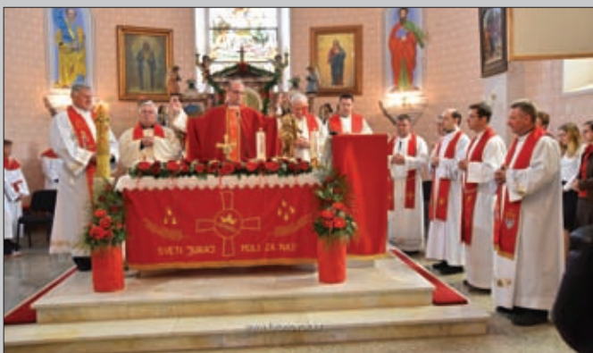
Sвета миса, Đurđevo 2018.