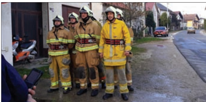
Operativci DVD-a Komarnica Ludbreška i DVD-a Sveti Đurđ na operativnom natjecanju

Uz nabavu i održavanje opreme, neizostavni prioritet u vatrogasnoj struci konstantna je edukacija vatrogasnih kadrova. Članovi naših Društava tijekom ove godine sudjelovali u programima provođenim od strane Vatrogasne zajednice Varaždinske županije.