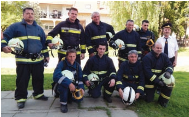
Operativci DVD-a Sveti Đurđ

strane vatrogasnih sudaca. Nakon nekoliko sati napornoga rada najuspješnija je bila ekipa domaćina, odnosno DVD-a Karlovec Ludbreški, ispred DVD-a Hrženica i DVD Sveti Đurđ. Nešto slabiji rezultat imali su DVD Ludbreg, DVD Komarnica Ludbreška, DVD Struga, DVD Veliki Bukovec, DVD Imbriovec i DVD Sesvete Ludbreške. Iz zadataka valja izdvojiti vježbu u kojoj su korištena 2 čamca za spašavanje, dok je tzv. „zadatak iznenađenja“ bio vezan uz scenarij sa simuliranim prevrtanjem cisterne s benzinom, pri čemu je trebalo primijeniti cijeli niz sigurnosnih mjera i radnji.