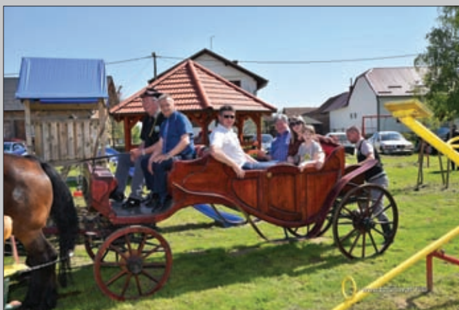
Đurđevo - vožnja kočijom