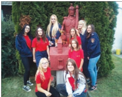
Pripadnice ženske mladeži DVD-a Hrženica između ostalog pobijedile su i na natjecanju u Zbelavi