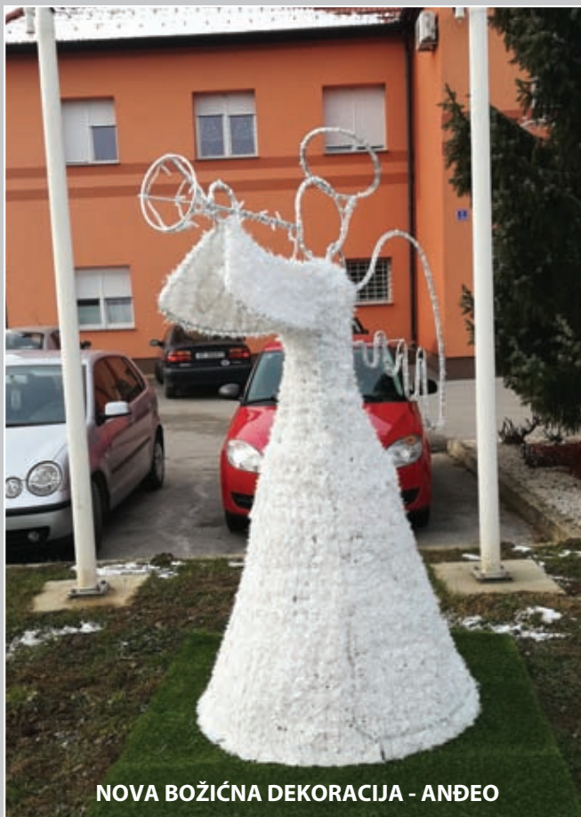
NOVA BOŽIĆNA DEKORACIJA - ANĐEO