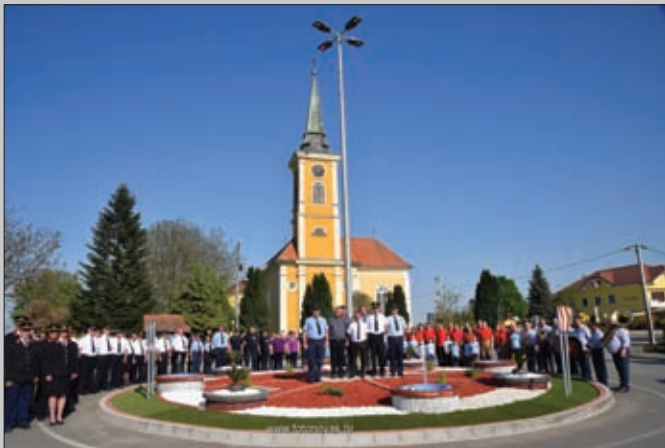
Otvaranje kružnog toka