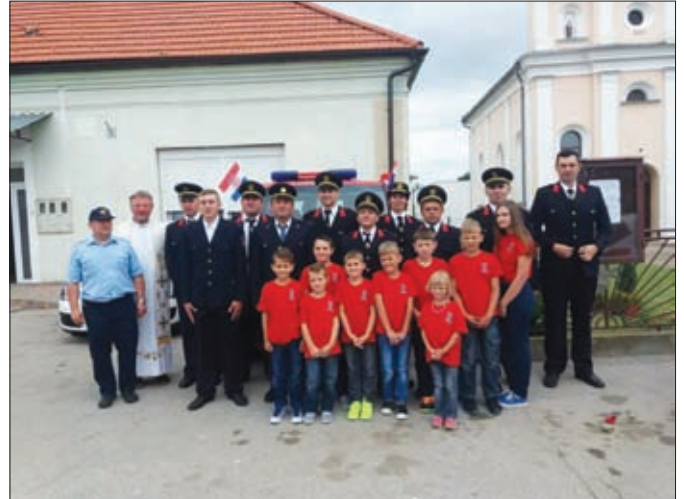
Dio članstva DVD-a Sesevete Ludbreške

Kad se spominju tradicionalne odnosno vjerske manifestacije recimo kako su članovi DVD-ova sudjelovali u Tijelovu, zatim u hodočašću vatrogasaca ludbreške regije u Svetište Predragocjene Krvi Kristove u Ludbreg, a tradicionalno su držali stražu kod Božjeg groba na Veliku subotu u župnoj crkvi u Svetom Đurđu.