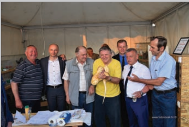
Udruga ljubitelja životinja