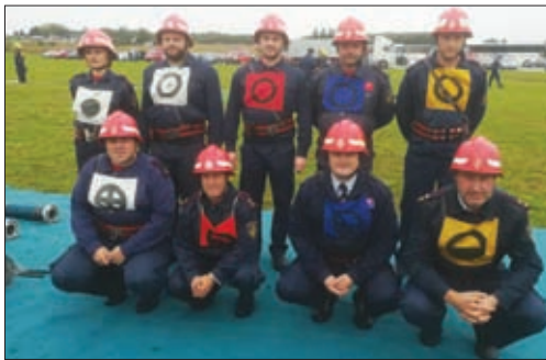
Regionalni prvaci - DVD Hrženica - Muški B