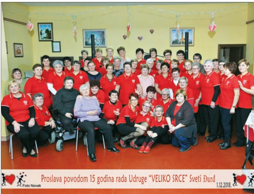
Proslava povodom 15 godina rada Udruge "VELIKO SRCE" Sveti Đurđ