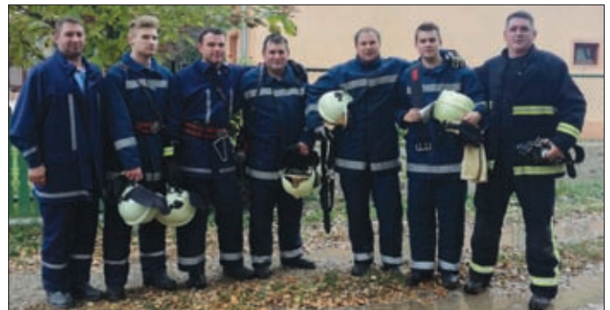
Pobjednici prvog Dravskog zmaja - DVD Karlovec Ludbreški