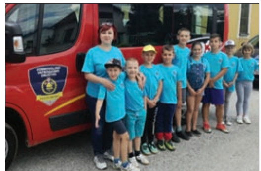
Mališani DVD-a Sveti Đurđ

Valja spomenuti kako je „Kup DVD-a Hrženica 2018“ imao karakter finalnog natjecanja u spomenutom kup natjecanju županijske vatrogasne zajednice.