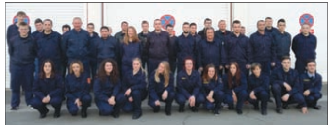
Svake godine nova generacija vatrogasaca - 150-godišnja tradicija se uspješno nastavlja

U Varaždinu je sredinom godine završen program osposobljavanja za zvanje „vatrogasac 1. klase“, kojeg su završili