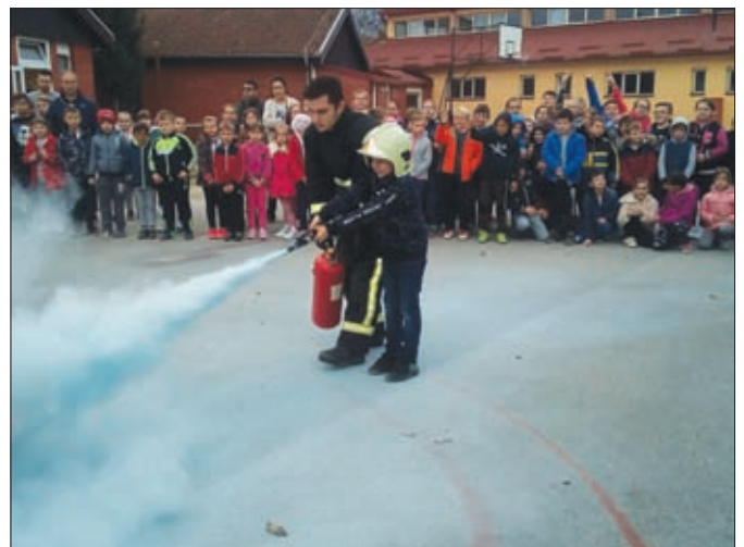
Posjet osnovnoškolcima i mališanima iz vrtića uvijek je prepun radosti i adrenalina

Za kvalitetne rezultate u smislu promicanja protupožarne preventive najvažniji je rad s mladima, s obzirom da je poznato kako njihova sklonost istraživanju novog i nepoznatog često biva uzrokom požara. Istovremeno, rad s mladima izuzetno je važan glede promidžbe dobrovoljnog vatrogastva te novačenja novih članova. Stoga valja istaknuti ovogodišnji posjet vatrogasaca učenicima Osnovne škole Sveti Đurđ i polaznicima Dječjeg vrtića Lavić. Vrlo zainteresiranim mališanima sve najosnovnije o zaštiti od požara i vatrogastvu predstavilo je 10-tak članova DVD-a Sveti Đurđ i DVD-a Hrženica. Najviše interesa svakako je pobudilo isprobavanje vatrogasne opreme, kao i prigodno natjecanje u rušenju meta s pravim vatrogasnim mlazom.