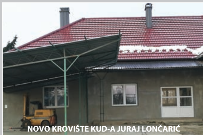
NOVO KROVIŠTE KUD-A JURAJ LONČARIĆ