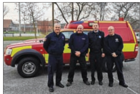
Vozni park DVD-ova s područja Općine Sveti Đurđ 2018. godine obnovljen je s rekordnih 5 vozila