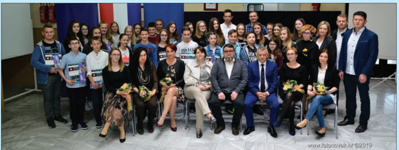
Nagrađeni učenici i mentori