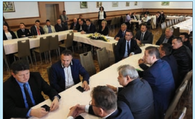
Potpisivanje ugovora s Ministarstvom graditeljstva i prostornog uređenja