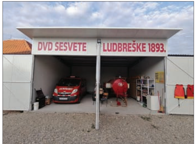
Novo vatrogasno spremište DVD-a Sesvete Ludbreške uređeno je sredinom godine

Tijekom godine dodatno je uređeno vatrogasno spremište DVD-a Sesvete Ludbreške, uključujući novo asfaltirano parkiralište. Tu je potrebno dodati i asfaltiranje prilaznog puta prema vatrogasnom spremištu DVD-a Komarnica Ludbreška, kao i uređenje sanitarnog čvora istog. Krajem godine započeti su radovi na izgradnji novog vatrogasnog spremišta s dvije garaže za DVD Karlovec Ludbreški.