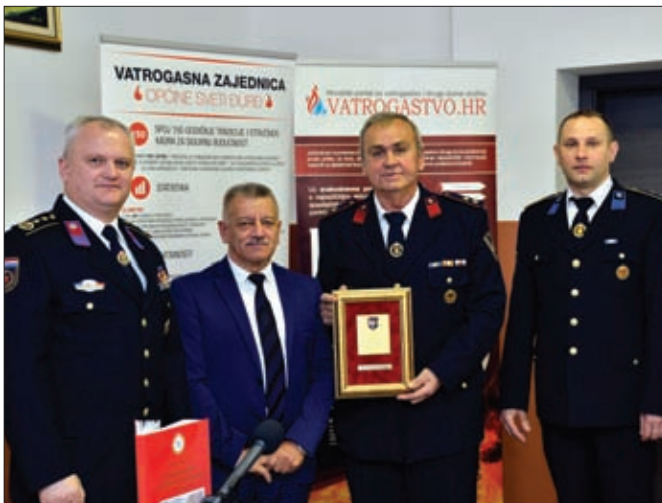
U Komarnici Ludbreškoj održana je svečana sjednica Skupštine VZO Sveti Đurđ

Spomenimo i kako je VZO Sveti Đurđ u okviru obilježavanja „Đurđeva“ organizirala svoju svečanu sjednicu Skupštine, na kojoj je promoviran informativno-promidžbeni letak Zajednice. Upriličen je pritom osvrta na 25 godina uspješnog rada VZO Sveti Đurđ, a zaslužnim organizacijama i pojedincima uručena su prigodna priznanja i odlikovanja.