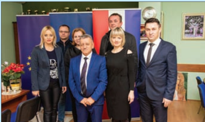
Potpisivanje ugovora s izvođačima radova za dječji vrtić