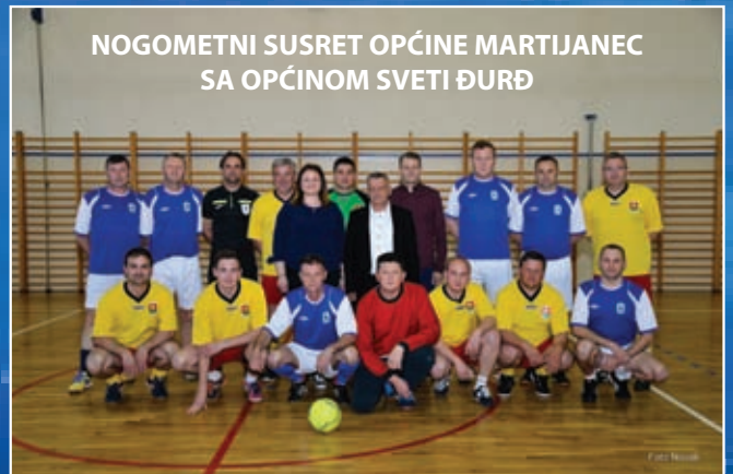
NOGOMETNI SUSRET OPĆINE MARTIJANEC SA OPĆINOM SVETI ĐURĐ