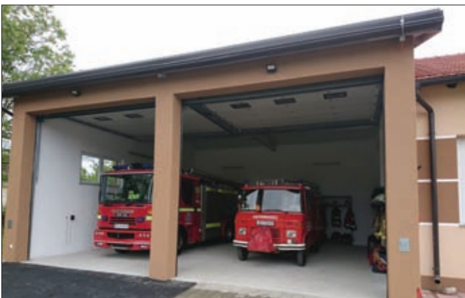
Nove garaže za DVD Hrženica svečano su otvorene na Florijanovo

Tijekom godine nastavljene su aktivnosti na poboljšanju materijalno-tehničkih uvjeta za rad svih 6 DVD-ova na području općine. Zbog akvizicije novijeg navalnog vozila marke „Dennis Sabre“ iz Velike Britanije 2018. godine, sredinom ove godine Općina Sveti Đurđ je dovršila izgradnju dvije nove velike garaže za DVD Hrženica, smještene sa zapadne strane postojećeg društvenog doma, a kako bi sva operativna oprema Društva bila spremljena na odgovarajući način na jednom mjestu. Time je operativna spremnost DVD-a Hrženica doista na zavidnoj razini.