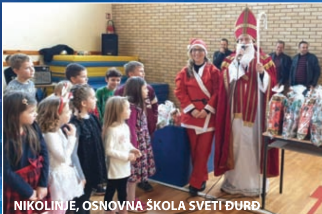
NIKOLINJE, OSNOVNA ŠKOLA SVETI ĐURĐ