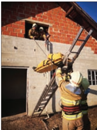
Jedno od najboljih odjeljenja na operativnom natjecanju Dravski zmaj bilo je iz DVD-a Struga

primila su zaslužene pehare i nagrade u obliku vatrogasne opreme.