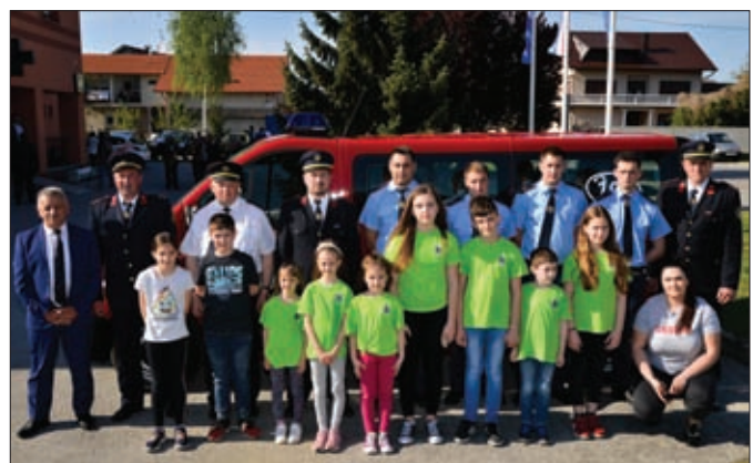
Pred svojim novim kombi vozilom - DVD Struga