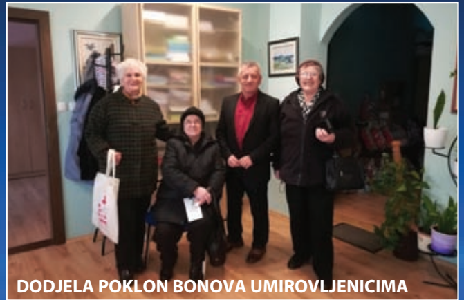
DODJELA POKLON BONOVA UMIROVLJENICIMA