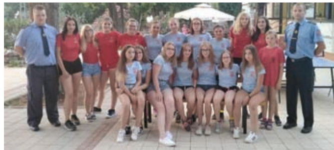
Vatrogasna mladež DVD-a Hrženica i DVD-a Karlovec Ludbreški ponovo su boravili u Kampu Hrvatske vatrogasne zajednice u Fažani kod Pule

Među ostalim uspjesima s natjecanja diljem Lijepa Naše valja istaknuti 3. mjesto ženske mladeži DVD-a Karlovec Ludbreški na Susretu vatrogasne mladeži Republike Hrvatske i Republike Slovenije, održanom sredine godine u Čakovcu. Isto je odjeljenje zajedno s vršnjacima iz DVD-a Hrženica boravilo i u Kampu vatrogasne mladeži Hrvatske vatrogasne zajednice u Fažani.