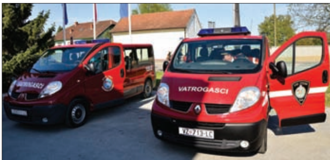
Nova kombi vozila primili su DVD Komarnica Ludbreška i DVD Struga

Pri samom kraju godine dodatnim sredstvima iz općinskog proračuna nabavljena je oprema za svih 6 DVD-ova u ukupnoj vrijednosti od 60-ak tisuća kuna, pri čemu je naglasak stavljen na osobnu zaštitnu opremu.