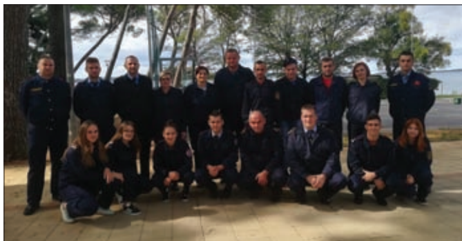
Voditelji mladeži iz VZO Sveti Đurđ na seminaru u Fažani