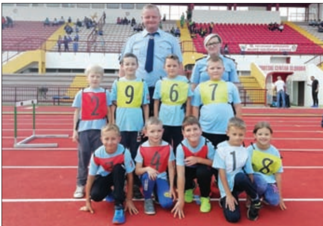
Najmlađi vatrogasci iz Karlovca Ludbreškog sa svojim voditeljima

Među najmlađima, odnosno u najmasovnijoj kategoriji na natjecanju gdje su se natjecala djeca u dobi od 6 do 12 godina, muško odjeljenje DVD-a Komarnica Ludbreška osvojilo je odlično 3. mjesto, DVD Struga osvojilo je 5. mjesto, DVD Sesvete Ludbreške osvojilo je 14. mjesto, 26. mjesto osvojio je DVD Karlovec Ludbreški, 42. mjesto DVD Sveti Đurđ, a 48. mjesto DVD Hrženica.