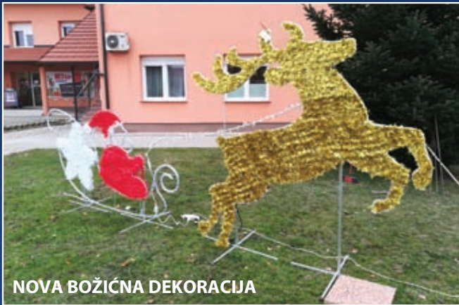
NOVA BOŽIČNA DEKORACIJA