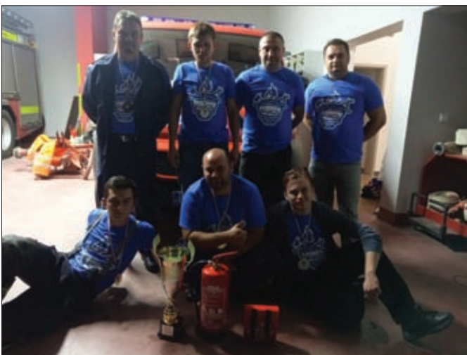
Operativci DVD-a Sveti Đurđ sudjelovali su na niz operativnih natjecanja