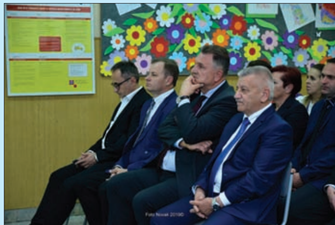
Svečana sjednica - Đurđevo 2019