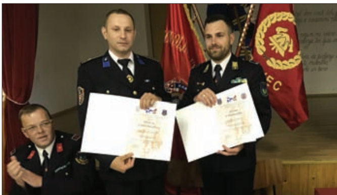
DVD Karlovec Ludbreški pobratimljen je s PGD-om Dobovec iz Slovenije