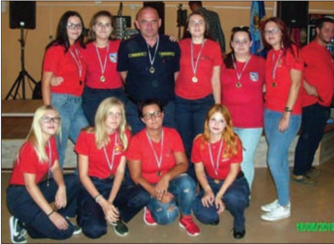
Novo žensko seniorsko odjeljenje DVD-a Hrženica