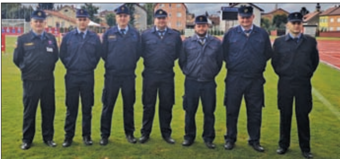
VZO Sveti Đurđ u samom je županijskom vrhu po broju i ulogama vlastitih vatrogasnih sudaca u natjecanjima najviše razine