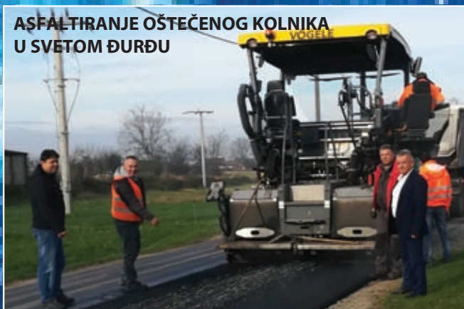
AŠFALTIRANJE OŠTEČENOG KOLNIKA U SVETOM ĐURĐU