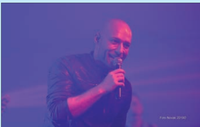
Đurđevo - grupa Vigor