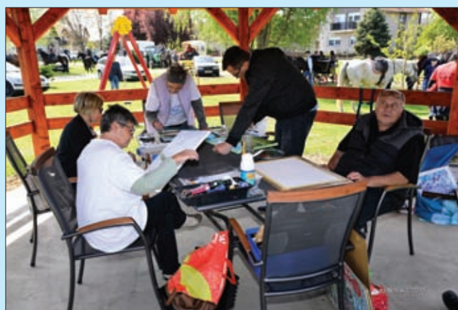
Likovna kolonija - Đurđevo 2019