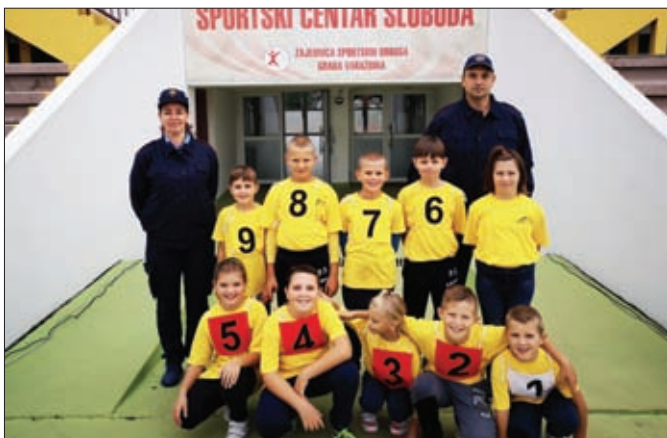
Mališani DVD-a Sesvete Ludbreške pred nastup na županijskom natjecanju u Varaždinu

Među seniorima u najjačoj „A“ kategoriji članovi DVD-a Hrženica zauzeli su 4. mjesto, ostavši bez plasmana na državno natjecanje za 23 stotinke sekunde. Članovi DVD-a Karlovec Ludbreški u istoj su kategoriji osvojili 21. mjesto.