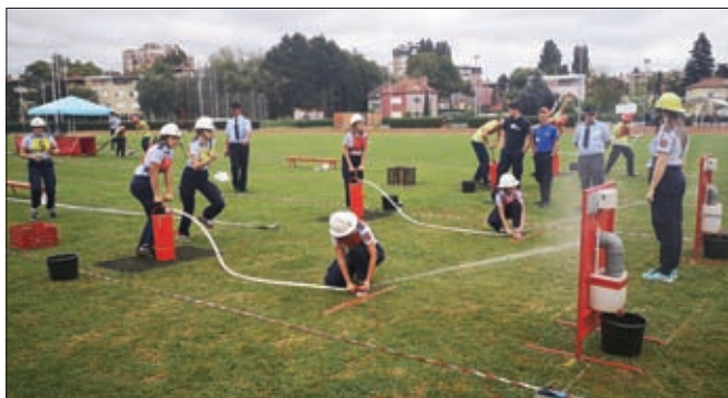
Nastup ženske mladeži DVD-a Karlovec Ludbreški vrijedan nastupa na Državnom natjecanju 2020. godine

Na županijskim vatrogasnim natjecanjima održanim u rujnu na stadionu Sloboda u Varaždinu, među oko 2000 sudionika, okupilo se 100-njak članova naših DVD-ova, čineći Općinu Sveti