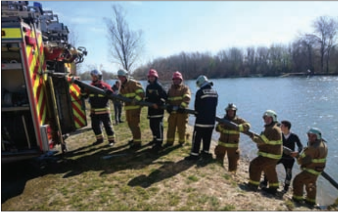
Obuka operativne postrojbe DVD-a Hrženica na Dravi imala je mnogo znatizeljnih promatrača