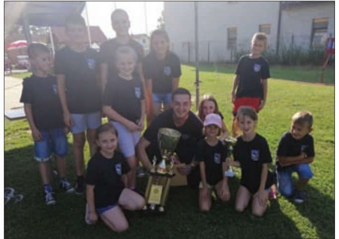
Pehar u okviru Kupa Grada Ludbrega zaslužen su osvojili mališani DVD-a Struga