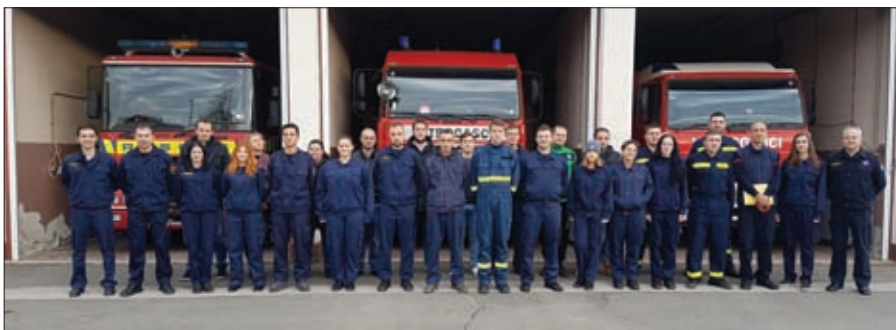
Ludbreška regija svake je godine bogatija za 30-tak novih operativnih vatrogasaca, među kojima su vrlo snažno zastupljeni predstavnici VZO Sveti Đurđ

Uz nabavu i održavanje opreme, neizostavni prioritet u vatrogasnoj struci konstantna je edukacija vatrogasnih kadrova. Članovi naših Društava tijekom ove godine sudjelovali u programima provođenim od strane Vatrogasne zajednice Varaždinske županije.