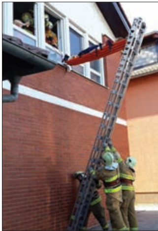
Detalj s vježbe „Potres 2019.“ u Svetom Đurđu - DVD Hrženica spašava nesrećene s visine

Pretpostavka vježbe sadržavala je reakciju svih elemenata općinskog sustava civilne zaštite na potres, odnosno spašavanja ugroženih i nesrećenih osoba iz objekata pogođenim učincima potresa te posljedične požare na nekoliko objekata u središnjem dijelu naselja. Ova vježba izvedena je u skladu s važećim Planom civilne zaštite Općine Sveti Đurđ iz 2015. godine.