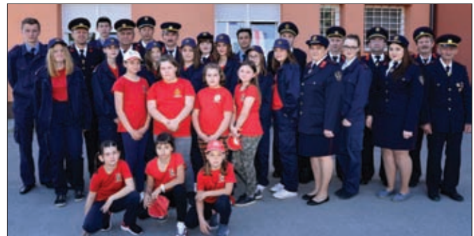
Članstvo DVD-a Komarnica Ludbreška pred primopredaju svog novog kombi vozila

Nastavak projekta modernizacije voznog parka uz pomoć dodatnih sredstava Općine Sveti Đurđ nastavljen je i ove godine nabavom novijih kombi vozila uoči obilježavanja Đurđeva, odnosno Dana općine. Naime, zajedničkim sufinanciranjem od strane Općine Sveti Đurđ, VZO Sveti Đurđ i samih DVD-ova nabavljena su novija kombi vozila za DVD Komarnica Ludbreška i DVD Struga. Time je prosječna starost voznog parka vatrogastva na području općine znatno smanjena, odnosno povećana je mobilnost i svakako entuzijazam članstva ovih organizacija.