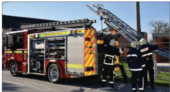
Navalna vozila Dennis Sabre temelj su opremljenosti DVD-a Sveti Đurđ (na slici) i DVD-a Hrženica

b) potrebu dodatne edukacije predsjednika mjesnih odbora odnosno povjerenika civilne zaštite iz područja civilne zaštite,