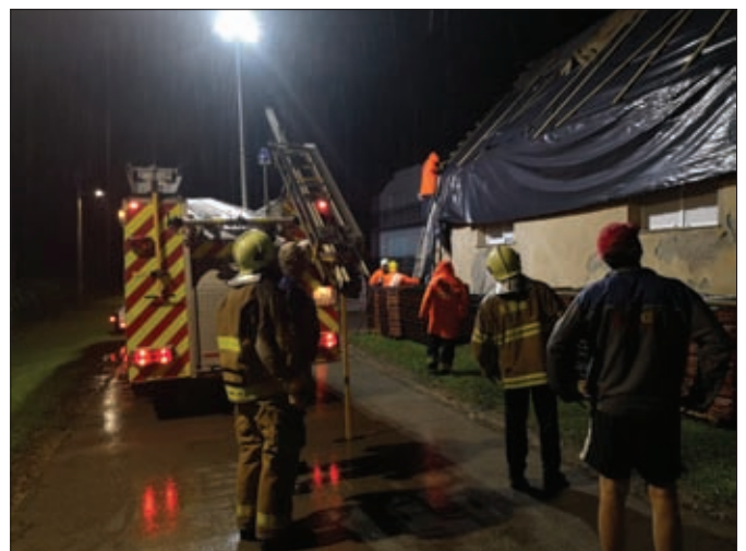
U tehničkoj intervenciji u Komarnici Ludbreškoj sudjelovali su DVD Sveti Đurđ i DVD Komarnica Ludbreška

U svim su intervencijama iskazani maksimalni napori da se smanji nastala materijalna šteta, no ista je na žalost nekad neizbježna, što dodatno naglašava potrebu promicanja protupožarne preventive. Godina je bila puna i tzv. ostalih operativnih aktivnosti, pod kojima podrazumijevamo ispumpavanja izvora vode (bunara),