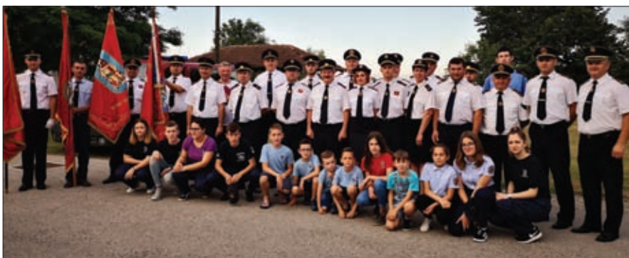
Predstavnici vatrogastva tradicionalno sudjeluju u svetoj misi na blagdan Tijelova

U segmentu tradicionalnih manifestacija valja spomenuti kako se i ove godine u organizaciji DVD-a Hrženica i VZO Sveti Đurđ, u vatrogasnom domu u Hrženici povodom obilježavanja Dana vatrogastva okupilo stotinjak vatrogasaca, dok se 50-ak vatrogasaca okupilo u okviru obilježavanja blagdana Tijelovo, a tradicionalno su držali i stražu kod Božjeg groba na Veliku subotu u župnoj crkvi