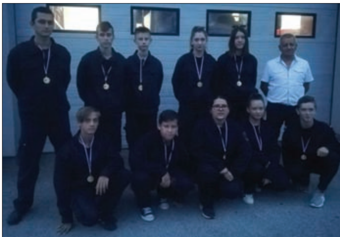
Mladež DVD-a Sveti Đurđ na županijskom natjecanju osvojila je vrlo dobro četvrto mjesto

Njihove su vršnjakinje iz DVD-a Hrženica zauzele 7. mjesto, dok su pripadnici muške mladeži DVD-a Sveti Đurđ zauzeli 4. mjesto.