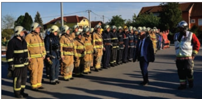
Smotra sudionika pokazne vježbe Potres u Svetom Đurđu 2019. - jednog od središnjih događanja povodom obilježavanja „Đurđeva“

Na kraju je održana analiza vježbe, u kojoj su sudjelovali nazočni članovi stožera civilne zaštite općine te predstavnici pojedinih žurnih službi. Među zaključcima analize vježbe valja izdvojiti sljedeće: