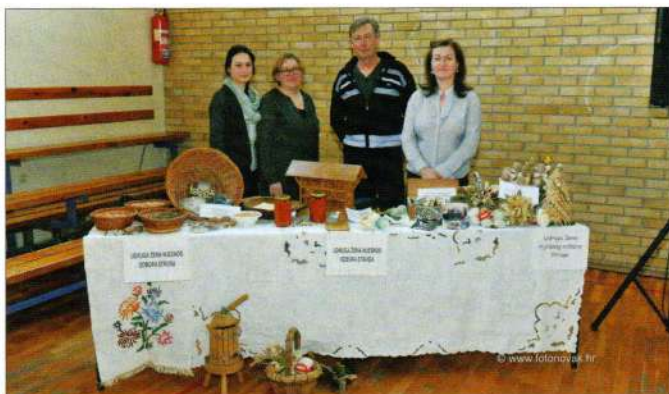
Udruga žena Mjesnog Odbora Struga

Udruga žena MO Struga okuplja žene iz Struge i okolnih mjesta naše Općine sa ciljem očuvanja tradicijskih vrijednosti našeg kraja, organiziranje