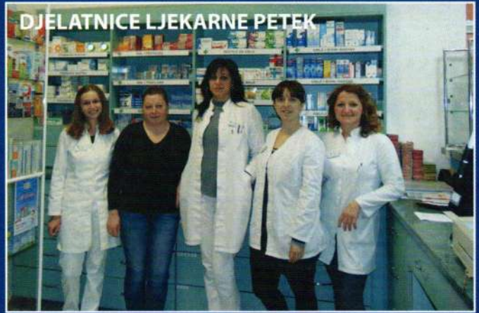
DJELATNICE LJEKARNE PETEK