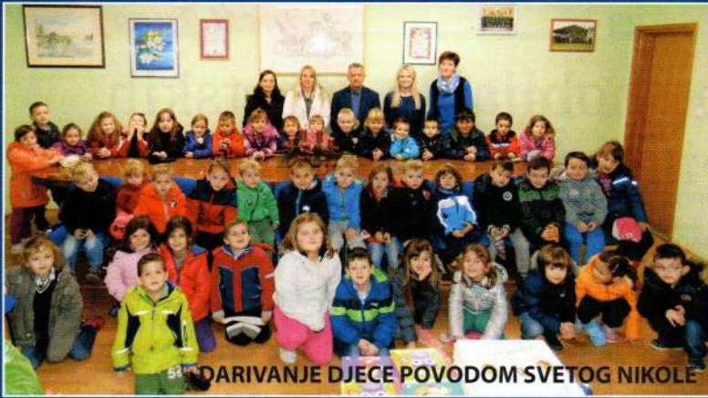
DARIVANJE DJECE POVODOM SVETOG NIKOLE