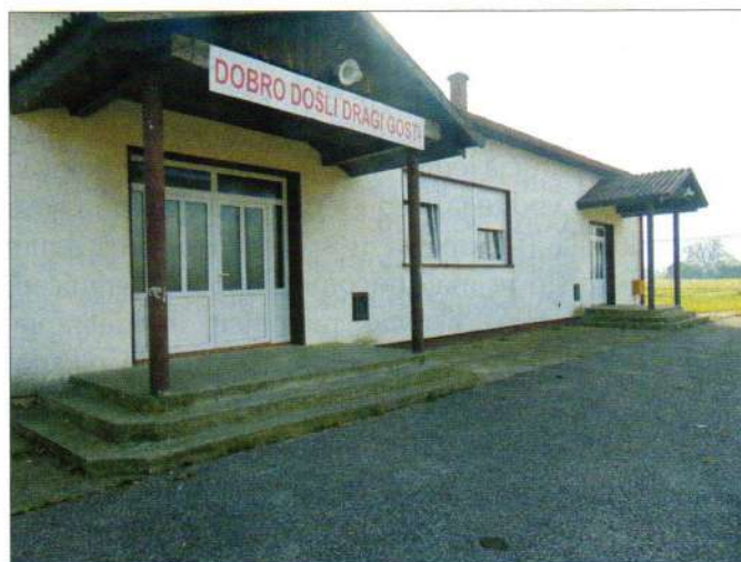
Nova stolarija na vatrogasnom domu u Karlovcu Ludbreškom