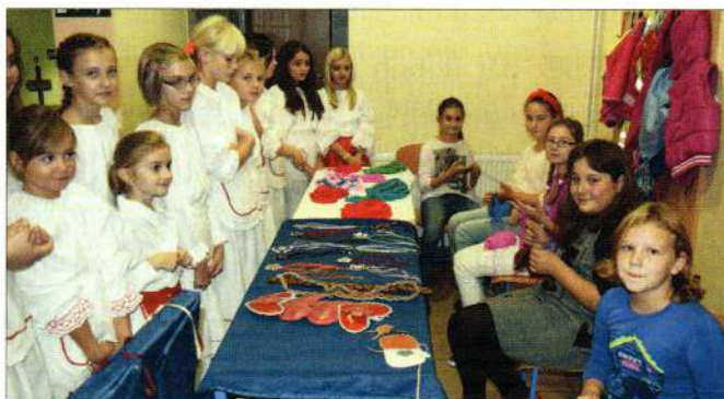
Zadrugari i folkloriši dočekuju goste

Učenici su najponosniji kad predstavljaju Varaždinsku županiju na Državnoj smotri učeničkih zadruga. Zadruga