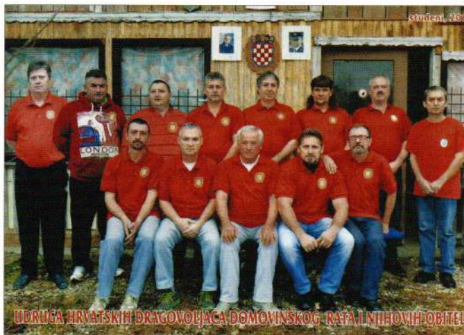
Udruga Hrvatskih Dragovoljaca

Općinski Ogranak Udruge hrvatskih dragovoljaca Domovinskog rata Općine Sveti Đurđ u svome dosadašnjem radu postigao je značajne rezultate ostvarujući svoje ciljeve i svoje programske aktivnosti, te je kao partner prepoznat u općini Sveti Đurđ, gradu Ludbregu i Varaždinskoj županiji. Nadalje, članovi OO UHDDR Sveti Đurđ koriste privatno zemljište koje im je dano na korištenje na neodređeno vrijeme i koje su vlastitim radom uredili i izgradili popratne objekte, a koriste ga za druženja članova, članove njihovih obitelji i djece, te za potrebe ostalih udruga proisteklih iz domovinskog rata. U narednom periodu su okrupnili dio zemljišta i zaokružili ga u jednu cjelinu kako bi