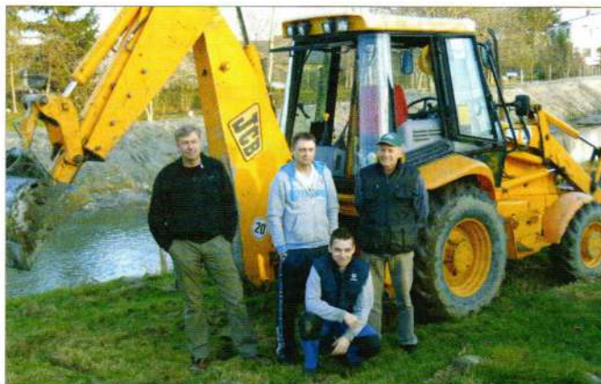
Izmuljivanje rijeke Plitvice