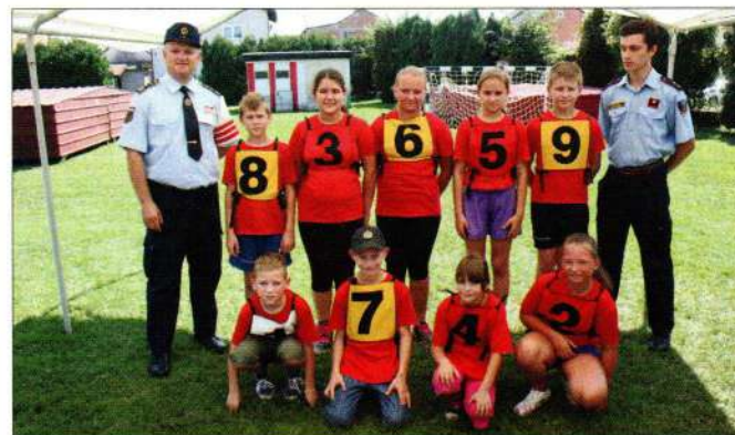
DVD Sveti Đurđ na Županijskom natjecanju