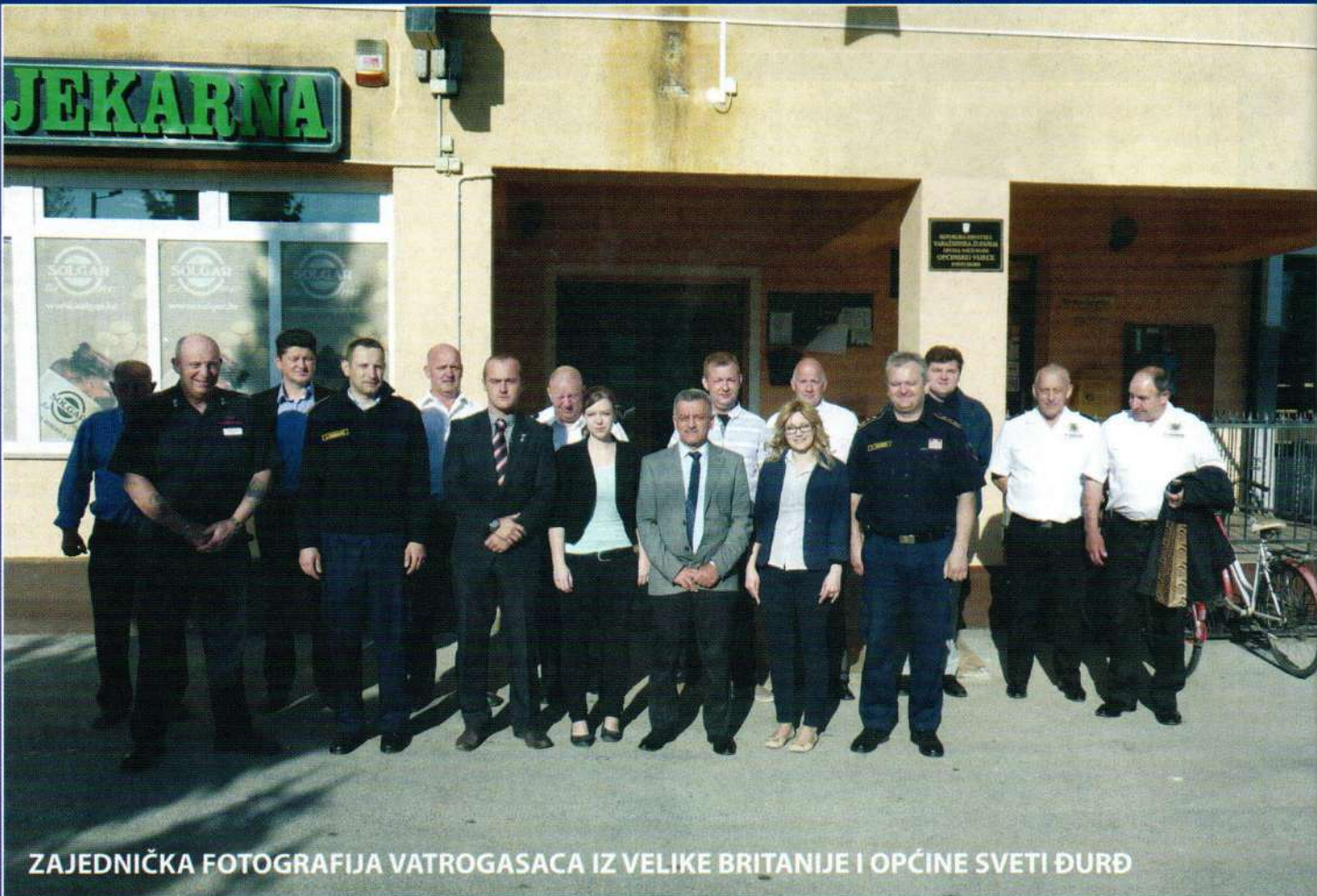
ZAJEDNIČKA FOTOGRAFIJA VATROGASACA IZ VELIKE BRITANIJE I OPĆINE SVETI ĐURĐ