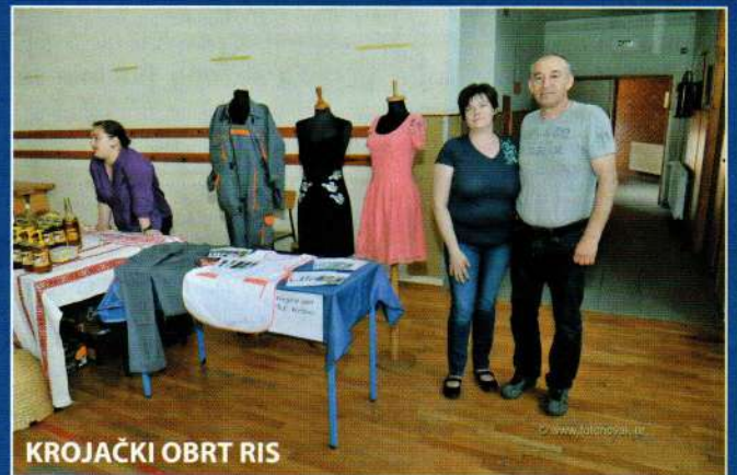
KROJAČKI OBRT RIS