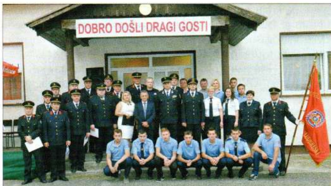
Svečana proslava DVD-a Karlovec Ludbreški

Republike Hrvatske u Svetište Majke Božje Bistričke te kasnijem hodočašću vatrogasaca ludbreške regije u Svetište Predragocjene Krvi Kristove u Ludbreg, a tradicionalno su držali stražu kod Božjeg groba na Veliku subotu u župnoj crkvi u Svetom Đurđu.