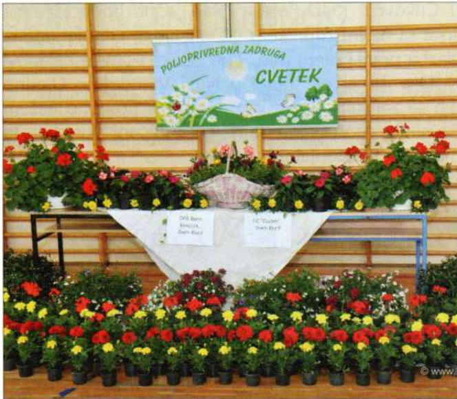
Poljoprivredna zadruga Cvetek

usluga, uloženom radu zaposlenika ili nekim drugim kriterijima vrednujući aktivnost zadrugara, a ne kapital.