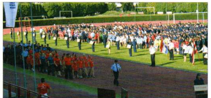
Natjecanje vatrogasne mladeži Varaždinske županije