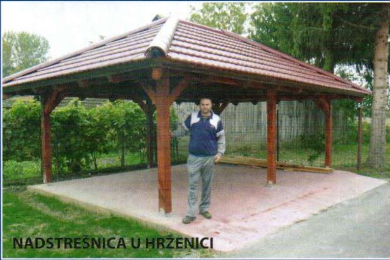
NADSTREŠNICA U HRZENICI