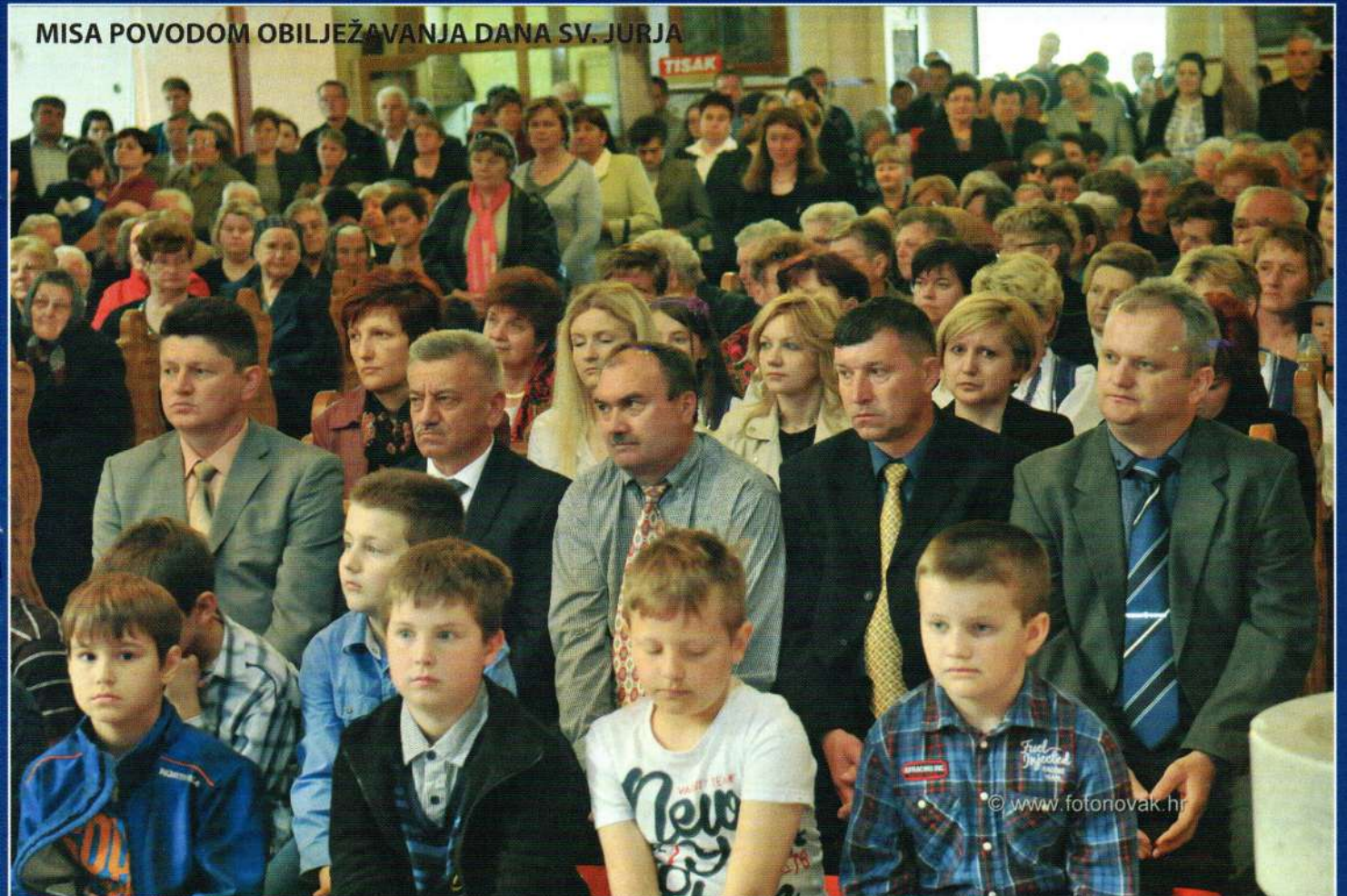
MISA POVODOM OBILJEŽAVANJA DANA SV. JURJA