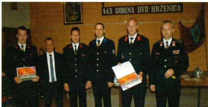
Florijanovo u Hrženici

Kad se spominju vjerske manifestacije recimo kako su članovi naših DVD-ova sudjelovali u hodočašću vatrogasaca