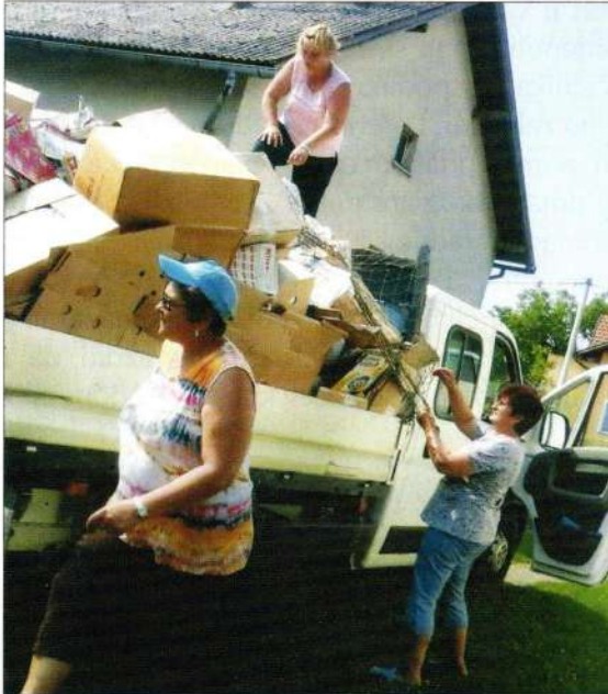
Skupljanje starog papira

„Veliko srce“ udruga žena općine Sveti Đurđ bila je veoma aktivna i u 2015. godini, te na svoj način sigurno prednjači u radu i aktivnostima koje su svojevrsne takvom udruživanju žena. Udruga je usklađena s odredbama novog Zakona o udrugama, što potvrđuje i