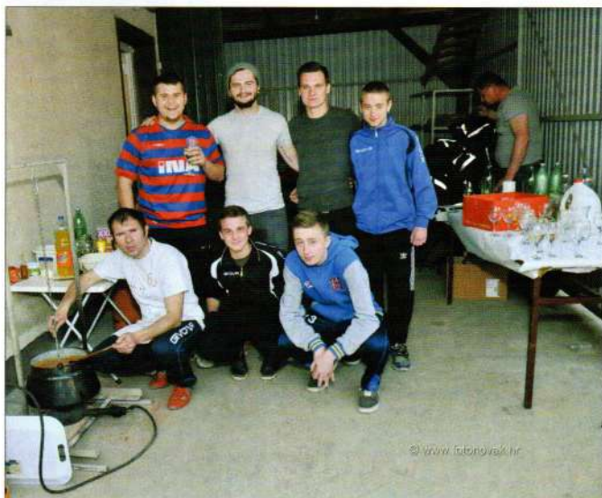
Natjecanje udruga u pripremanju kulinarskih specijaliteta

2015. proslava dana Općine "Đurđevo 2015" održala se četiri dana. Po prvi put sve događaje je popratila i VTV. Prvog dana u malonogometnoj utakmici između općine Donji Martijanec i općine Sveti Đurđ, vijećnici općine Sveti Đurđ, pod vodstvom načelnika općine Josipa Jany "razbili" su vijećnike Donjeg Martijanca.