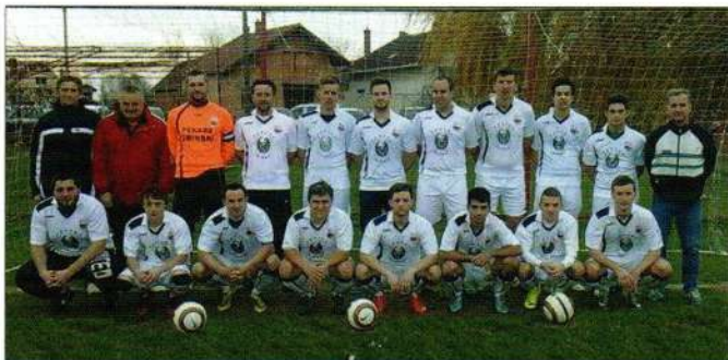
ŠNK Radnički Hrženica, jesen 2015.