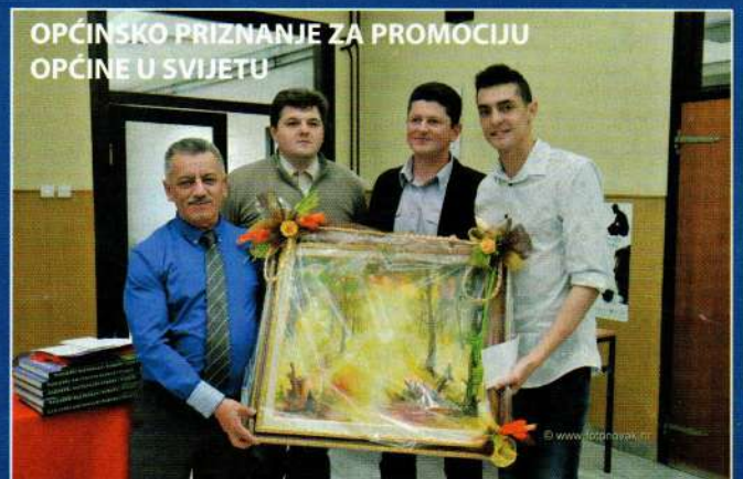
OPĆINSKO PRIZNANJE ZA PROMOCIJU OPĆINE U SVIJETU