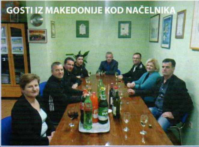
GOSTI IZ MAKEDONIJE KOD NAČELNIKA