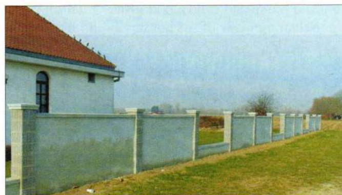
Ograda na groblju u Strugi