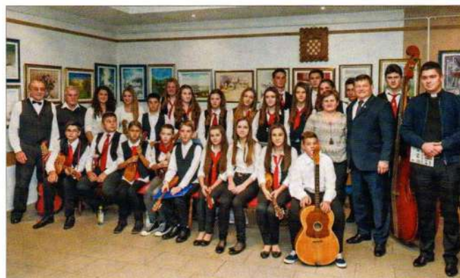
KUD Juraj Lončarić