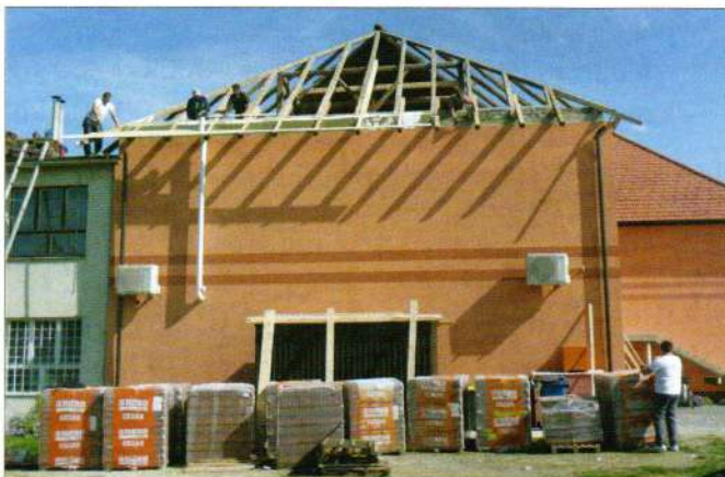
Radovi na općinskoj zgradi