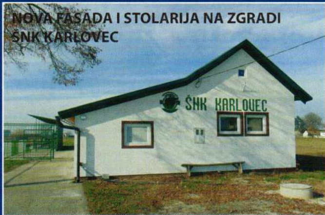
NOVA FASADA I STOLARIJA NA ZGRADI SNK KARLOVEC