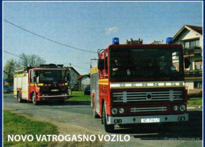
NOVO VATROGASNO VOZILO