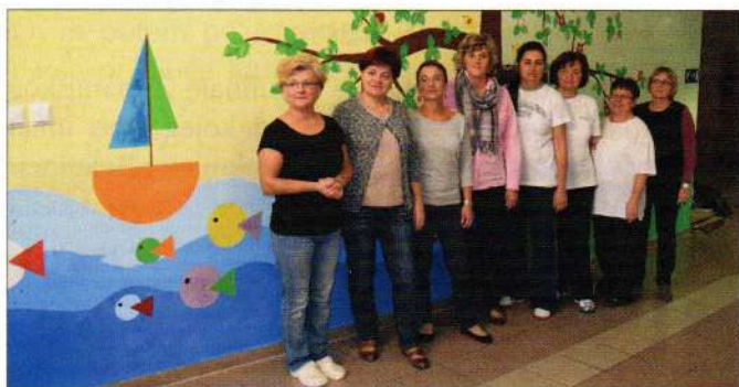
Učitelji na dan učitelja oslikali zidove škole

U Općini Sveti Đurđ osnovnoškolsko obrazovanje ima dugu tradiciju. Nekad je skoro svako selo ove općine imalo svoju školu, a danas u središtu sela stoji velika zgrada Osnovne škole Sveti Đurđ u kojoj uči u jednosmjenskoj nastavi 343 učenika od 1. do 8. razreda.