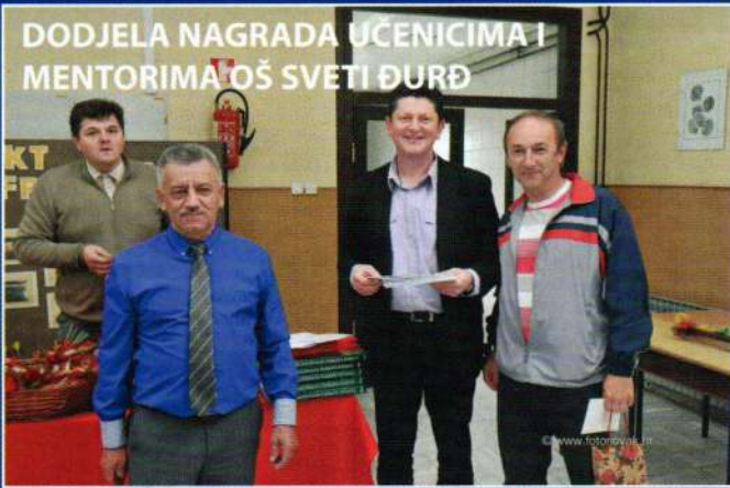
DODJELA NAGRADA UČENICIMA I MENTORIMA OŠ SVETI ĐURĐ