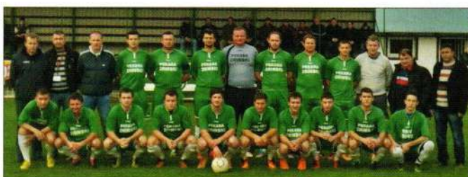
ŠNK Karlovec Ludbreški