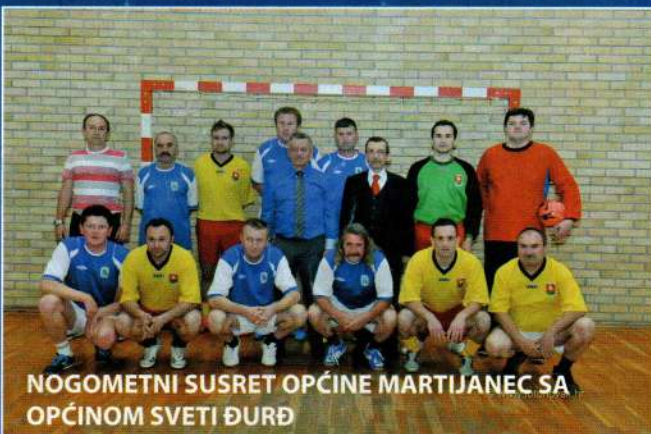
NOGOMETNI SUSRET OPĆINE MARTIJANEC SA OPĆINOM SVETI ĐURĐ