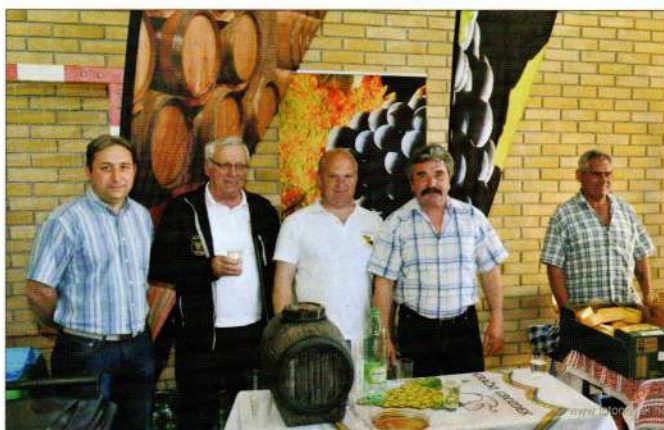
Udruga vinara Grački Grozdek