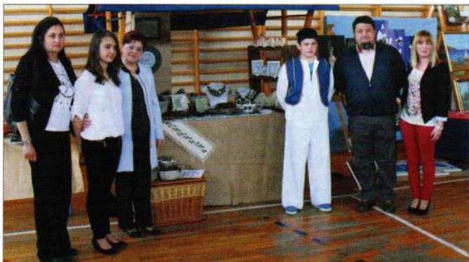
Zadruga se predstavila na gospodarsko-kulturnom sajmu