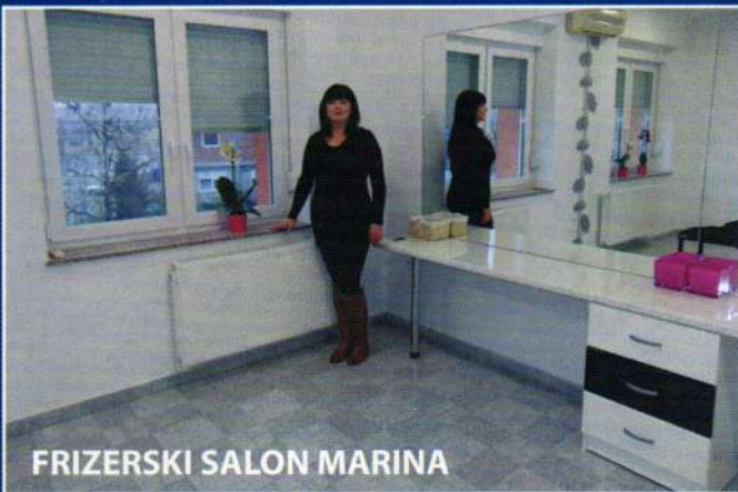
FRIZERSKI SALON MARINA