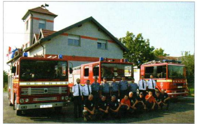
Gosti iz Slovenije