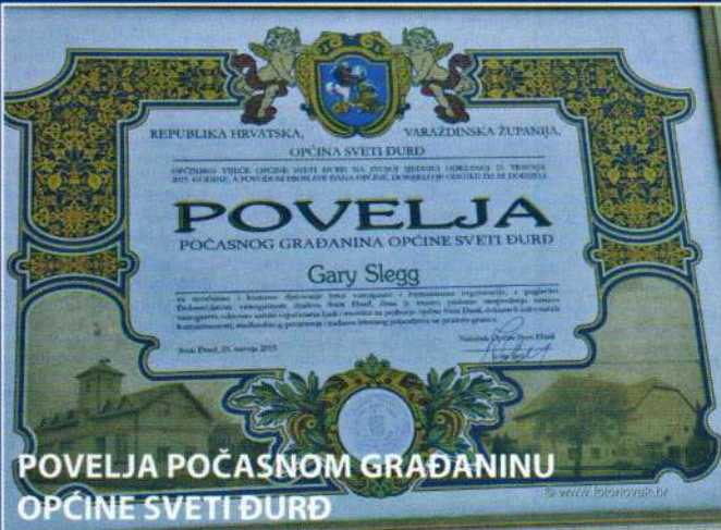
POVELJA POČASNOM GRAĐANINU OPĆINE SVETI ĐURĐ