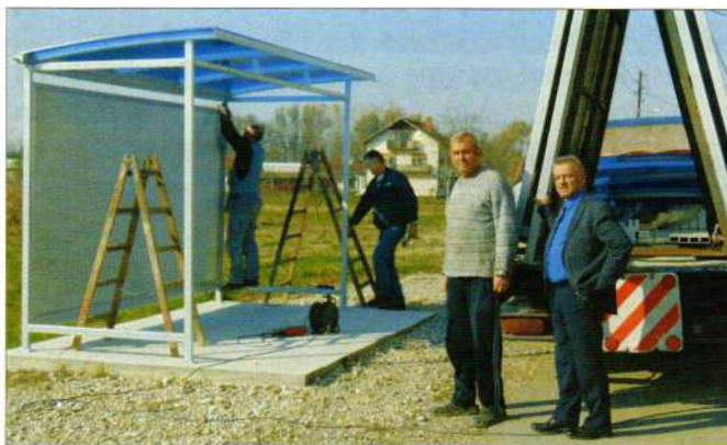
Postavljanje autobusnih stajališta