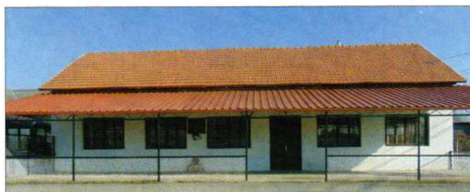
Nadstrešnica na društvenom domu u Komarnici