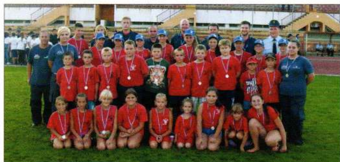
DVD Hrzenica na Županijskom natjecanju

Vatrogasna zajednica Varaždinske županije 2014. godinu, kao jednogodišnje razdoblje prepuno različitih događanja, od rekordnog broja tehničkih intervencija vezanih uz poplave, do dosad najvećeg broja osposobljenih vatrogasaca, privela je kraju svečanom primopredajom 17 kompleta opreme za ispuštanje vode (vrijednosti nešto više od 100.000 kn) pripadnicima 16 DVD-ova i JVP Grada Varaždina, a koji su