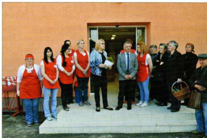
Otvaranje trgovačkog centra „Kitro“

Srijeda je bila rezervirana za predavanje "Kako do sredstava EU fondova". Predavači su bili AZRA, Luneta, Lag Izvor. U večernjim satima otvoren je gospodarsko kulturni sajam "Đurđ" 2015. sa 30 izlagača. Druženje je nastavljeno u prepunom društvenom domu u Sv.