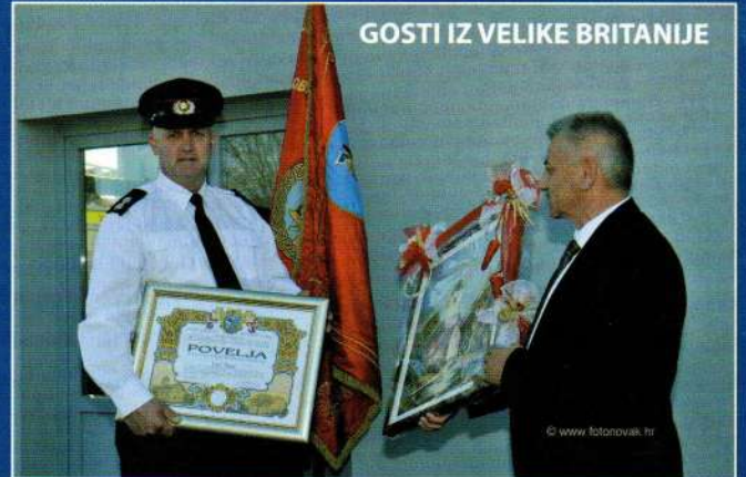
GOSTI IZ VELIKE BRITANIJE