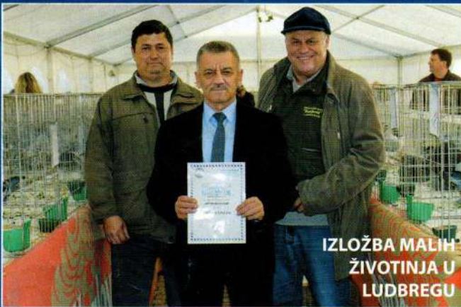
IZLOŽBA MALIH ŽIVOTINJA U LUDBREGU