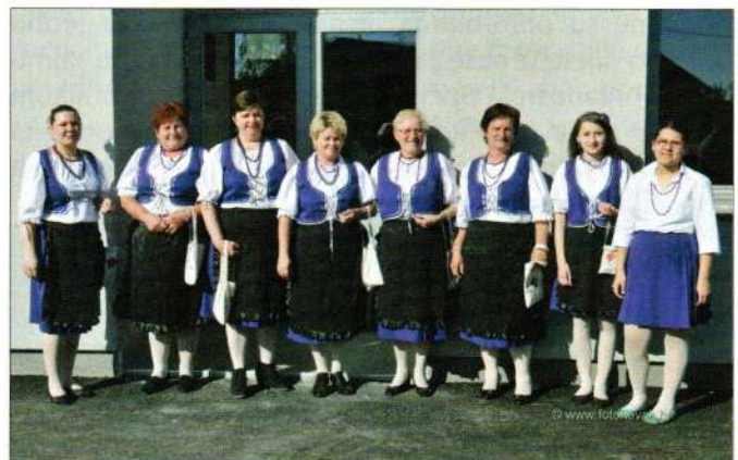
Udruga žena Đurdek

Udruga ima 14 aktivnih članica i 10 počasnih članica koje uvijek pomažu u bilo kakvim djelatnostima udruge. Udruga se bavi humanitarnim i ekološkim radom. Svake godine organiziramo redovnu godišnju skupštinu zajedno sa Crvenim križem. Obilježavamo međunarodni Dan žena 8. ožujka. Pečemo kolače za potrebe udruge i u humanitarne svrhe. Ove godine sudjelovale smo na svetim misama u narodnim nošnjama. Bile smo na svečanosti DVD-a Sveti Đurđ prilikom dodjele vatrogasnog vozila donacije iz Engleske. Za Dan Općine bile smo na svim svečanostima. Izrađujemo ručne radove, posjećujemo jedna drugu i na taj način planiramo i dogovaramo o daljnjem radu udruge. Surađujemo s drugim udrugama naše Općine i izvan nje. Pomažemo svima koji žele našu pomoć. 2016. godine proslavit ćemo 10 godina