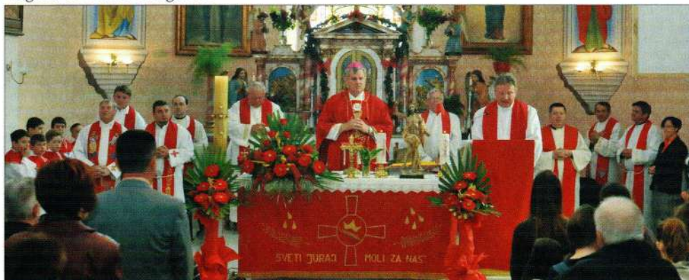
Sveta misa povodom Đurđeva 2015.