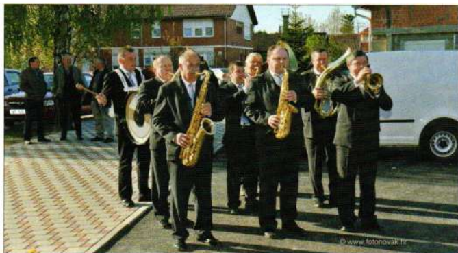
KUD Sloga na otvorenju trgovačkog centra Kitro

KUD "Sloga" iz Karlovca Ludbreškog osnovan je 11.05.1998. godine s ciljem očuvanja kulturne baštine te promicanja kulturnih potreba i interesa našeg kraja i mjesta. Udrugu čine limena glazba i udruga žena. Ove godine limena glazba imala je puno nastupa, kao svake godine od osnutka, i to na području Varaždinske županije te Međimurske županije. Od značajnijih nastupa mogu se izdvojiti nastupi za dan Općine, na otvorenju novog vatrogasnog doma te trgovine "Kitro" u Svetom Đurđu, za dan vatrogasaca u Hrženici, obljetnici DVD Karlovec, nastup na nogometnom turniru u Karlovcu Ludbreškom. Nastupili smo u općini Donji Martijanec povodom dana vatrogastva, kao i dana zahvalnosti. Nastup u Ludbregu bio je za Vincekovo, povodom blagdana Svete Nedjelje na Ludbreškom sajmu i procesiji na Tijelovo. U Međimurskoj županiji bili smo u Prelogu za praznik rada, dane cvijeća i dane jagoda, te za obljetnicu DVD Prelog. Također, sudjelovali smo na seoskim igrama