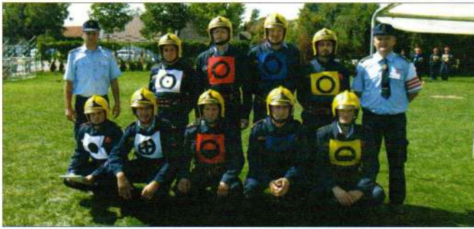
DVD Sveti Đurđ na Županijskom natjecanju