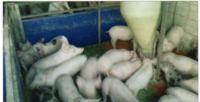
Udruga uzgajivača svinja

Sjedište Udruge je u općini Sveti Đurđ, Braće Radića 1, jer iz te općine potječe oko 70% svih članova. U tom dijelu ludbreške podravine koncentrirana je proizvodnja odojaka na malim obiteljskim gospodarstvima u Republici Hrvatskoj. Od većih projekata treba spomenuti da smo krajem prošle godine iz Danske uvezli nazimice za članove Udruge, odnosno oko 120 komada, koje su vrh genetike u toj proizvodnji. Nazimice su bile sufinancirane od strane Varaždinske županije u iznosu oko 1.250,00 kn po komadu, na čemu im se ovim putem još jednom zahvaljujemo. Ove godine, zajedno sa dr. Zoran Lipej sa Veterinarskog fakulteta u Zagrebu, pokrenuli smo projekt izdavanja Priručnika o svinjogojstvu, prvi takav u Republici Hrvatskoj, koji bi uvelike trebao pridonijeti boljim rezultatima u liječenju i