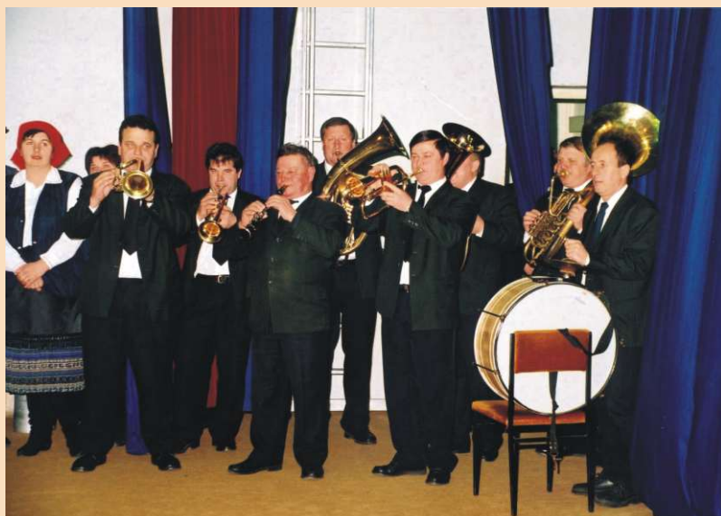
Pripadnici KUD-a "Sloga" Karlovec - puhački orkestar (Sesvete-Karlovec)