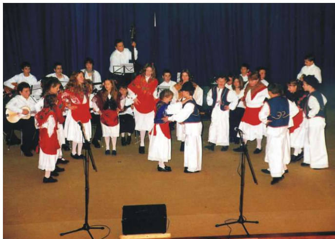
Folklorna grupa OŠ Sv. Đurđ na humanitarnoj priredbi u Ludbregu