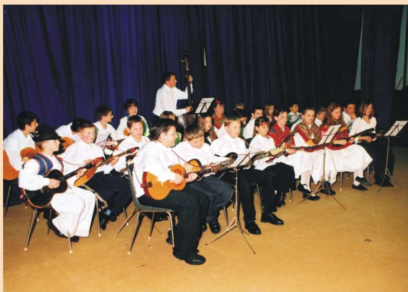
KUD "Juraj Lončarić" Hrženica na humanitarnoj priredbi u Ludbregu