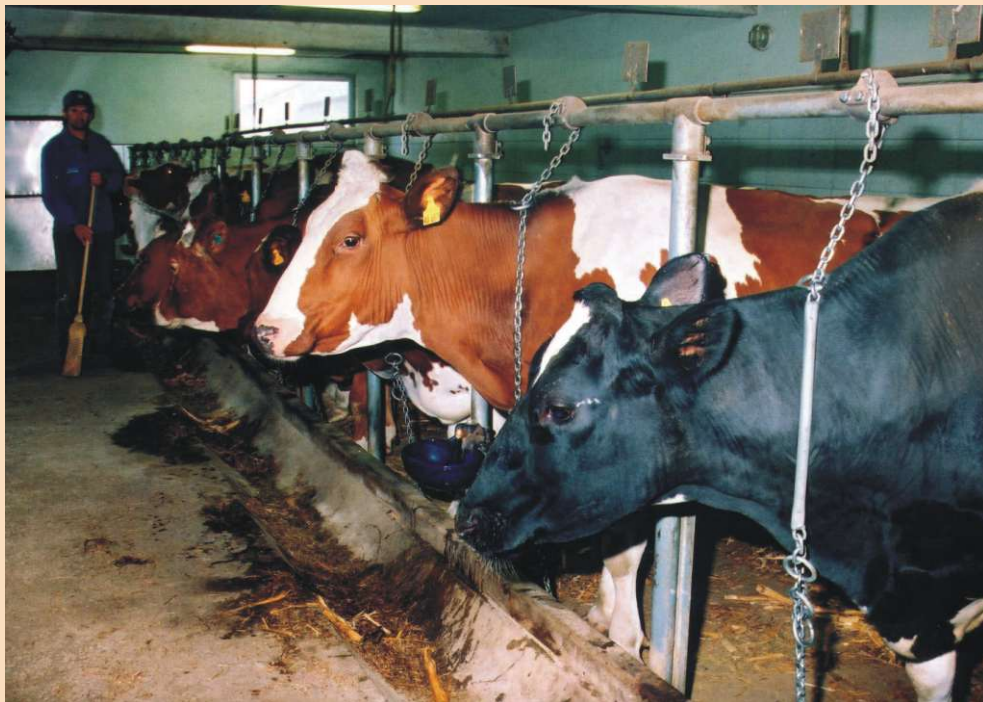
Farma mliječnih krava obitelji Kos u Prilesu

Josip Kos iz Prilesa već se oko 5 godina bavi uzgojem mliječnih krava i proizvodnjom mlijeka, u čemu je vrlo uspješan. Njegova obitelj također je u tom poslu pronašla izvor zarade. U stajama drži 10 komada mliječnih krava pasmine "crveni holstein" koje godišnje daju oko 55 000 litara mlijeka. Krave imaju vrlo kvalitetnu ishranu koju samostalno osigurava.