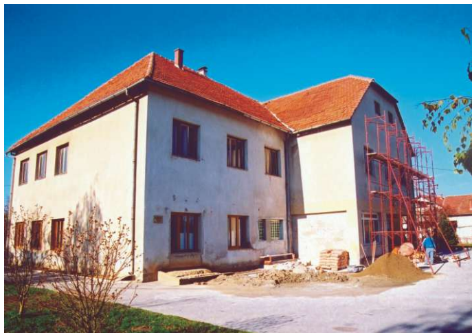
Općinska zgrada prije ...

Promatrajući strukturu stanovništva vidljivo je rapidno opadanje od 1953. godine kada smo imali 5.480 stanovnika, 1971. godine 4.788, 1981. 4.396, 1991. 4.410 te 2001. godine 4.184. Tu je zabrinjavajući podatak indeks starenja koji se izračunava kao odnos broja stanovnika starijih od 60 i više godina i broja stanovnika od 0 - 19 godina. Taj indeks starenja u našoj općini iznosi 84,57. Naredni veliki problem je podatak o broju nezaposlenih što je vidljivo iz mjesečnog biltena Zavoda za zapošljavanje - Područne službe Varaždin gdje je od 4.184 stanovnika s 31.12.2001. godine u našoj općini 276 nezaposlenih, što iznosi 6,6 %.