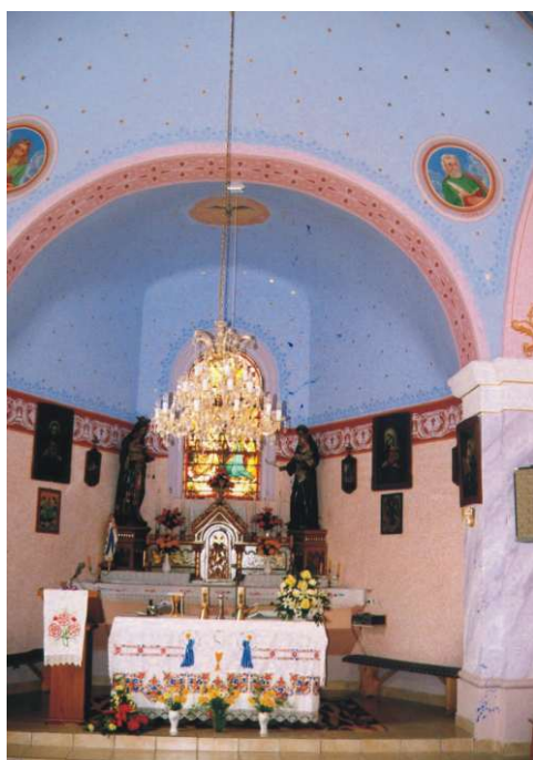
Novouređena kapelica u Sesvetama Ludbreškim

U protekloj godini završeno je polaganje finog sloja asfalta po ulicama, obnovljena je mrvačnica i središnji križ na groblju. Nogometni klub konačno je postavljen na zdrave financijske noge. Zatim se prišlo sređivanju okoliša navozom zemlje te uređenju sv. Florijana. Također je u planu uređenje smetlišta i rušenje stare škole.