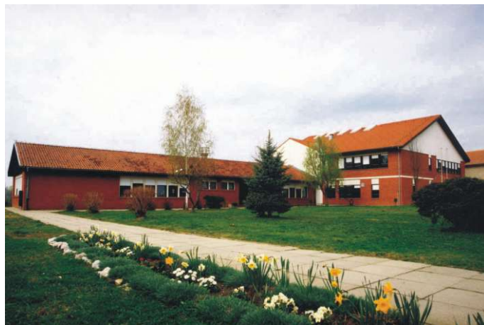
OŠ Sveti Đurđ