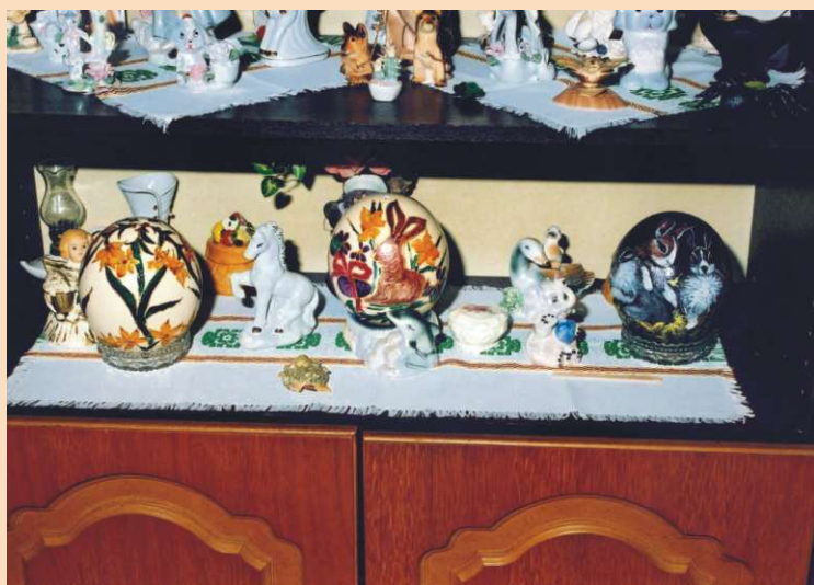
Nojeva jaja mogu biti lijep ukras, zar ne?

biljkama. Nojevi trebaju i veće količine pijeska za kupanje i također, što je neobično, šljunka za probavu.