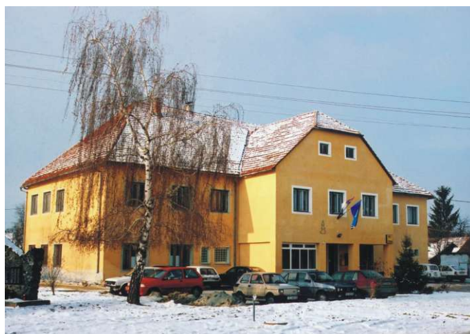
... i nakon uređenja