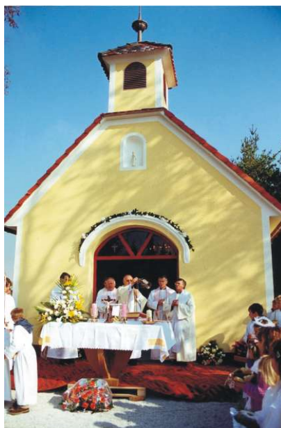
Sveta misa u novosagrađenoj kapelici u Luki