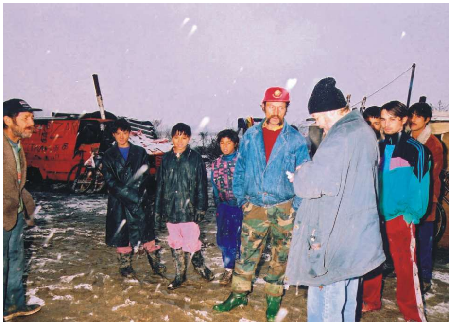
Romsko naselje u Sv. Đurđu dobilo javni vodovod

Naselje Roma u Svetom Đurdu bilo je u dosta lošem stanju pa smo pristupili njegovom sređivanju. Najprije se buldožerom sredio okoliš kako ne bi zbog raznog otpada, crkotina i nehigijene došlo do zaraze. Nakon toga prišlo se investiciji izgradnje javnog vodovoda, u čemu su sudjelovali i Romi s oko 2.000 kuna. Zajedno sa svim udrugama započeli smo uređenje Vulinca te odlagališta otpada, uređenje dječjeg igrališta ispred društvenog doma, gdje je nabavljen tobogan te posađeno raslinje i cvijeće uz nesebično zalaganje Borisa Kovačeka. U izgradnji je i sanitarni čvor uz dom te sređivanje kuhinje novim pločicama.