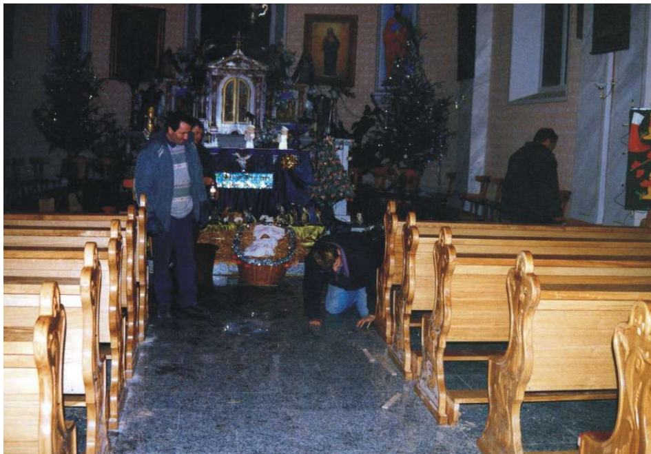
Postavljanje novih klupa u obnovljenoj Crkvi sv. Juraja

U vrijeme "Došašća" i "Korizme" učenici 2. i 3. te 7. i 8. razreda poimenice su se predstavili okupljenim vjernicima