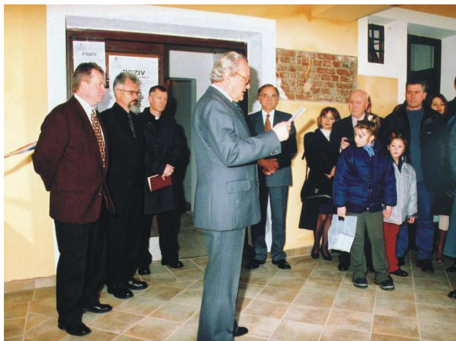
Na otvorenju ljekarne u Sv. Đurđu

Mještani također svojim zalaganjem uređuju mrtvačnicu. Tijekom godine dovršit će se radovi po programu mjesnog odbora.