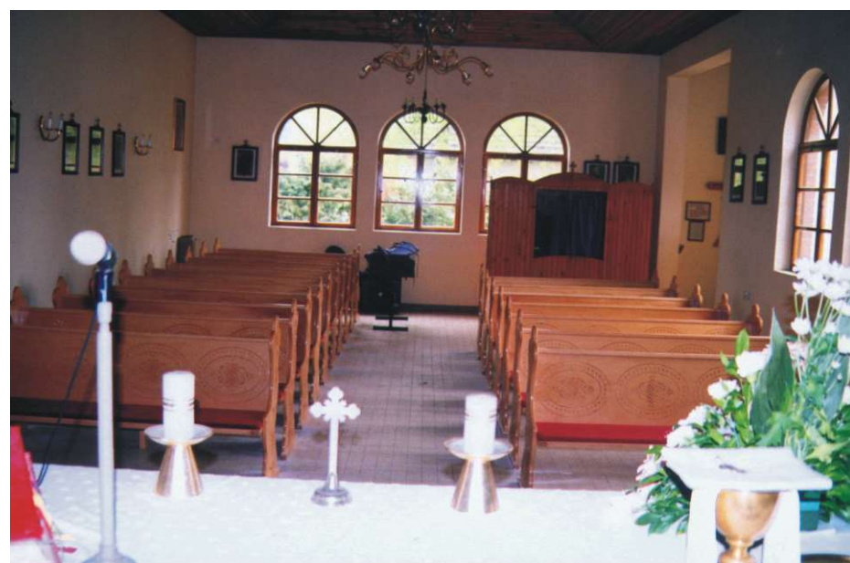
Novouređena Kapelica sv. Ane u Strugi

Tijekom prošle godine u Prilesu je sređeno i otvoreno malonogometno igralište, obnovljena javna rasvjeta