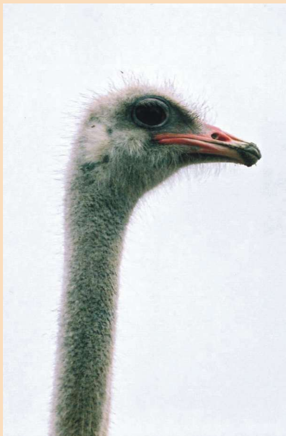
Radoznali pogled u fotoapararat našeg bradonje Mireka