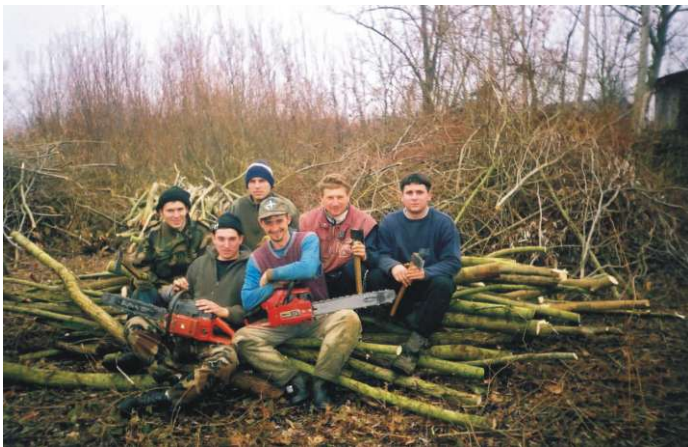
Članovi eko-udruge "Vulinec" u akciji uređenja okoliša