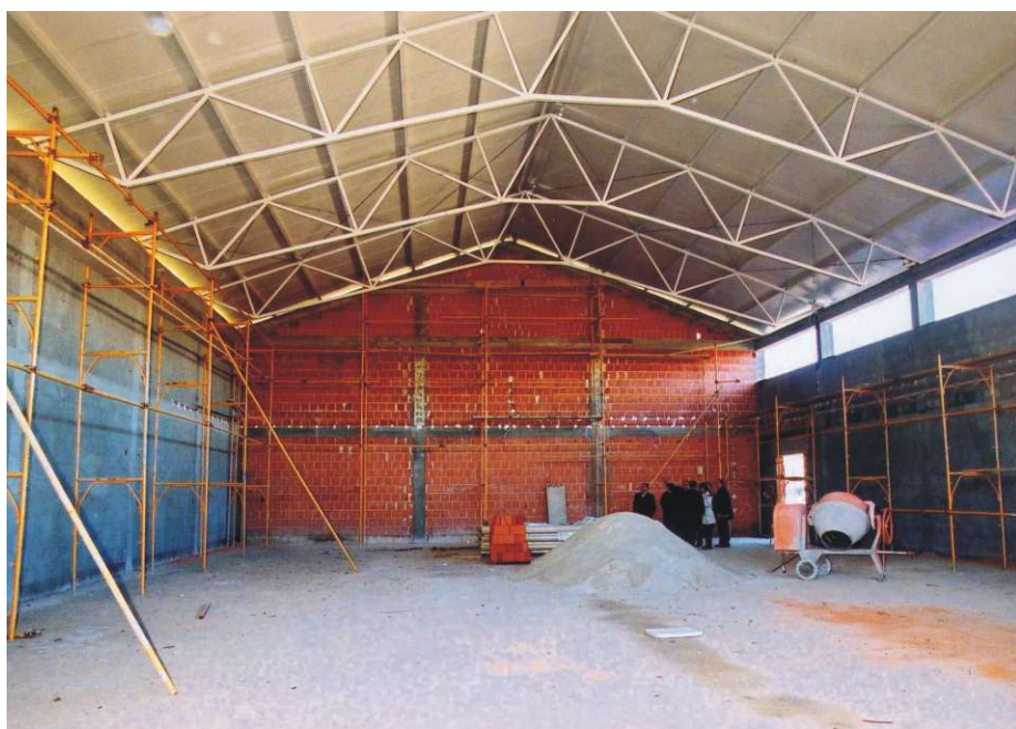
Izgradnja sportske dvorane OŠ Sv. Đurđ