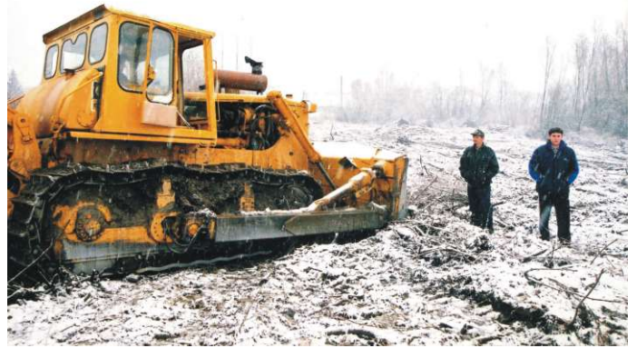
Ipak su ekolozi morali pozvati u pomoć moćnu tehniku.

U protekloj godini iz naših akcija izdvajamo najvažnije: iskrčili smo šikaru i iščupali panjeve, pomogli smo kod postavljanja žičane ograde na odlagalištu otpada u Svetom Đurđu, sud-