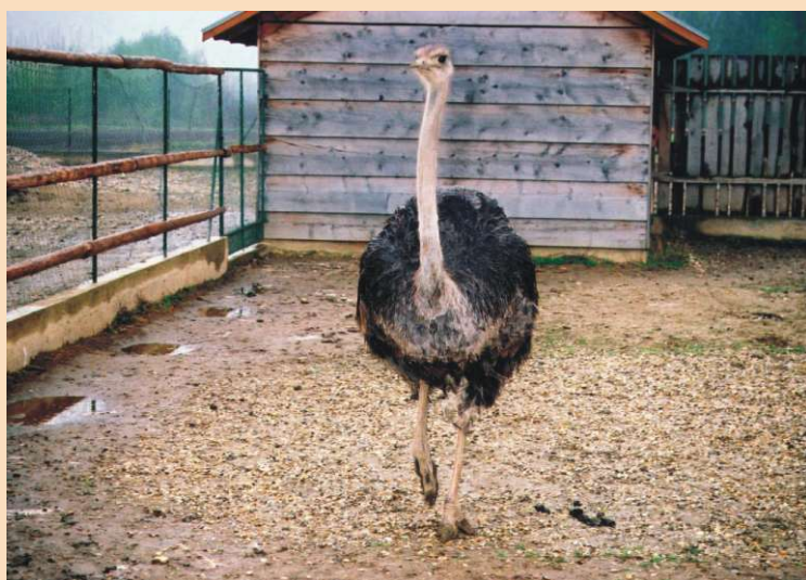
Noj mužjak u pohodu

biljkama. Nojevi trebaju i veće količine pijeska za kupanje i također, što je neobično, šljunka za probavu.