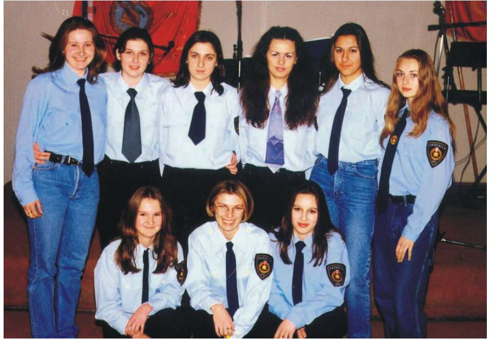
Ženska desetina DVD Hrženica