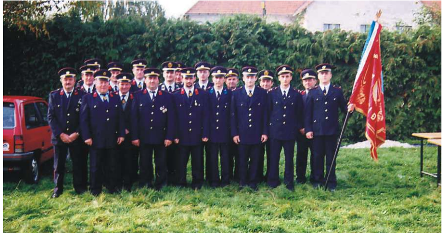
DVD Hrženica bliži se 130-toj obljetnici osnutka

Uspješnom organizacijom 125. obljetnice osnutka Društva 1997. godine završeno je jedno razdoblje u razvoju ove značajne organizacije te pripremljen teren za prirodnu smjenu generacija u Društvu. DVD Hrženica danas je značajan čimbenik zaštite od požara i vatro-