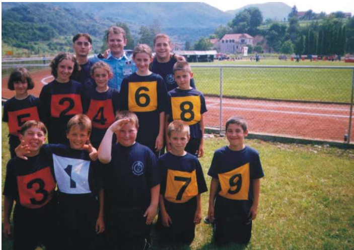
Desetina djece DVD Sv. Đurđ u Lepoglavi 2001. godine