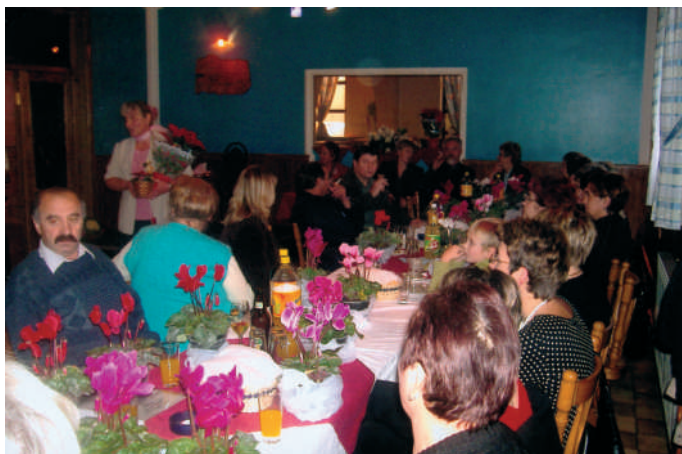
Više cvijeća ...

Projekt sufinanciranja prijevoza osnovnoškolaca i srednjoškolaca općina podržava s 300 tisuća kuna godišnje.