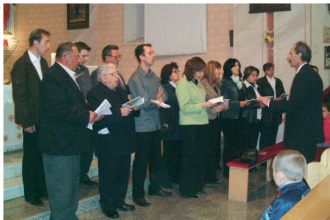
Gosti iz Cirkvene