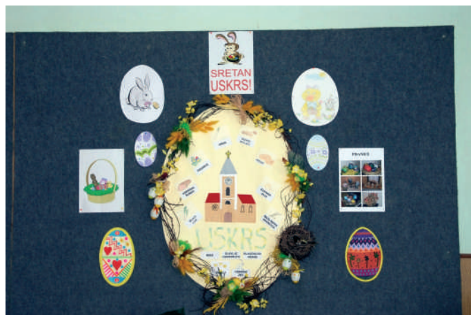
Likovno stvaralaštvo učenika nižih razreda na školskim panoima