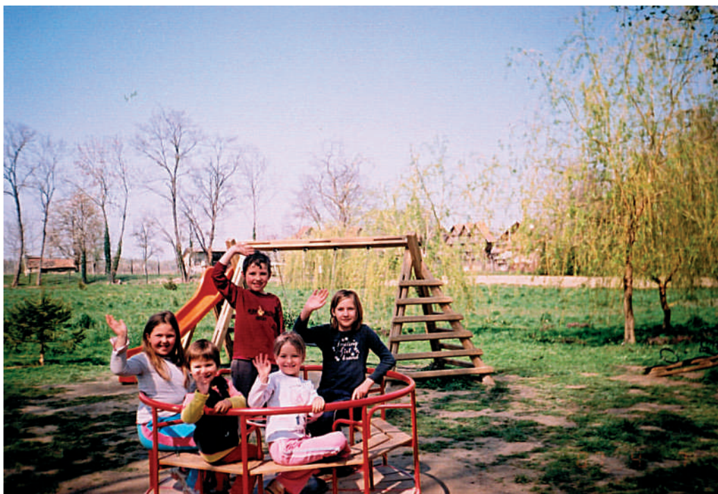
Dječje igralište u Hrzenici

U Hrzenici je montirano dječje igralište (Dolčak) te asfaltirano igralište (uz pomoć županije) u Preloškoj ulici.