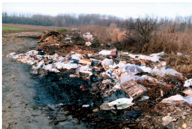
... manje smeća !