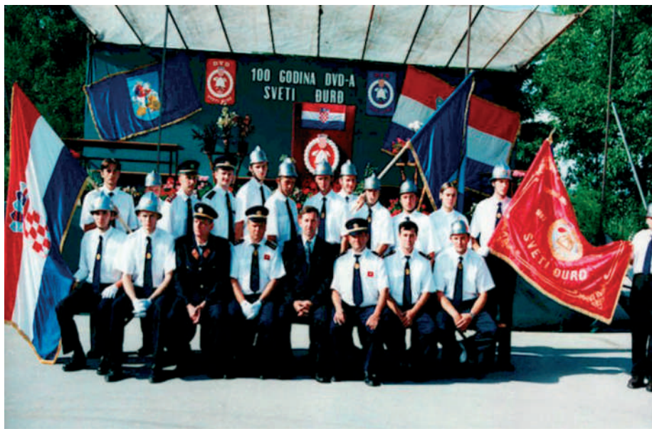
Uspomena - 100 godina DVD-a Sveti Đurđ

Govoriti danas o Svetom Đurđu sa željom da se spomene ono što njegovi mještani smatraju najvažnijim, a ne spomenuti vatrogasce i njihovu uzornu organiza-