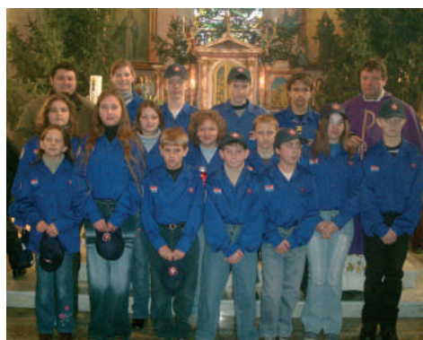
Naši izviđači donijeli Betlehemsko svjetlo

Ove godine spominjemo se kako je 1957. u našoj župnoj crkvi prvi puta zasvijetlila električna sijalica.