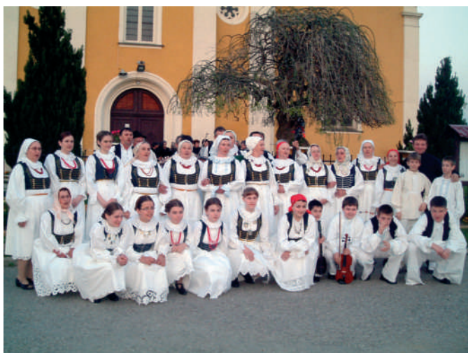
KUD "Sv. Ana" iz Vučjaka na prošlogodišnjem Jurjevu