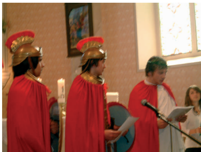
Trodnevica Jurjevo 2006.