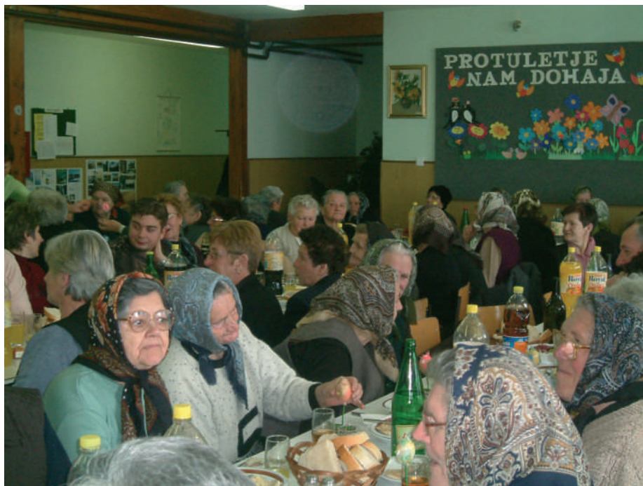
Susret starih i nemoćnih u vrijeme korizme