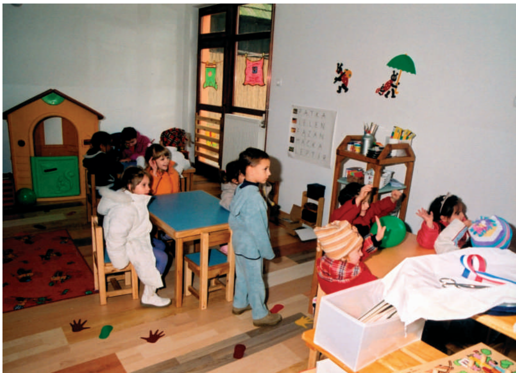
Dječji vrtić "Lavić"

Općina Sveti Đurđ pokreće mnoge razvojne projekte na dobrobit svojih mještana. Poglavarstvo i Vijeće donose programe izgradnje komunalne infrastrukture kao i potrebe u društvenim djelatnostima.