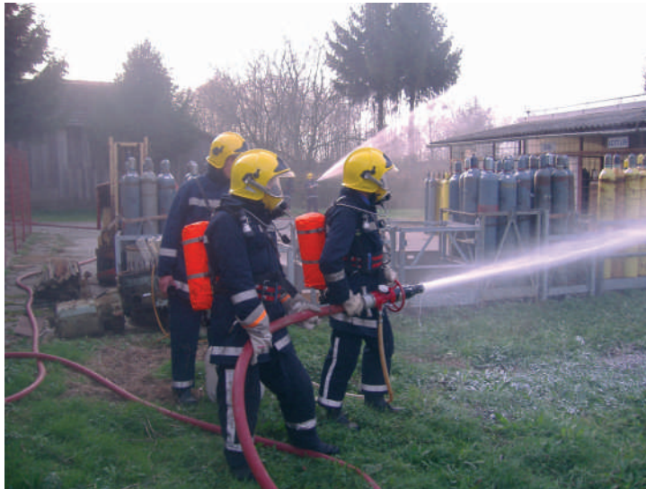
Detalj s pokazne vježbe Hrženica 2006.

Novi posjet izaslanstva britanskih vatrogasaca ostvaren je u proljeće 1999. godine kao nastavak ranije započete uspješne suradnje. Britanska humanitarna vatrogasna organizacija "Operation Florian", donator preko 20 navalnih vatrogasnih vozila i razne ostale opreme vatrogasnim društvima diljem svijeta te je godine pripremila donaciju od 6 vozila za Republiku Hrvatsku. Središnja manifestacija primopredaje ove vrlo značajne donacije pod nazivom "Operation Florian - Sveti Đurđ '99" održana je u Svetom