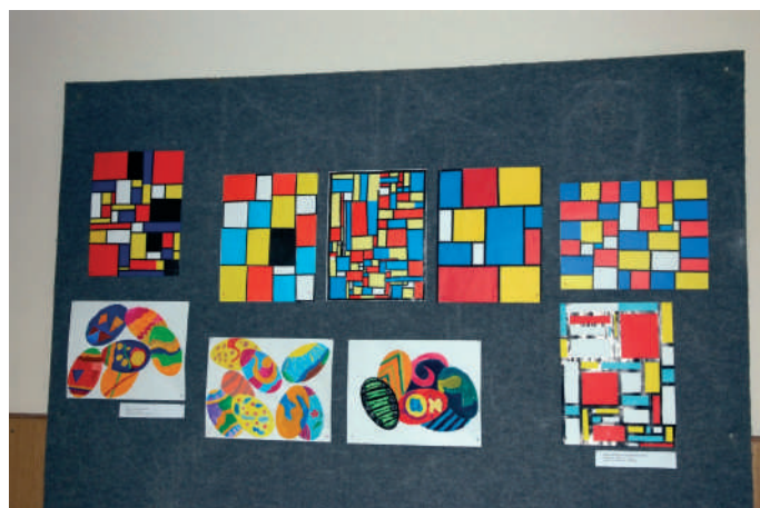
Likovno i literarno stvaralaštvo učenika viših razreda na školskim panoima