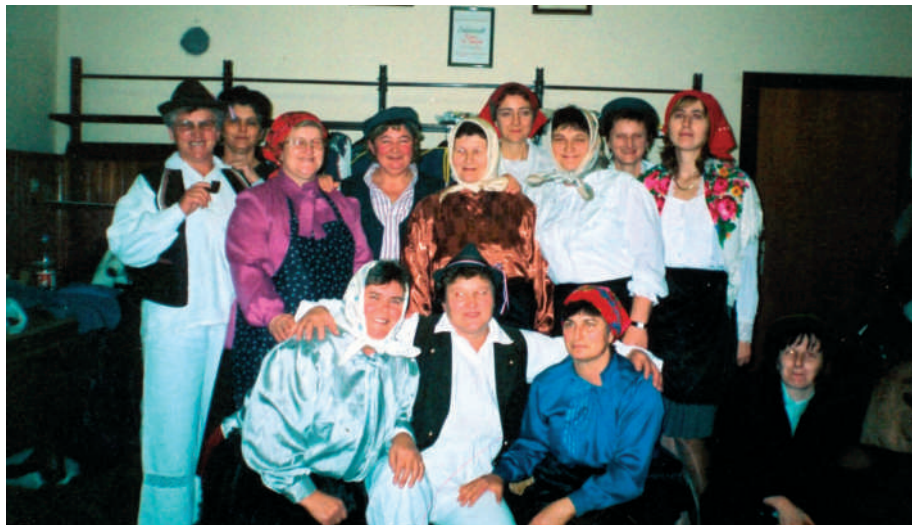
"Čehara" u punom sjaju

Rad i djelovanje sadašnje organizacije "Hrvatskog srca" nastavlja se na svijetlim tradicijama iz prošlih vremena, uz male prilagodbe današnjim uvjetima života i rada. Najveća briga posvećena je upućivanju žena u sve sfere života prema njihovim željama i afinitetima. Priređuju se humanitarne priredbe, posjećuju bolesne članice, roditelje, surađuje se s OŠ Sveti