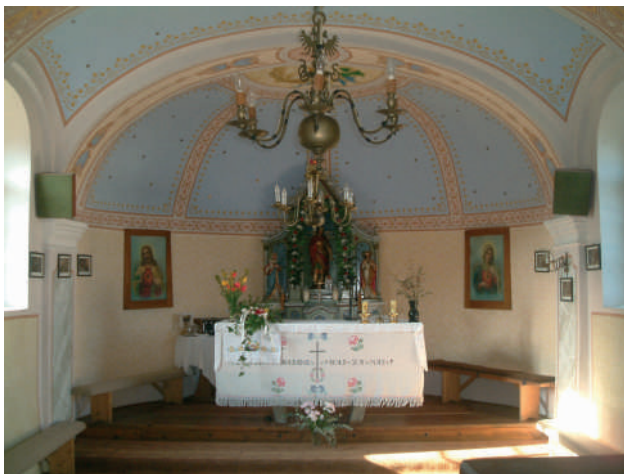
Unutrašnjost kapele Sv. Florijana u Hrženici

Neka u budućim vremenima kapela bude mjesto Božjeg boravka među ljudima, a ljudi neka budu dobri nasljedovatelji sv. Florijana i Božji štovatelji.