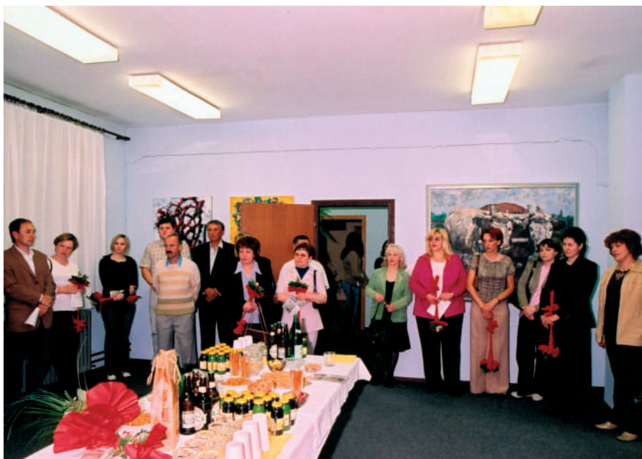
Na otvaranju izložbe

U stalnom otkrivanju onog neizrečenog, Goran je u zanosu stvaranja koje će u budućnosti, sasvim sigurno, progovoriti na nov i neobičan način i nama je za oslušnuti taj jezik njegovih umjetnina.