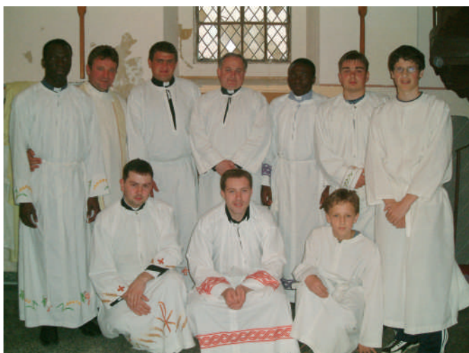
Bogoslovi Varaždinske biskupije u našoj župi