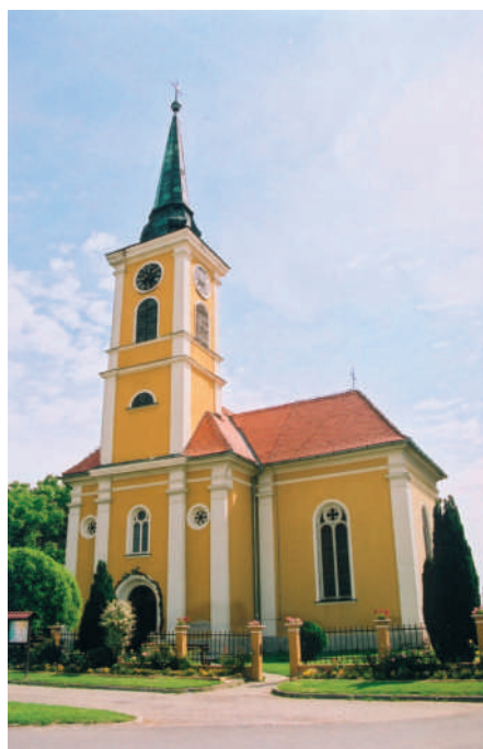
Župna crkva Svetog Jurja

Radeći ovaj intervju, saznala sam mnogo nova o našem župniku. Drag je i pristupačan čovjek koji samo želi služiti Bogu i biti na pomoć ljudima, svojim župljanima.