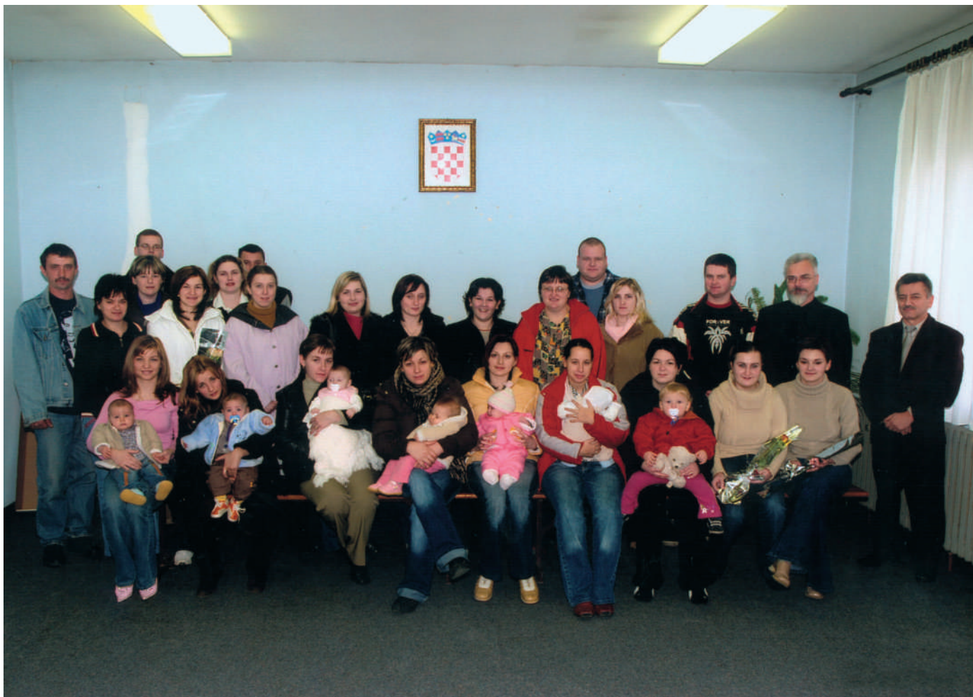
Mame, tate i bebe na dodjeli nagrada

Priles je pred realizacijom izgradnje dječjeg igrališta, što se očekuje i u Obrankovcu.