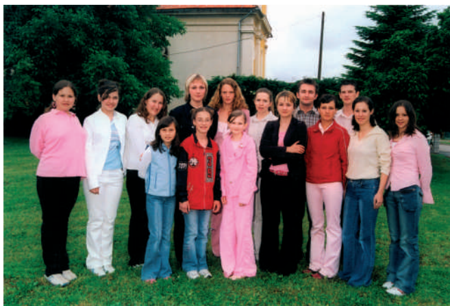
Zbor mladih naše župe

teško priznati koliko su nam puta oči zasjale čuvši prve taktove psalma ili toliko puta ispjevane: «Zdravo Marijo», »Moj Isus», »Bog je moj Spasitelj», »Braćo moja, radujmo se», »Želim klicati», »Ne boj se «