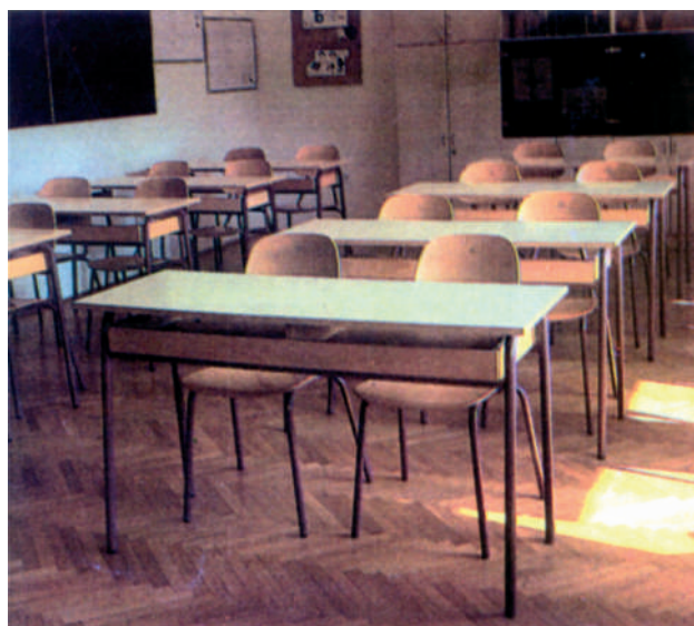
Iz proizvodnog asortimana