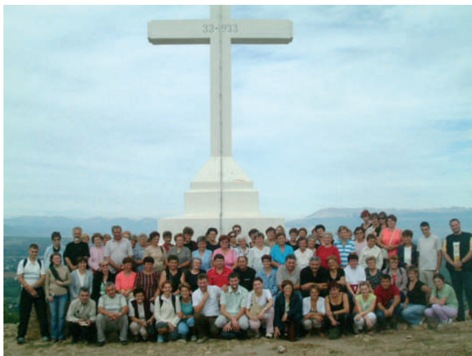
Hodočasnici u Međugorju