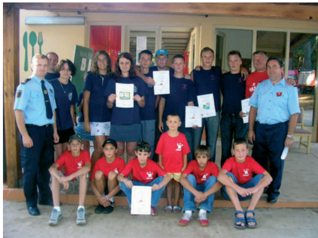
Članovi VZO Sveti Đurđ u Fažani