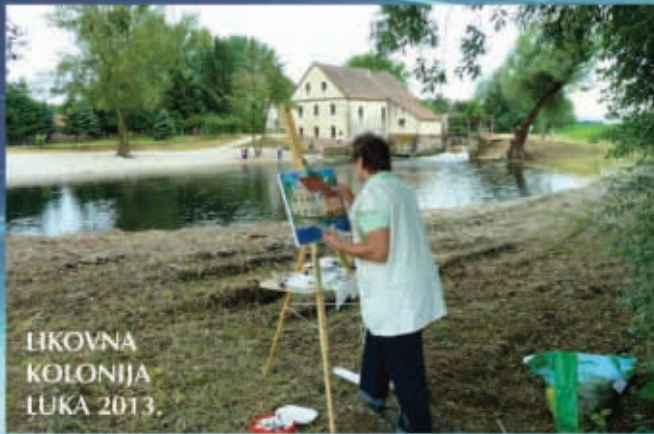
LIKOVNA KOLONIJA LUKA 2013.