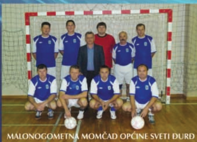
MALONOGOMETNA MOMČAD OPĆINE SVETI ĐURĐ