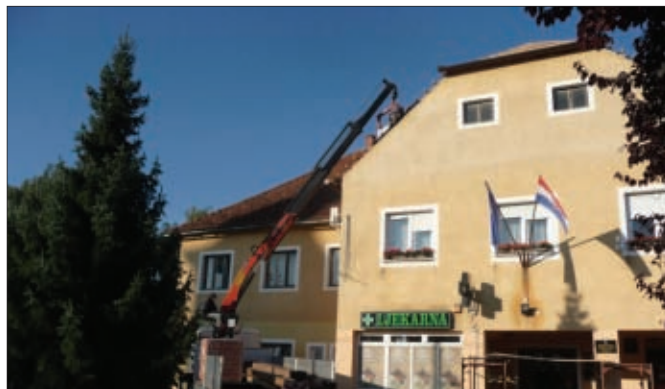
Radovi na krovu zgrade općine