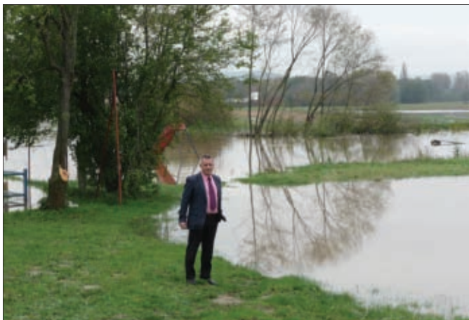
Obilazak poplavljenih površina