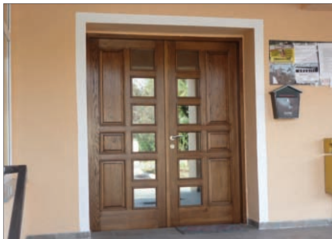
Nova ulazna vrata u zgradu općine