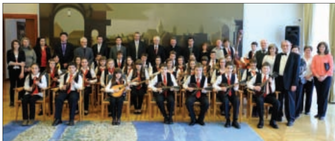
KUD Juraj Lončarić kod predsjednika Josipovića

Kulturno umjetničko društvo „Juraj Lončarić“ Hrženica, osnovano je 1987.godine i nosi ime svog osnivača. U društvu djeluju tamburaška, mandolinska i likovna sekcija. Kroz dugi niz ovih godina, prošlo je više od 250 djece, koja su svojim talentom i ljubavlju prema glazbi, djelovala i održavala KUD. Danas društvo broji 40 članova – svirača.