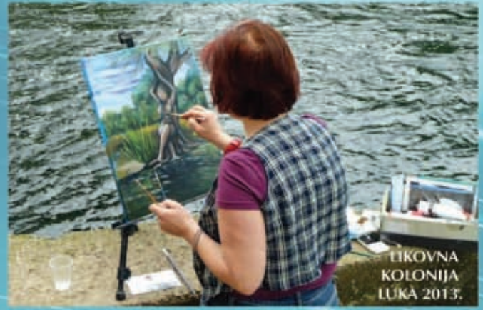
LIKOVNA KOLONIJA LUKA 2013.