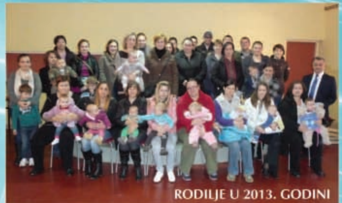
RODIJE U 2013. GODINI