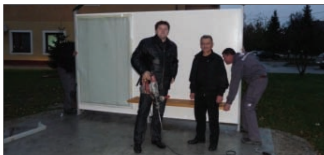
Postava autobusne nadstrešnice u Svetom Đurđu