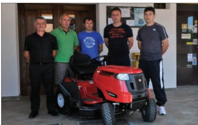
Darovana traktor kosilica NK Drava