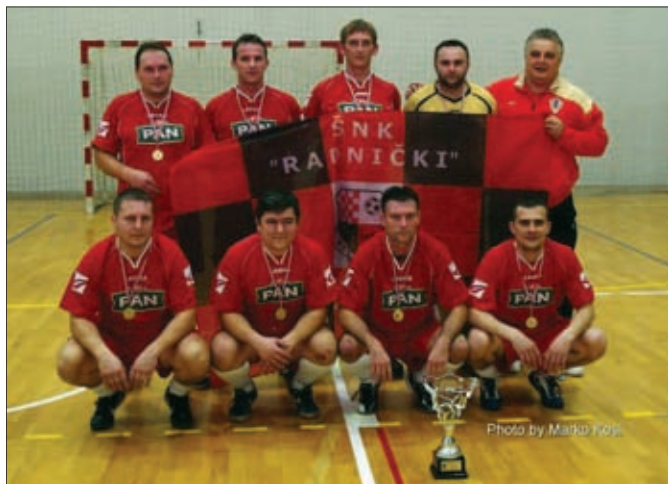
Veterani ŠNK Radnički Hrženica

Krajem 2012. i početkom 2013. godine, uz pomoć sponzora i donatora izrađen je klupski kalendar te podijeljen mještanima, članovima i sponzorima.