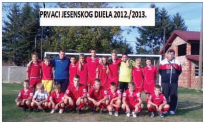
Pioniri Drava Sveti Đurđ 04.10.2013