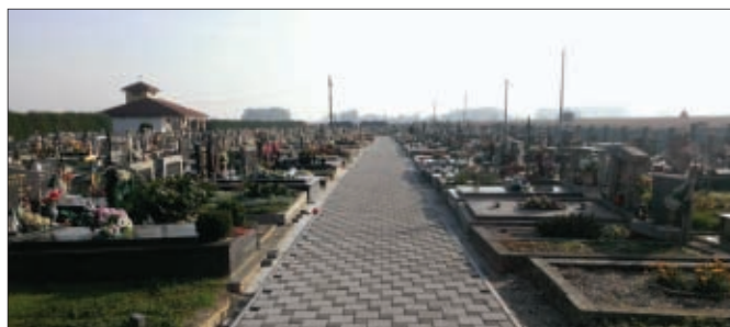
Groblje Sveti Đurđ - nova staza