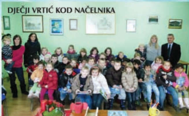
DJEČJI VRTIĆ KOD NAČELNIKA