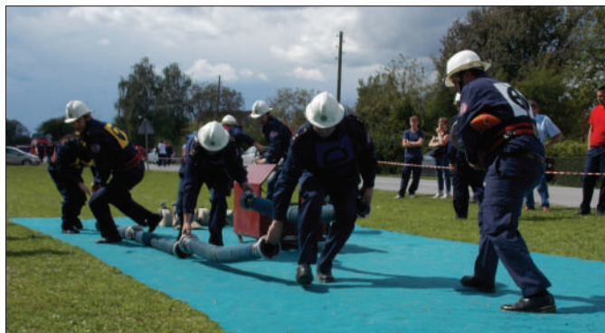
Detalj s regionalnog natjecanja u Hrženici

sno prijelazni pehar pokrovitelja Vatrogasne zajednice Varaždinske županije primili su članovi DVD-a Ludbreg.