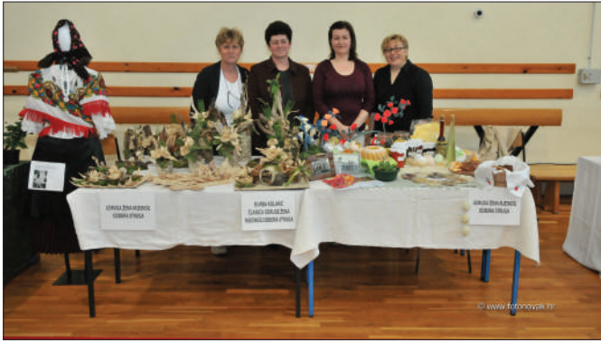
Durđevo - izlagači