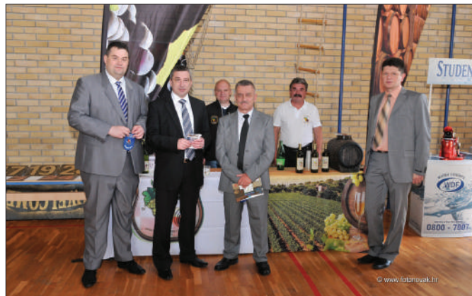
Grački Grozdek - izložba vina

Udruga vinogradara i vinara Grački Grozdek osnovana je 2011.godine u cilju okupljanja i organiziranja članova radi unapređenja i razvoja vinogradarske i vinarske proizvodnje, razmjene iskustava i pružanja stručne pomoći svojim članovima, za što uspješniju proizvodnju i plasman proizvoda od grožđa i vina.