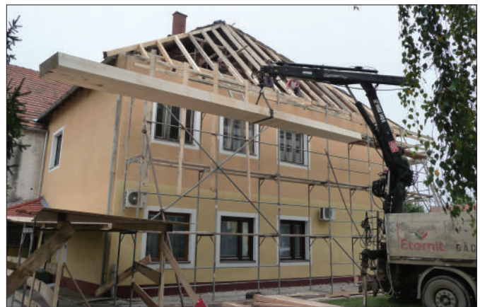
Zgrada Općine - radovi na krovu