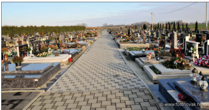
Groblje Sveti Đurđ