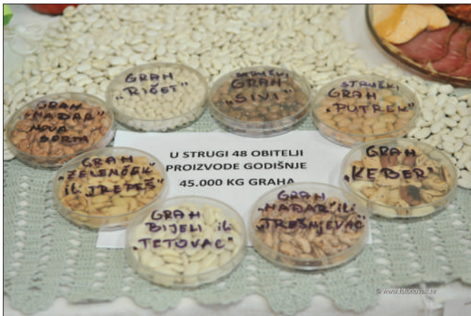
Đurđevo - Struški grah