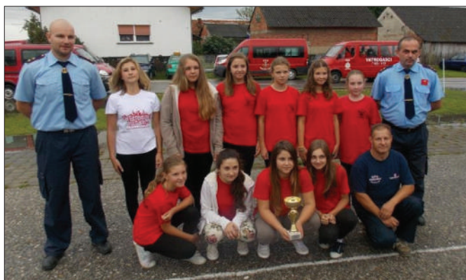
Po prvi je puta u povijesti općine formirano odjeljenje mladeži – DVD Hrženica

novog vatrogasnog doma DVD-a Sveti Đurđ, središnjeg Društva na području općine. Nakon dugotrajnog rješavanja građevinske i druge dokumentacije, krajem 2011. godine započela je izgradnja objekta, a krov je postavljen sredinom 2012. godine.