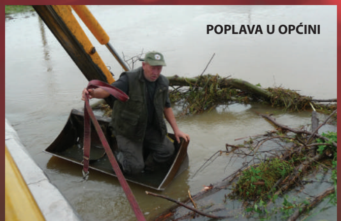
POPLAVA U OPĆINI