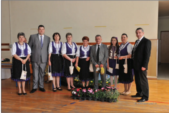
Đurđevo - žene