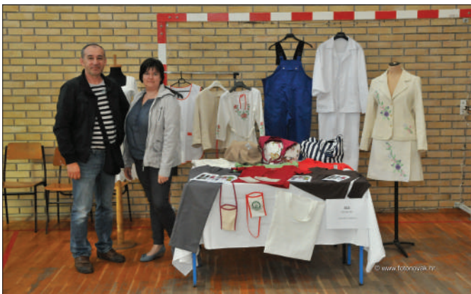
Durđevo - izlagači