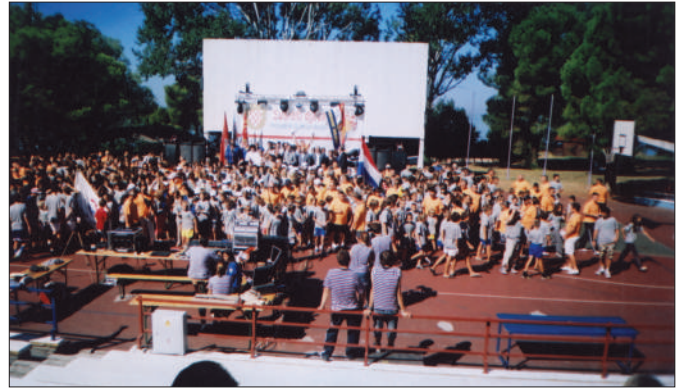
Susret djece Hrvatskih branitelja Savudrija 2014. na kojima je sudjelovalo 17-tero djece hrvatskih branitelja sa područja Općine Sveti Đurđ

7) Pravna pomoć članovima udruge, kao i članovima njegove obitelji u ostvarivanju njihovih prava u okviru mogućnosti udruge.