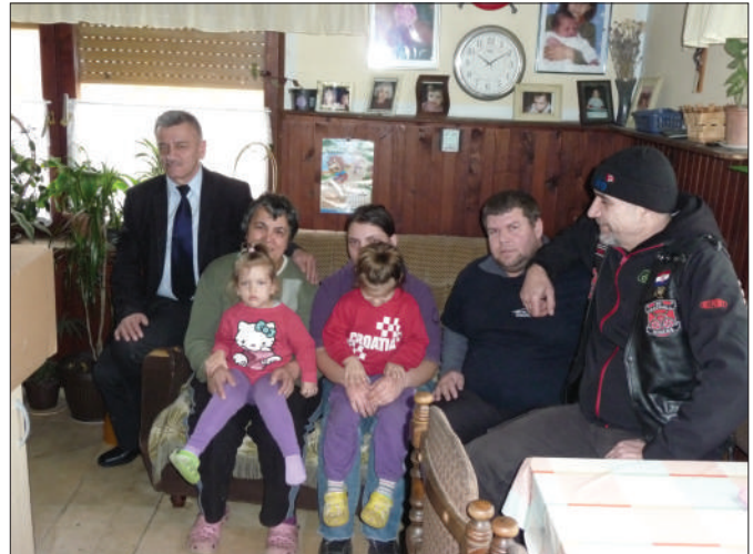
Solidarnost na djelu – Tentorium d.o.o. i MK Crazy Hill

SREDSTVA MINISTARSTVA GOSPODARSTVA I MINISTARSTVA REGIONALNOG RAZVOJA I FON- DOVA EUROPSKE UNIJE, REPUBLIKE HRVATSKE I ŽUPANIJSKE UPRAVE ZA CESTE VARAŽDINSKE ŽUPANIJE