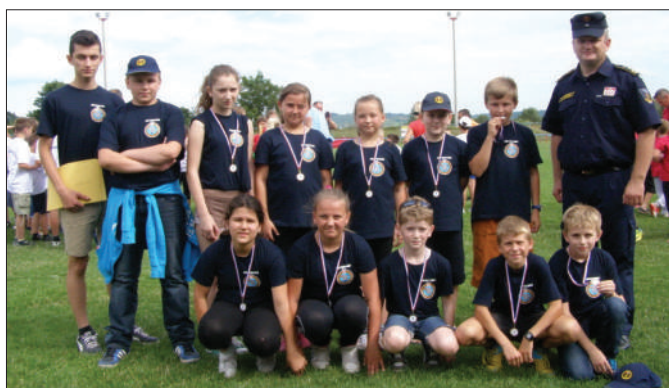
Općinski prvaci – mališani DVD-a Sveti Đurđ