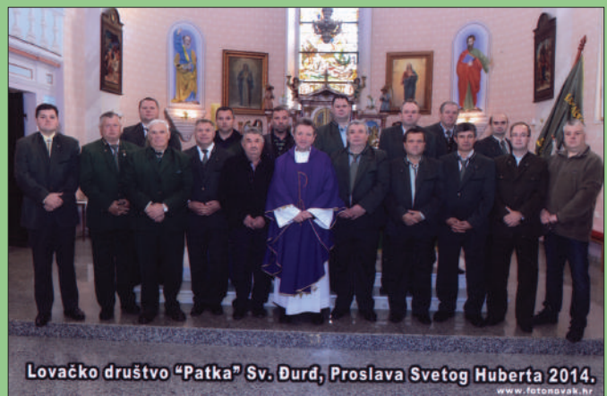
Lovačko društvo „Patka“ Sv. Đurđ, Proslava Svetog Huberta 2014.

Tradicija obilježavanja Svetog Huberta nastavila se i ove godine misom 02.11.2014. u Župnoj crkvi u Svetome Đurđu. Osim novih lovno-gospodarskih objekata izgrađenih u samome lovištu, samo dvorište lovačkog dvorišta obogatili smo novim roštiljem, te boksevima za naše lovačke pomagače.