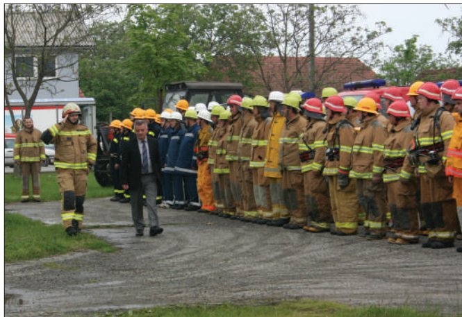
Smotra vatrogasnih snaga u vježbi „Karlovec 2014“

Posljednje događanje u sklopu obilježavanja dana Općine Sveti Đurđ, odnosno blagdana «Đurđeva», ove je godine bila pokazna taktička vatrogasna vježba pod nazivom «Karlovec 2014». U vježbi održanoj 26. travnja sudjelovalo je 55 vatrogasaca sa 8 vozila iz DVD-ova Sveti Đurđ, Hrženica, Karlovec Ludbreški, Komarnica Ludbreška, Sesvete Ludbreške i Struga. U okviru vježbe izvedeno je nekoliko taktičkih zadataka, uključujući gašenje „požara vozila“, gašenje požara u stambenom objektu, gašenje