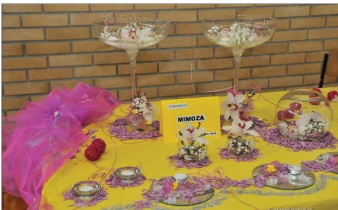
Durđevo - izlagači

Središnja svečanost povodom otvorenja zacrtanih projekata Općine Sveti Đurđ za 2014. godinu održana je 25. studenoga 2014. godine. Projekti su realizirani u suradnji sa Varaždinskom županijom, Županijskom upravom za ceste, Ministarstvom gospodarstva i Ministarstvom regionalnih razvoja.