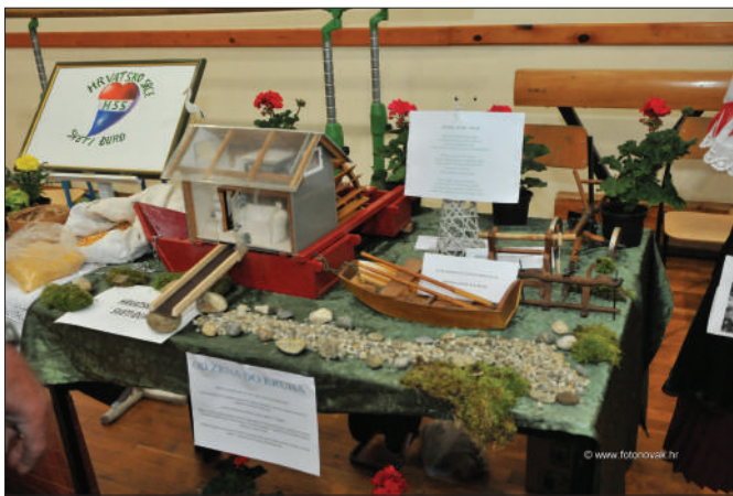
Đurđevo - izlagači