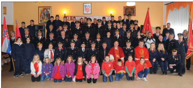
Zajednička fotografija na Florijanovo u Hrženici