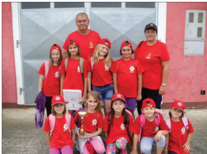
Najuspješnije članice DVD-a Komarnica Ludbreška

U posljednjih nekoliko godina daleko najvažnija investicija u vatrogasnu djelatnost svakako je izgradnja