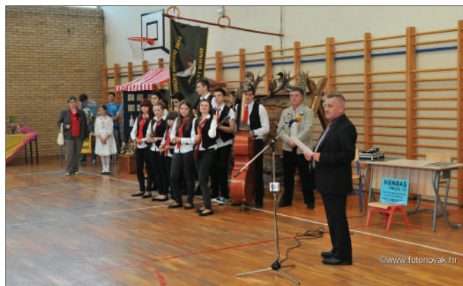
Đurđevo - otvorenje sajma