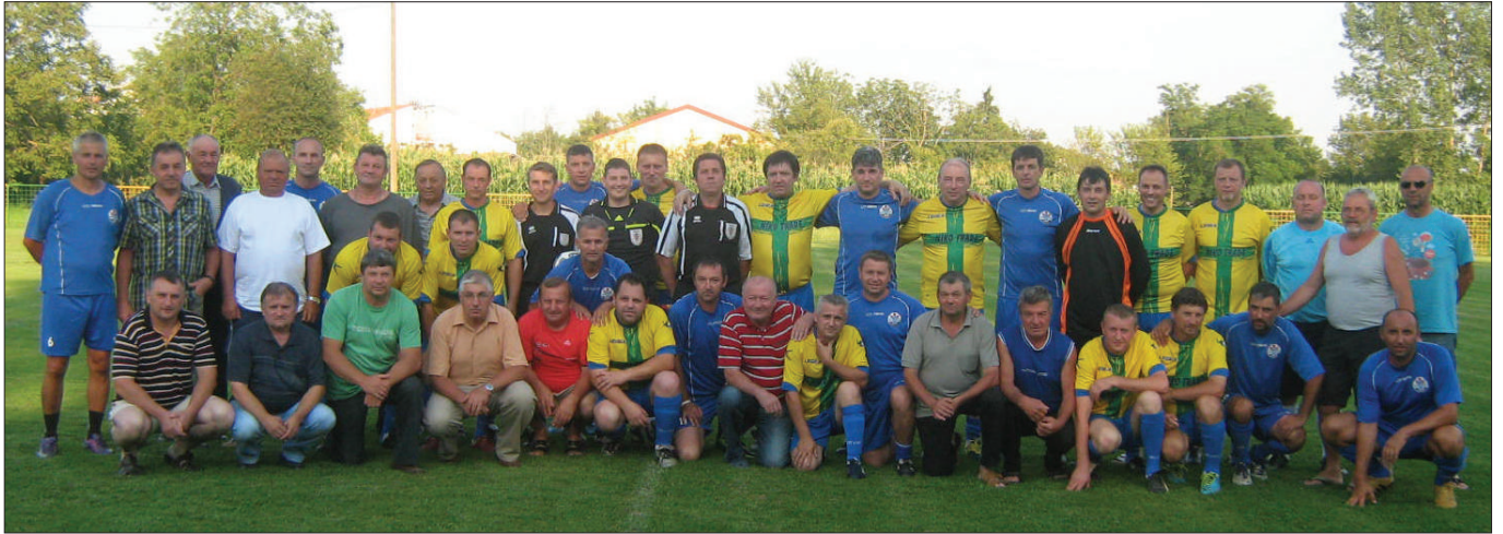
Zajednička fotografija povodom proslave 80-te godišnjice ŠNK "Drava" - Sveti Đurđ

Općina je ove godine uložila mnogo novčanih i materijalnih sredstava u naš Klub.