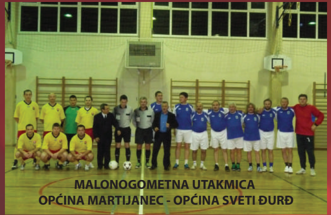
MALONOGOMETNA UTAKMICA OPĆINA MARTIJANEC - OPĆINA SVETI ĐURĐ