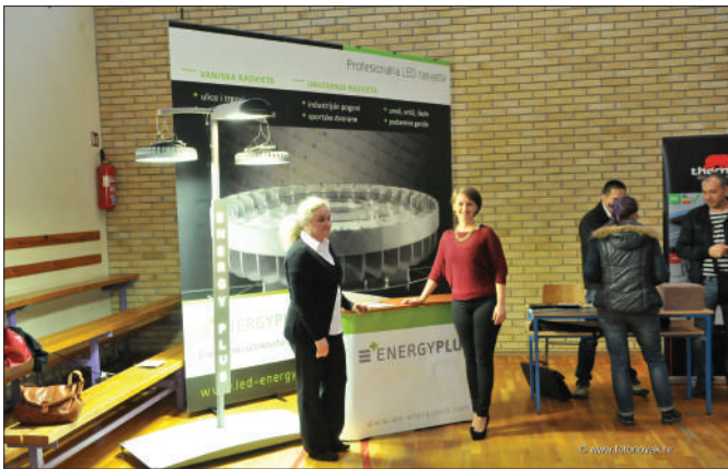
Durđevo - izlagači