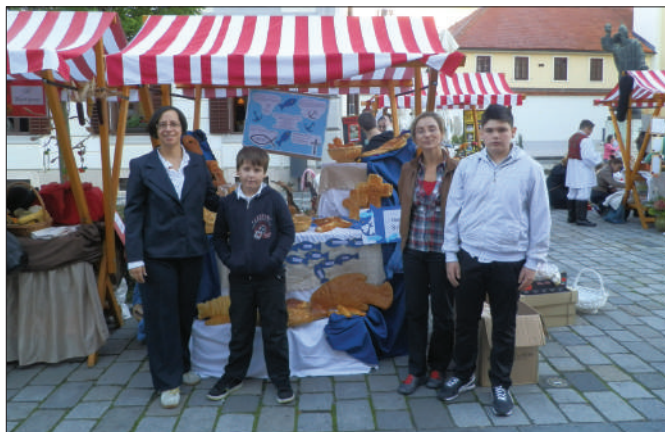
Županijska smotra Dani kruha