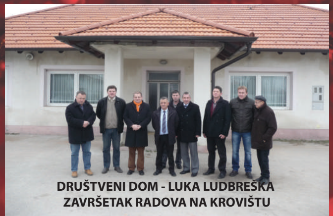
DRUŠTVENI DOM - LUKA LUDBREŠKA ZAVRŠETAK RADOVA NA KROVIŠTU