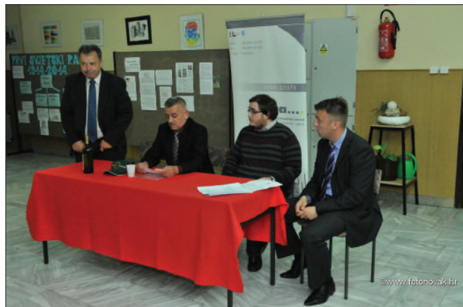
Đurđevo - kako do EU fondova