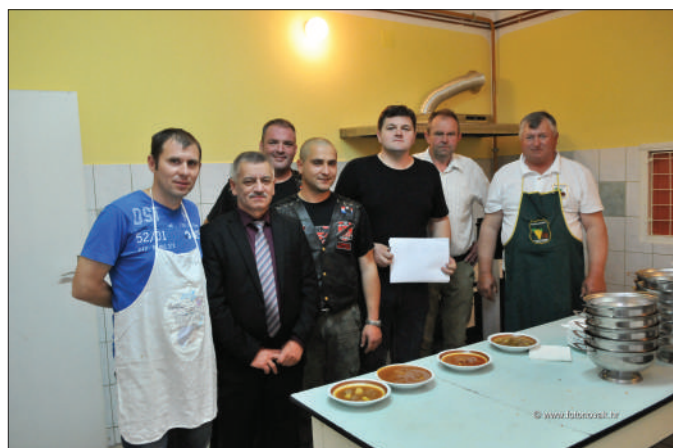
Đurđevo - natjecanje