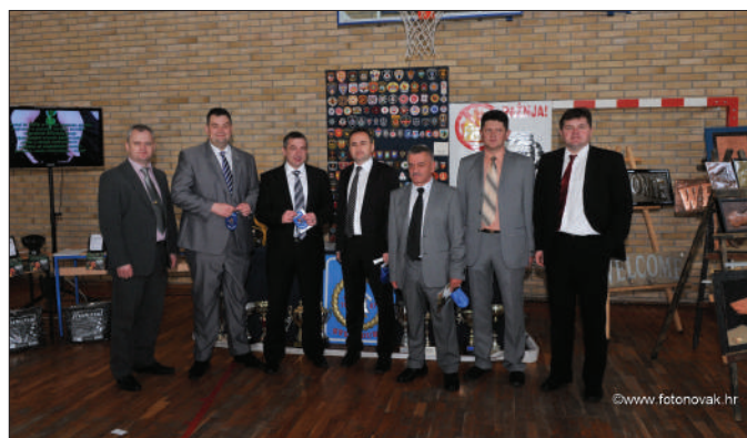
Đurđevo - sajam