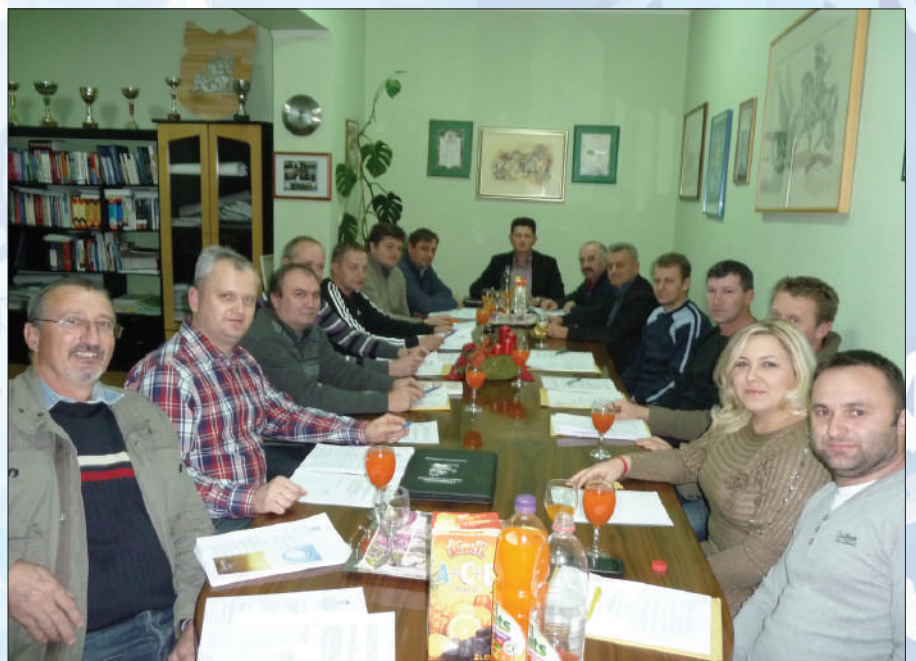
Općinsko vijeće Općine Sveti Đurđ