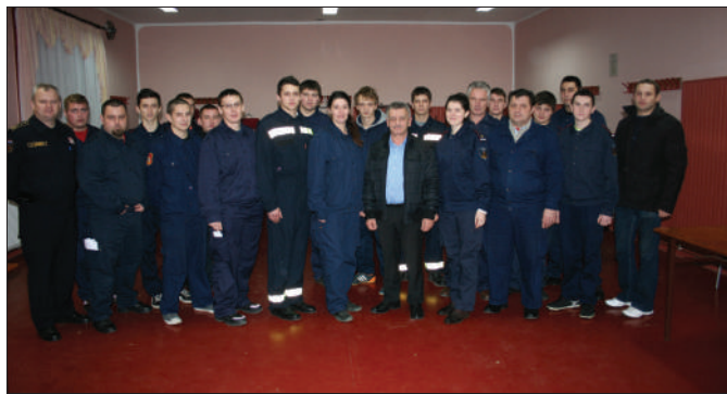
Novoosposobljeni vatrogasci u VZO Sveti Đurđ