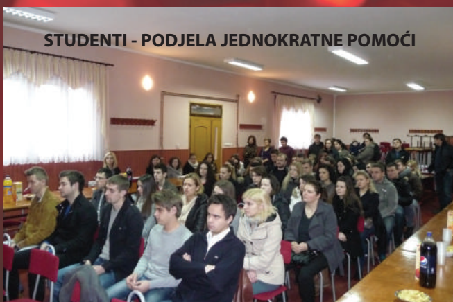
STUDENTI - PODJELA JEDNOKRATNE POMOĆI