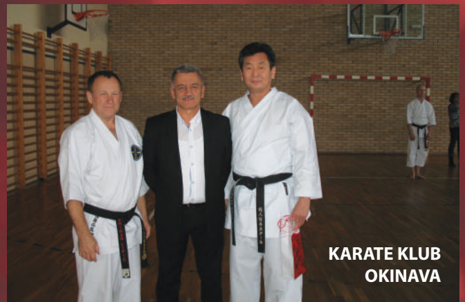
KARATE KLUB OKINAVA