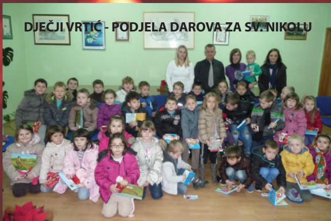
DJEČJI VRTIĆ - PODJELA DAROVA ZA SV. NIKOLU